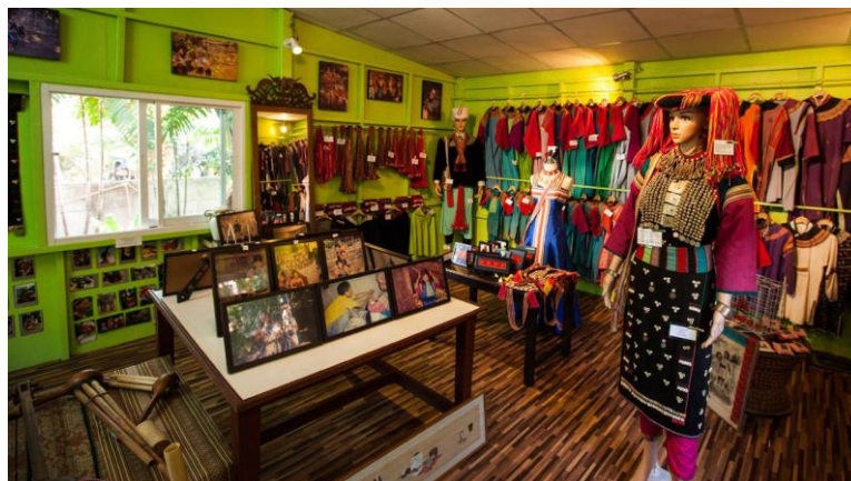
ภาพที่ 2 การจัดแสดงภาพถ่ายและเครื่องแต่งกายหลากหลายสีลันภายในศูนย์มรดกชาติพันธุ์ลีซู