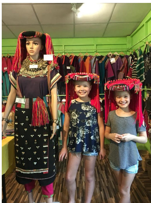
ภาพที่ 3 เด็กชาวต่างชาติมีความสนใจเรียนรู้เครื่องแต่งกายของชาวลีซู

ยิ่งไปกว่านั้น ศูนย์มรดกชาติพันธุ์ลีซูต้องการสื่อสารกับสังคมภายนอกว่า ชุมชนชาติพันธุ์บนพื้นที่สูงต่างมีประวัติศาสตร์ อัตลักษณ์ และภูมิปัญญาของตนเอง ที่ควรได้รับการรับฟังและทำความเข้าใจอย่างเท่าเทียม การเปิดพื้นที่ให้ชุมชนได้เล่าเรื่องของตนเองจึงเป็นการท้าทายภาพจำและอคติที่เคยมีต่อกลุ่มชาติพันธุ์ในอดีต