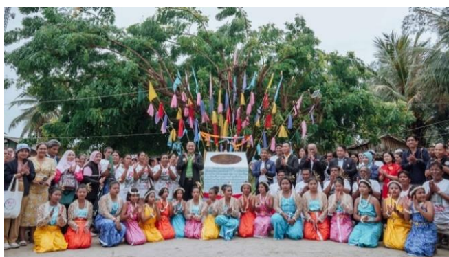
ภาพที่ 3: ชาวอุรุกรลาโวจเกาะหลีเป๊ะ-เกาะอาดังและหน่วยงานต่าง ๆ ร่วมเฉลิมฉลองการประกาศพื้นที่คุ้มครองวิถีชีวิตกลุ่มชาติพันธุ์