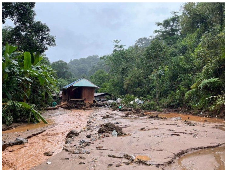
ภาพที่ 17: ความเสียหายจากน้ำป่าไหลหลากและดินโคลนถล่มของชุมชนบ้านห้วยหินลาดในวันที่ 23 กันยายน 2567

ท่ามกลางสถานการณ์ความท้าทายและอคติที่มีต่อการทำไร่หมุนเวียนของชุมชนชาติพันธุ์ สมาคมปกากะญอเพื่อการพัฒนาอย่างยั่งยืน (PASD) ร่วมกับภาคีเครือข่ายชาติพันธุ์และชนเผ่าพื้นเมือง จัดงาน “The Rotate Festival : เทศกาลระบบอาหารชนเผ่าพื้นเมือง” ภายใต้ธีม “มาเดาะ มากะ” หรือการเอามื้อเอารันในไร่หมุนเวียนช่วงฤดูเก็บเกี่ยว ระหว่างวันที่ 26-27 ต.ค. 2567 แสดงให้เห็นการดำรงอยู่ชุมชนชาติพันธุ์ที่มีศักยภาพในการแลกเปลี่ยนแรงงานเพื่อเก็บเกี่ยวผลผลิตในไร่ บริหารจัดการแรงงานที่ไม่ต้องมีค่าใช้จ่าย การจัดงานครั้งนี้ยังเป็นพื้นที่การจัดแสดงและจำหน่ายผลิตภัณฑ์ที่เกิดขึ้นจากไร่หมุนเวียน ซึ่งเป็นผลผลิตจากภูมิปัญญาของกลุ่มชาติพันธุ์ เช่น เห็ดลมทอด และ ห่อหมกหมูใส่เปลือกมะขามป้อม จากชุมชนบ้านห้วยอีช้าง ชนเผ่าปกากะญอ จ.เชียงใหม่ น้ำพริกไส้เปรี้ยว กินกับหน่อไม้ และผักตามฤดูกาลในช่วงฤดูฝนจากไร่หมุนเวียนชุมชนสะเน่พ่อง จ.กาญจนบุรี, หรือเมนูยำหอย และห่อหมกปลา จากทะเลของชาวมอแกลน ภาคใต้ของประเทศไทย 19 การจัดงานดังกล่าวเป็นส่วนสำคัญที่ช่วยให้เกิดพื้นที่ของการสื่อสารวิถีชีวิต วัฒนธรรม การดำรงอยู่ของชุมชนชาติพันธุ์ ตลอดจนการนำเสนอให้เห็นความหลากหลายของผลผลิตที่เกิดขึ้นจากไร่หมุนเวียนและระบบนิเวศที่อยู่รายล้อมชุมชนชาติพันธุ์ ซึ่งเป็นภูมิปัญญาในการทำการเกษตรของชุมชนชาติพันธุ์บนความสัมพันธ์กับการอนุรักษ์ ฟื้นฟูและใช้ประโยชน์จากทรัพยากรธรรมชาติอย่างมั่นคงและยั่งยืน