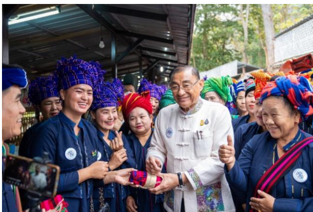
ภาพที่ 1: อธิบดีรัฐมนตรีว่าการกระทรวงวัฒนธรรม นายเสริมศักดิ์ พงษ์พานิช เดินทางร่วมกิจกรรม “KICK OFF : กฎหมายชาติพันธุ์ เดินหน้าคุ้มครองสิทธิและส่งเสริมวิถีชีวิตทุกกลุ่มวัฒนธรรมบนความเสมอภาค”

อย่างไรก็ดี เมื่อวันที่ 25 กันยายน 2567 ร่าง พ.ร.บ. คุ้มครองและส่งเสริมวิถีชีวิตกลุ่มชาติพันธุ์ พ.ศ. ... ได้เข้ารับการพิจารณาวาระ 2 ในการประชุมสภาผู้แทนราษฎร ครั้งที่ 26 ซึ่งได้มีการอภิปรายแสดงข้อห่วงใยเกี่ยวกับประเด็นการระบุว่า “ชนเผ่าพื้นเมือง” ในกฎหมายและการกำหนดหน่วยงานที่จะทำหน้าที่บังคับใช้กฎหมายดังกล่าวว่าจะมีขอบเขตและอำนาจหน้าที่อย่างไร ที่ประชุมสภาผู้แทนราษฎรจึงเสนอให้นำร่างกฎหมายดังกล่าวกลับไปพิจารณาปรับปรุงแก้ไขอีกครั้ง ซึ่งปัจจุบัน (ณ เดือนธันวาคม 2567) คณะกรรมาธิการฯ ได้ร่วมกันพิจารณา ปรับปรุงแก้ไขร่างพระราชบัญญัติคุ้มครองและส่งเสริมวิถีชีวิตกลุ่มชาติพันธุ์เรียบร้อยแล้ว และอยู่ระหว่างเตรียมเสนอเข้าที่ประชุมสภาผู้แทนราษฎรอีกครั้งในวันที่ 8 มกราคม 2568 5