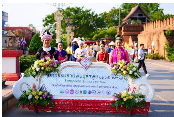
ภาพที่ 8: งานมหกรรมชาติพันธุ์ลำพูน ประจำปี 2567