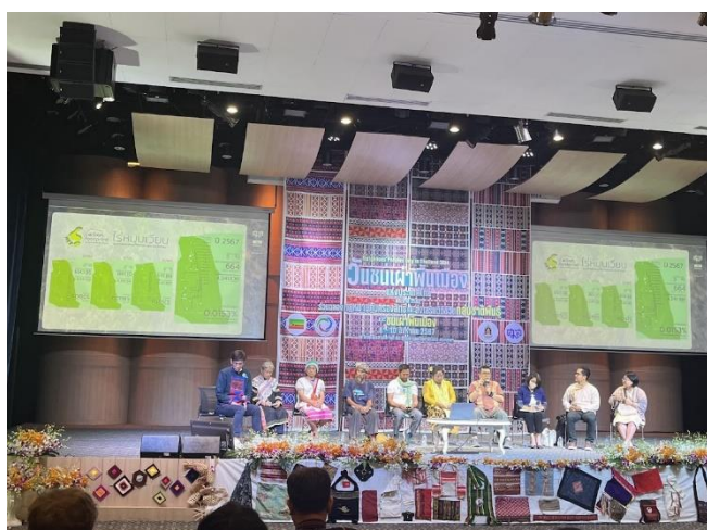
ภาพที่ 16: เวทีเสวนา “โรงเรียนภาคสนาม บทเรียนจากการจัดการพื้นที่คุ้มครองวิถีชีวิตด้วยตนเอง”

การต่อสู้กับม่านหมอกอคติชาติพันธุ์ ในฐานะผู้รู้เกี่ยวกับทรัพยากรธรรมชาติยังปรากฏเวทีนำเสนอข้อมูลบทเรียนและรูปธรรมการดำเนินงานในระดับพื้นที่อย่างต่อเนื่อง โดยในวันที่ 9 เดือนสิงหาคม 2567 ในระหว่างการจัดงานรณรงค์เฉลิมฉลองเนื่องในวันชนเผ่าพื้นเมือง ได้มีการจัดเวทีเสวนา “โรงเรียนภาคสนาม บทเรียนจากการจัดการพื้นที่คุ้มครองวิถีชีวิตด้วยตนเอง” เป็นการพัฒนาแนวทางส่งเสริมศักยภาพชุมชนชาติพันธุ์ให้มีความสามารถในการสำรวจ จัดเก็บ และบริหารจัดการข้อมูลชุมชน ทั้งในด้านประวัติศาสตร์ วิถีชีวิต วัฒนธรรม การอนุรักษ์และบริหารจัดการทรัพยากรธรรมชาติบนฐานภูมิปัญญา โดยในช่วงหนึ่งได้มีการนำเสนอบทเรียนการดำเนินงานของชุมชนชาติพันธุ์กะเหรี่ยงบ้านดอยช้างป่าแป๋ ต.ป่าพลู อ.บ้านโฮ้ง จ.ลำพูน ที่นำเสนอให้เห็นการพัฒนาแนวทางการสำรวจ จัดเก็บข้อมูลโดยสร้างกระบวนการมีส่วนร่วมจากกลุ่มเยาวชน และนำข้อมูลที่ได้มาบริหารจัดการพัฒนาให้เกิดระบบฐานข้อมูลที่มีความทันสมัย สามารถสื่อสารให้เห็นเป็นรูปธรรมเชิงประจักษ์ได้ง่าย โดยเฉพาะข้อมูลการบริหารจัดการไร่หมุนเวียนของชุมชนที่พบว่า พื้นที่ไร่หมุนเวียนของชุมชนทั้งหมดมี 2,324 ไร่ แต่ที่สำคัญและจำเป็นต้องอธิบายให้สังคมเข้าใจคือ ชาวบ้านไม่ได้ใช้พื้นที่