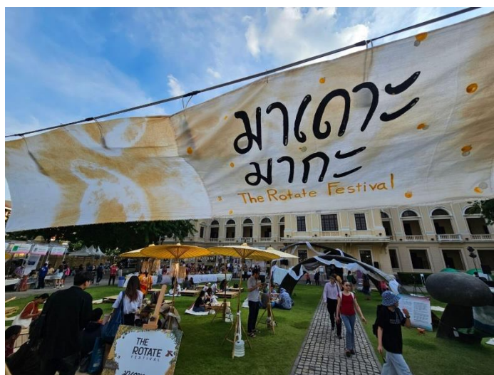
ภาพที่ 18: บรรยากาศงาน The Rotate Festival ณ มิวเซียมสยาม