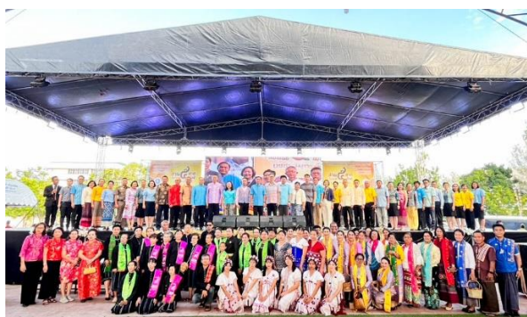
ภาพที่ 9: งาน “สานสัมพันธ์ 5 ชาติพันธุ์ เพชรสมุทรคีรี”

นอกจากนี้ยังพบว่า การจัดกิจกรรมเฉลิมฉลองวันสากลแห่งสหประชาชาติว่าด้วยชนเผ่าพื้นเมืองดั้งเดิมของโลก ระหว่างวันที่ 8-10 สิงหาคม 2567 ณ ศูนย์มานุษยวิทยาสิรินธร (องค์การมหาชน) กรุงเทพฯ ถือเป็นกิจกรรมที่จัดขึ้นภายใต้ธีม “Soft Power ชาติพันธุ์ พลังสร้างสรรค์ชาติ” เป็นการเปิดพื้นที่และโอกาสให้เครือข่ายกลุ่มชาติพันธุ์กว่า 60 กลุ่มชาติพันธุ์เข้าร่วมงาน นำเสนอให้เห็นถึงบรรยากาศการแสดงศิลปะดนตรีและวัฒนธรรมร่วมสมัย และการเดินแบบเครื่องแต่งกาย และตลาดนวัตกรรมอาหารกลุ่มชาติพันธุ์ ตลอดจนมีเวทีถอดบทเรียนการจัดการพื้นที่คุ้มครองวิถีชีวิตกลุ่มชาติพันธุ์ ที่กล่าวถึงการสร้างสรรค์นวัตกรรมชุมชนผ่านการผสมผสานภูมิปัญญาท้องถิ่นกับองค์ความรู้ใหม่