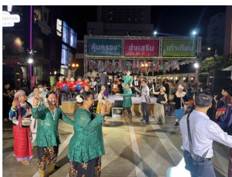
ภาพที่ 6: บรรยากาศความสนุกสนานร่วมกันของกลุ่มชาติพันธุ์กับผู้เข้าร่วมงาน