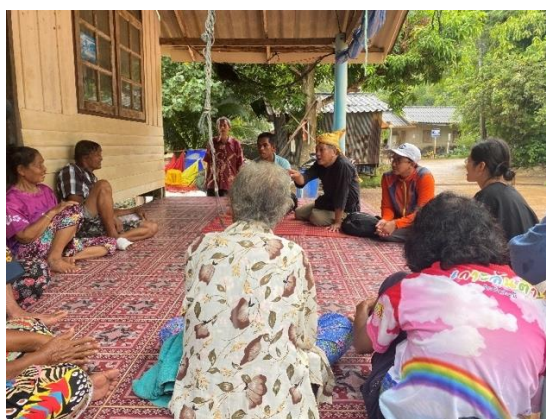
ภาพที่ 13: การพูดคุยแลกเปลี่ยนระหว่างกลุ่มชาติพันธุ์ชาวเลจากประเทศไทยและประเทศอินโดนีเซีย โดยใช้ภาษาอูรักลาโว้ย

อย่างไรก็ดี แม้อีกด้านนโยบายในระดับภูมิภาคและนานาชาติจะไม่ใช่รูปธรรมเท่าไรนัก แต่ความเข้มแข็งของกลุ่มชาติพันธุ์ในงานรวมญาติชาติพันธุ์ชาวเล ครั้งที่ 14 ณ ชุมชนโตะบาหลิว ตำบลศาลาด่าน อำเภอกะลันตา จังหวัดกระบี่ ที่จัดขึ้นระหว่างวันที่ 21-22 พฤศจิกายน 2567 ยังได้รับความสนใจจากผู้แทนกลุ่มชาติพันธุ์อูรักลาโว้ยและกลุ่มชาติพันธุ์บาจาวจากประเทศอินโดนีเซีย ที่มีภาษาและประวัติศาสตร์ที่คล้ายคลึงกับกลุ่มชาติพันธุ์อูรักลาโว้ยที่อาศัยอยู่ในแถบทะเลอันดามันของประเทศไทย ทำให้บรรยากาศงานรวมญาติชาติพันธุ์ชาวเลเกิดการแลกเปลี่ยนด้านวัฒนธรรมระหว่างสองประเทศ ตลอดจนเป็นพื้นที่ในการเรียนรู้แนวปฏิบัติที่ดีด้านการจัดการเรียนการสอนภาษาอูรักลาโว้ยและการสร้างเครือข่ายชาวเลที่เข้มแข็งในประเทศไทย ทำให้เมื่อวันที่ 11-15 ธันวาคม 2567 ผู้แทนจากประเทศอินโดนีเซียได้นำแนวคิดเรื่องกิจกรรมงานรวมญาติชาติพันธุ์ชาวเลในประเทศไทยไปปรับใช้ในบริบทพื้นที่ของตน ผ่านการจัดกิจกรรมงานรวมญาติกลุ่มชาติพันธุ์ชาวเลบาจาว ที่กระจายตัวอยู่ใน 14 จังหวัด บริเวณภาคกลางและภาคตะวันออกของประเทศอินโดนีเซีย เพื่อศึกษาประวัติศาสตร์การอพยพย้ายถิ่นฐาน มรดกภูมิปัญญาทางวัฒนธรรม และข้อท้าทายด้านต่าง ๆ ที่ส่งผลกระทบต่อวิถีการดำเนินชีวิตทางทะเล ตลอดจนมีการเชิญองค์กรจากทั่วภูมิภาคเอเชียตะวันออกเฉียงใต้ที่มีชาวเลอาศัยอยู่ อาทิ องค์กรจากประเทศมาเลเซีย ประเทศฟิลิปปินส์ ประเทศสิงคโปร์ และประเทศไทย เข้าร่วมหารือด้านนโยบายและกฎหมายในระดับประเทศที่เกี่ยวข้องกับการคุ้มครองและส่งเสริมสิทธิชาวเล