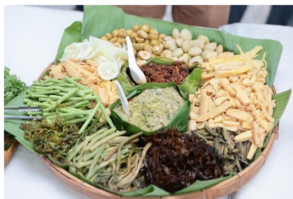
ภาพที่ 11: อาหารภายในกิจกรรม Soft Power ชาติพันธุ์ พลังสร้างสรรค์ชาติ

นอกจากนี้ ในปี 2567 ได้ปรากฏการถ่ายทอดเรื่องราวของกลุ่มชาติพันธุ์ชาวเลผ่านละครซีรีส์เรื่อง “กล้าทะเล” จำนวน 12 ตอน ออกอากาศทางช่อง ThaiPBS ในวันศุกร์ – วันอาทิตย์ ในช่วงปลายเดือนกันยายน - ตุลาคม 2567 ถือเป็นละครโทรทัศน์เรื่องแรก ๆ ที่นำเสนอให้เห็นวิถีการดำรงชีวิตของชาวเลมอแกลน เกาะสุรินทร์ ท่ามกลางการเปลี่ยนแปลงจากกระแสการพัฒนาและอุตสาหกรรมการท่องเที่ยว ทำให้ชาวเลรุ่นใหม่ต้องปรับตัวให้เท่าทันการเปลี่ยนแปลง 13 ละครซีรีส์นี้สะท้อนให้เห็นว่าสังคมไทยมีกลุ่มชาติพันธุ์ที่มีวิถีวัฒนธรรมและภูมิปัญญาที่หลากหลายดำรงอยู่ในทุกภูมิภาค มีวิถีการดำรงชีวิตที่สัมพันธ์กับระบบนิเวศและทรัพยากรธรรมชาติที่สามารถอยู่ร่วมกันได้อย่างมั่นคงและยั่งยืน หากแต่ภายใต้กระแสการพัฒนาที่นำพาการเปลี่ยนแปลงของยุคสมัย จึงเป็นเงื่อนไขให้กลุ่มชาติพันธุ์ต้องเรียนรู้ที่จะปรับตัวเพื่อให้สามารถดำรงชีวิตอยู่ได้ โดยคาดหวังให้สังคมได้เรียนรู้และยอมรับในวิถีวัฒนธรรมที่แตกต่างหลากหลาย และใช้ทุนทางวัฒนธรรมซึ่งเป็น Soft power มาใช้เป็นเครื่องมือในการพัฒนาอย่างสร้างสรรค์ต่อไป