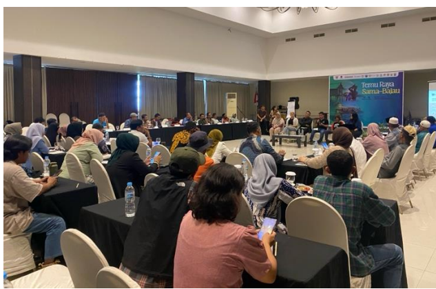
ภาพที่ 14: บรรยากาศการหารือของกลุ่มชาติพันธุ์บาจาวประเทศอินโดนีเซีย