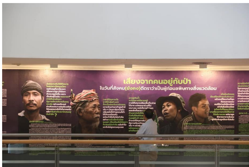
ภาพที่ 15: การจัดนิทรรศการเสียงจากคนอยู่กับป่าในงาน “ไฟป่า ฝุ่นควัน ชาติพันธุ์ ไร่มนเวียน”

ในปี 2567 กลุ่มชาติพันธุ์ยังคงเผชิญกับอคติทางชาติพันธุ์ที่มองว่าการดำรงชีวิตของชุมชนชาติพันธุ์ในพื้นที่ป่า เป็นสาเหตุของปัญหาด้านสิ่งแวดล้อมและเสื่อมโทรมของทรัพยากรธรรมชาติ และโดยเฉพาะอย่างยิ่งเมื่อต้องเผชิญกับกับสถานการณ์ปัญหาหมอกควันและฝุ่น PM 2.5 ตลอดจนปัญหาน้ำท่วม น้ำป่าไหลหลากในเดือนกันยายน-พฤศจิกายน ในพื้นที่ภาคเหนือที่ผ่านมา ชุมชนชาติพันธุ์มักจะเป็นกลุ่มคนแรก ๆ ที่ต้องแบกรับแรงเสียดทานกับการถูกกล่าวหาว่าเป็นสาเหตุและเงื่อนไขสำคัญที่ทำให้เกิดปัญหาดังกล่าว นำมาสู่การถูกเกลียดในพื้นที่สาธารณะมากขึ้น ซึ่งในด้านหนึ่งถือเป็นส่วนสำคัญที่ก่อให้เกิดการศึกษา พัฒนาองค์ความรู้มาใช้เพื่ออธิบายบนหลักการทางวิทยาศาสตร์และการออกแบบการศึกษาวิจัยอย่างระบบ เพื่อยืนยันว่าชุมชนชาติพันธุ์ไม่ได้เป็นส่วนสำคัญที่ทำให้ปัญหาด้านสิ่งแวดล้อมเพียงฝ่ายเดียว ดังปรากฏการจัดเวทีเปิดตัวงานวิจัย ในงาน “ไฟป่า ฝุ่นควัน ชาติพันธุ์ ไร่มนเวียน” ของมูลนิธิพัฒนาภาคเหนือ (มพน.) ร่วมกับชุมชนชาติพันธุ์สู้ไฟป่า และคณะสิ่งแวดล้อมและทรัพยากรศาสตร์ มหาวิทยาลัยมหาสารคาม เมื่อวันที่ 29 พฤษภาคม 2567 การจัดงานดังกล่าวได้นำเสนอให้เห็นว่าฝุ่นที่เกิดในพื้นที่ไม่ได้มีที่มาจากไฟไหม้เพียงอย่างเดียว แต่มีที่มาจากอุตสาหกรรมอื่นด้วย และโดยศักยภาพของป่าหมุนเวียนรอบพื้นที่สามารถรับการดักจับฝุ่นได้ แม่วิถีของชุมชนชาติพันธุ์จะมีการเผาเป็นขั้นตอนหนึ่งของการเตรียมพื้นที่เพาะปลูกหรือทำไร่ แต่พื้นที่โดยรอบก็สามารถรองรับมลพิษได้ ขณะเดียวกันไร่มนเวียนและป่าพักฟื้นยังเป็นแหล่งกักเก็บน้ำที่ดี สามารถพิสูจน์ได้ว่าไร่มนเวียนไม่ได้สร้างผลกระทบต่อสิ่งแวดล้อม และไม่ได้เป็นภาระทางสังคมและเศรษฐกิจ