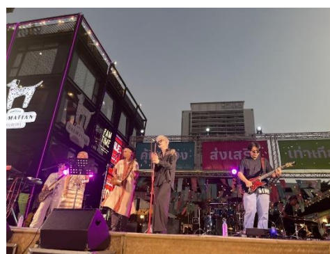
ภาพที่ 7: การแสดงดนตรีร่วมกันของศิลปินชาติพันธุ์กับศิลปินรุ่นใหม่ ณ ลานแสดงสยามสแควร์

การใช้กลไกซอฟต์แวร์เพื่อขับเคลื่อนเศรษฐกิจของประเทศไทย ได้รับความสนใจอย่างต่อเนื่องในปี 2567 ด้วยความพยายามของภาครัฐในการผลักดันทุนทางวัฒนธรรมด้านอาหาร ภาพยนตร์ แฟชั่น ศิลปะการต่อสู้ และเทศกาล ปฏิเสธไม่ได้ว่าทุนทางวัฒนธรรมของกลุ่มชาติพันธุ์นั้น สามารถก่อให้เกิดการพัฒนาทางเศรษฐกิจ สร้างรายได้และอาชีพเพื่อลดการพึ่งพาปัจจัยภายนอก ตลอดจนสร้างความตระหนักถึงความหลากหลายที่จะช่วยลดความขัดแย้งในสังคมไทย ที่ผ่านมา กลุ่มชาติพันธุ์มีพื้นที่เพิ่มมากขึ้นในการแสดงอัตลักษณ์ของตน และสร้างความสัมพันธ์ร่วมกับกลุ่มชาติพันธุ์อื่น ๆ ผ่านกิจกรรมทางวัฒนธรรมที่ได้รับการส่งเสริมและสนับสนุนจากหลายภาคส่วน ซึ่งได้ปรากฏการจัดกิจกรรมในรูปแบบที่หลากหลายตั้งแต่ต้นปี 2567 เป็นต้นมา ดังปรากฏการจัดงานเสียงชาติพันธุ์ลือลั่นทั่วสยาม เมื่อวันที่ 16 - 17 มีนาคม 2567 โดยใช้พื้นที่ลานแสดงใจกลางสยามสแควร์ กรุงเทพฯ นำเสนอการแสดงดนตรีเชื่อมวัฒนธรรมศิลปินชาติพันธุ์และศิลปินรุ่นใหม่ ที่นำเสนอการผสมผสานท่วงทำนองระหว่างดนตรีชาติพันธุ์กับดนตรีสมัยใหม่ได้อย่างลงตัว และเปิดพื้นที่ให้สาธารณชนสัมผัสวิถีวัฒนธรรมพื้นองชาติพันธุ์ผ่านนิทรรศการ Sound of Harmony ที่จัดแสดงเครื่องดนตรีชาติพันธุ์ สินค้าผลิตภัณฑ์ของกลุ่มชาติพันธุ์ และตลาดอาหาร แสดงให้เห็นศักยภาพของกลุ่มชาติพันธุ์ผ่าน