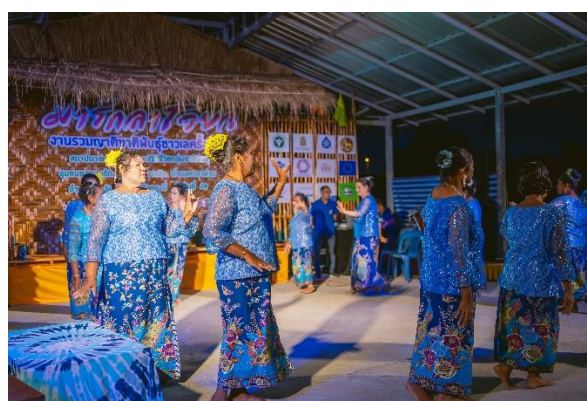
ภาพที่ 5: บรรยากาศงานรวมญาติชาติพันธุ์ชาวเล ครั้งที่ 14 ณ ชุมชนโต๊ะบาหลิว จังหวัดกระบี่

การขับเคลื่อนเขตพื้นที่คุ้มครองวิถีชีวิตกลุ่มชาติพันธุ์ยังถือเป็นประเด็นที่ต้องจับตามองกันต่อไป เนื่องจากเป็นประเด็นที่มีความท้าทายทั้งในระดับนโยบายและการปฏิบัติในพื้นที่ โดยเฉพาะภายใต้กรอบพระราชบัญญัติคุ้มครองและส่งเสริมวิถีชีวิตกลุ่มชาติพันธุ์ที่ได้บัญญัติให้มีหมวดที่ 5 ว่าด้วย “เขตพื้นที่วิถีชีวิตกลุ่มชาติพันธุ์” ไว้ในร่างกฎหมาย ซึ่งหากมีการพิจารณาและประกาศใช้ร่างกฎหมายดังกล่าวแล้ว จะช่วยยกระดับให้การขับเคลื่อนเขตพื้นที่คุ้มครองวิถีชีวิตกลุ่มชาติพันธุ์มีรูปธรรมของโครงสร้าง กลไก ระเบียบ และหลักเกณฑ์การทำงานทั้งในระดับนโยบายและระดับพื้นที่ที่ชัดเจนยิ่งขึ้น โดยเฉพาะการพัฒนาให้เกิดขึ้นแบบศูนย์การเรียนรู้การบริหารจัดการเขตพื้นที่คุ้มครองวิถีชีวิตกลุ่มชาติพันธุ์ เพื่อเป็นศูนย์กลางการขยายผลความรู้ แนวปฏิบัติการบริหารจัดการข้อมูล และการสร้างกระบวนการมีส่วนร่วมในการดำเนินงาน เพื่อขยายขอบเขตและต่อยอดการขับเคลื่อนเขตพื้นที่คุ้มครองวิถีชีวิตกลุ่มชาติพันธุ์