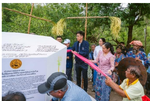
ภาพที่ 4: นางสาวสุดาวรรณ หวังศุภกิจโกศล รัฐมนตรีว่าการกระทรวงวัฒนธรรม เป็นประธานในการประกาศเขตพื้นที่คุ้มครองวิถีชีวิตกลุ่มชาติพันธุ์ ชุมชนโต๊ะบาหลิว จังหวัดกระบี่