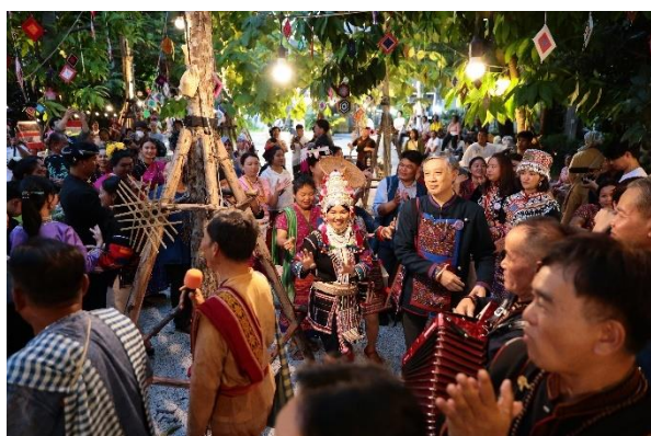
ภาพที่ 10: บรรยากาศการเฉลิมฉลองวันสากลแห่งสหประชาชาติว่าด้วยชนเผ่าพื้นเมืองดั้งเดิมของโลก “Soft Power ชาติพันธุ์ พลังสร้างสรรค์ชาติ”