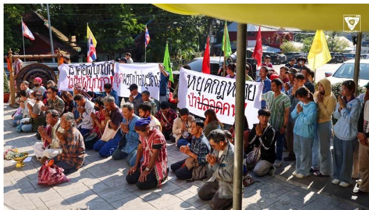
ภาพที่ 19: ภาคประชาชนร่วมคัดค้านร่าง พ.ร.ฎ. ป่าอนุรักษ์

และเขตห้ามล่าสัตว์ป่า สามารถอาศัยอยู่หรือทำกินในพื้นที่ต่อไปได้ชั่วคราวเป็นระยะเวลา 20 ปี และไม่ให้ขยายพื้นที่เพิ่มเติมอีก ซึ่งประเด็นดังกล่าวส่งผลกระทบต่อการดำเนินวิถีชีวิตของกลุ่มชาติพันธุ์อย่างการทำไร่หมุนเวียน และเปลี่ยนให้ชุมชนดั้งเดิมกลายเป็นผู้บุกรุกป่า 22