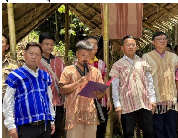
ภาพที่ 2: ชาวบ้านบ้านแม่ปอคี ร่วมกันประกาศเจตนารมณ์และสถาปนาพื้นที่คุ้มครองวิถีชีวิตกลุ่มชาติพันธุ์

การประกาศเขตพื้นที่คุ้มครองวิถีชีวิตกลุ่มชาติพันธุ์เกาะหลีเป๊ะ จังหวัดสตูล ถือเป็นอีกหนึ่งกรณีหนึ่งที่มีการดำเนินงานศึกษา สืบค้น และจัดเก็บข้อมูลอย่างต่อเนื่อง ท่ามกลางการเผชิญสถานการณ์ความท้าทายจากความขัดแย้งด้านการอ้างกรรมสิทธิ์ทับซ้อนในพื้นที่ระหว่างชุมชนกับเอกชนและหน่วยงานรัฐในพื้นที่ การจัดกิจกรรมประกาศเขตพื้นที่คุ้มครองวิถีชีวิตกลุ่มชาติพันธุ์เกาะหลีเป๊ะจึงเป็นการสร้างเงื่อนไข ที่แสดงให้เห็นความพยายามในการแสวงหาความร่วมมือที่จะแก้ไขปัญหาความขัดแย้งจากทุกภาคส่วนบนฐานการเคารพสิทธิชุมชนและสิทธิทางวัฒนธรรมของกลุ่มชาติพันธุ์ 8 และกรณีล่าสุดคือการประกาศเขตพื้นที่คุ้มครองวิถีชีวิตกลุ่มชาติพันธุ์ชาวเลอรูร์กลาโวยจูบ้านโตะบาหลิว ต.ศาลาด่าน อ.เกาะลันตา จ.กระบี่ ที่ได้ร่วมกันศึกษา สืบค้นและจัดทำข้อมูลพื้นฐานชุมชน แสดงให้เห็นข้อมูลประวัติศาสตร์ วิถีวัฒนธรรม ภูมิปัญญา และขอบเขตพื้นที่ทำกินในท้องทะเล พื้นที่อนุรักษ์ และพื้นที่จิตวิญญาณของชาวเล แสดงให้เห็นศักยภาพในการบริหารจัดการและอนุรักษ์ทรัพยากรธรรมชาติ ตลอดจนเป็นการสร้างความร่วมมือในการแก้ไขปัญหาที่อยู่อาศัยให้มีความมั่นคงถาวร ซึ่งการจัดงานครั้งนี้ได้มีการลงนามบันทึกความร่วมมือ (MOU) ระหว่างหน่วยงานในพื้นที่ 18 หน่วยงาน เพื่อร่วมกันคุ้มครองและส่งเสริมวิถีชีวิตกลุ่มชาติพันธุ์ชาวเลบ้านโตะบาหลิวต่อไป 9