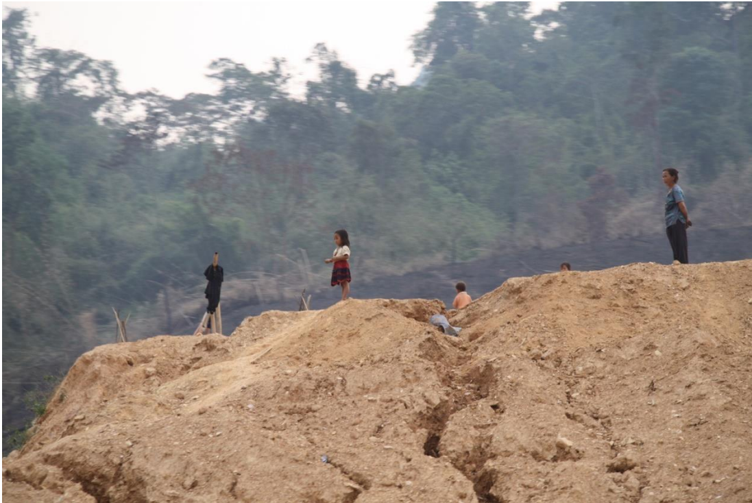
เด็กน้อยบนเนินดิน กับหญิงที่ยืนจ้องมองรถที่วิ่งไปมาบนถนนเส้นทางหลักของประเทศ