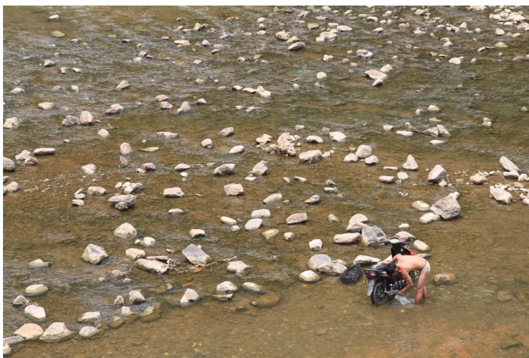
กอนหินในลำธารกว้าง กับชายยืนล้างมอเตอร์ไซค์คู่ใจ