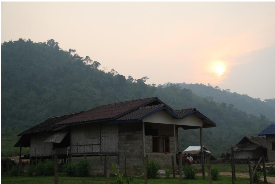
บ้านชายป่า กับสุริยาฉายแสง