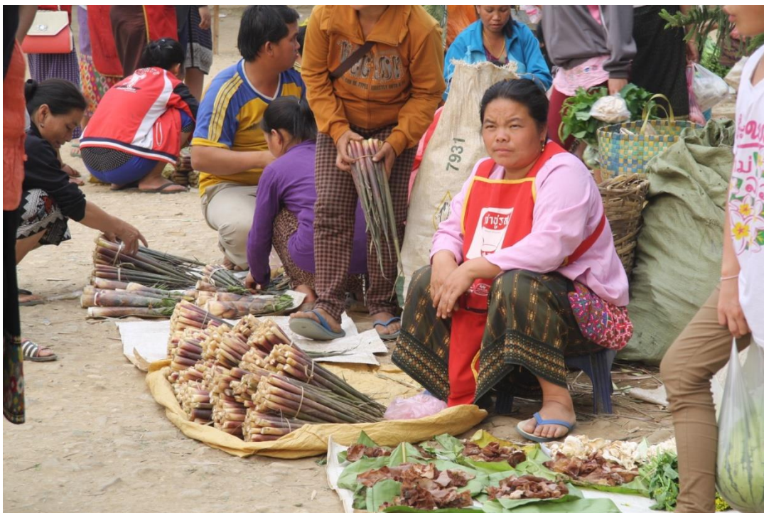
“ราชาชูรส” แม่ค้าชาวลาวนั่งแบกะดินขายหน่อไม้ ในตลาดเช้าแห่งหนึ่ง