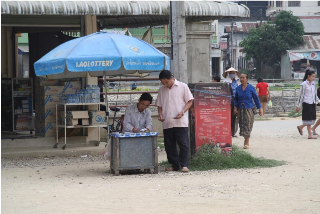
ร่มแห่งโชคชะตา (laolottery) กับ ความหวังที่เริ่มจากโต๊ะเล็ก ๆ ของผู้คนเดินดิน