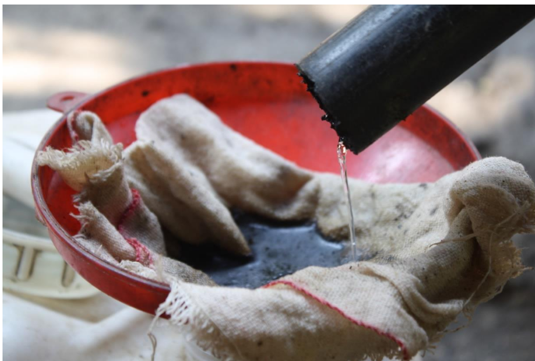
น้ำกลั่นอันบริสุทธิ์