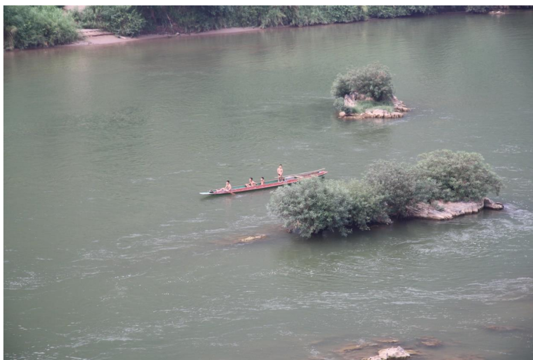
สี่เด็กน้อยแจวเรือในแม่น้ำดำ สปป.ลาว