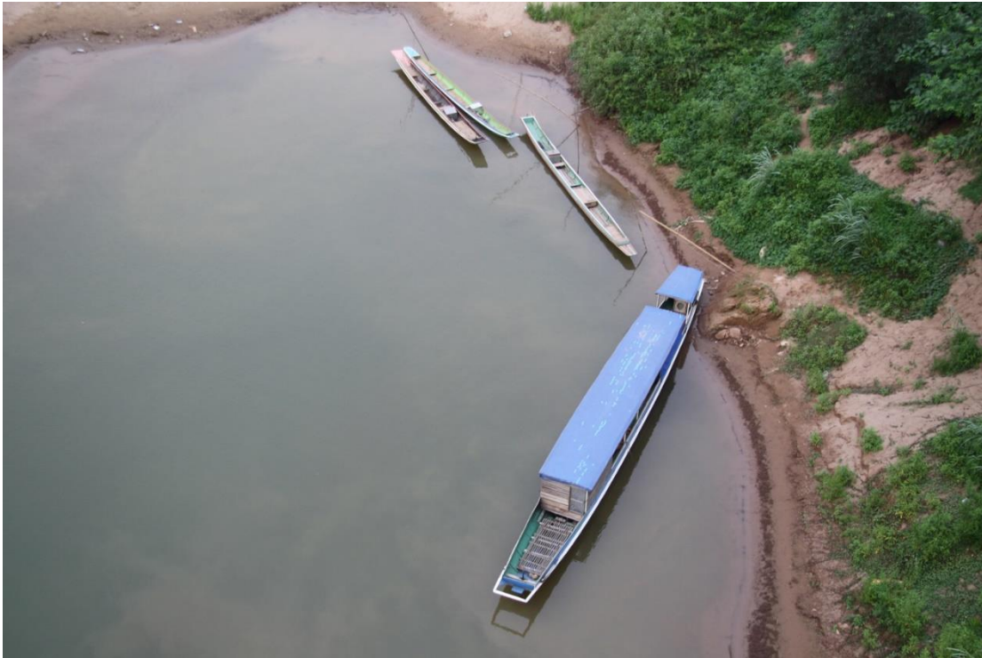
เรือจอดเทียบฝั่งเมื่อสิ้นภารกิจ เจียบสงบตั้งผืนน้ำไร้การกระเพื่อม