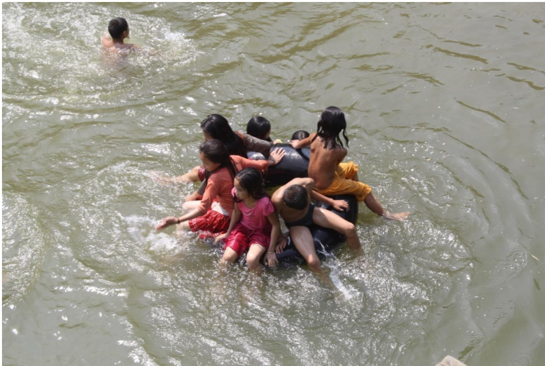
ห่วงยางสามัคคี