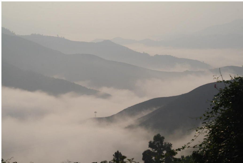
แรกลืมตาในวันใหม่ วิวห้องทำงานในยามเช้า (ภาพถ่ายขณะรถตู้วิ่งผ่านเทือกเขาในยามเช้า วินาทีแรกที่เบิกตาโพลงก็รับรู้ถึงความสดชื่น สดใส)