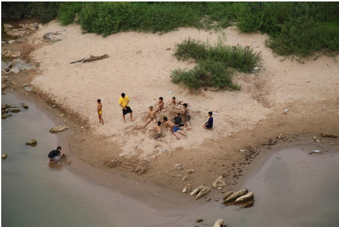
กองทรายสนทนา