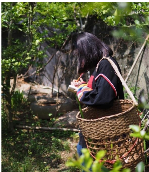
การศึกษาและจัดบันทึกชนิดพันธุ์พืชในสวนของชุมชนอ่าข่า

สำหรับ อาปี แล้ว การได้เห็นเยาวชนรุ่นเธอและรุ่นหลังละทิ้งอัตลักษณ์ทางวัฒนธรรมของตนแทบจะเป็นเรื่องปกติ เพราะเขาเหล่านั้นไม่สามารถต้านกระแสการเปลี่ยนแปลงทางสังคมที่ต้องดิ้นรนไปทำงานในเมืองหรือต่างประเทศเพื่อครอบครัว อาปีมองว่าวัฒนธรรมคือสิ่งที่เปลี่ยนแปลงได้ตลอดเวลา และหากไม่ได้รับการปฏิบัติสืบทอดแล้ว วัฒนธรรมก็สูญหายได้เช่นกัน อย่างไรก็ตาม เธอเล็งเห็นว่าวัฒนธรรมอ่าข่าเป็นทุนทางวัฒนธรรมที่สำคัญ และสามารถนำไปต่อยอดและสร้างมูลค่าเพิ่มได้ ดังนั้น อาปีจึงมักรวมตัวกับเยาวชนในหมู่บ้านเพื่อทำงานร่วมกับองค์กรภายนอกในการเสริมสร้างเศรษฐกิจชุมชนให้สอดคล้องกับบริบททางสังคมสมัยใหม่ เช่น การทำโฮมสเตย์ของหมู่บ้านผ่านการใช้แพลตฟอร์มออนไลน์ การทำผ้าปักลายอ่าข่าร่วมกับนักออกแบบชาวต่างชาติ และการนำเสนออาหารและวัตถุศิลปะของชาติพันธุ์อ่าข่า (เมล็ดพันธุ์ สมุนไพร ผักผลไม้) ผ่านการทำกิจกรรมกับร้านอาหารในเมืองและต่างประเทศ แม้อาปีต้องออกจากหมู่บ้านมาศึกษาต่อในเมืองตั้งแต่เด็ก แต่เธอก็ตั้งใจว่าจะนำเอาสิ่งที่ได้เรียนรู้จากในเมืองไปประยุกต์ใช้เพื่อรักษาความหลากหลายของวัฒนธรรมอ่าข่า และส่งเสริมอัตลักษณ์อ่าข่าให้เป็นที่รู้จักต่อไป