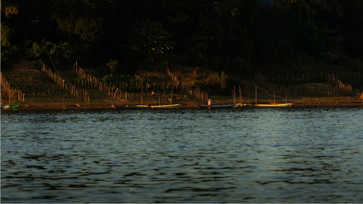
ภาพที่ 10 ชาวบ้านริมโขงบริเวณเมืองหลวงพระบาง กำลังดูแลผักที่ปลูกไว้ริมแม่น้ำ