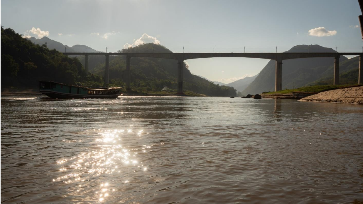
ภาพที่ 8 สะพานรถไฟความเร็วสูงพาดผ่านน้ำโขง เมื่อใกล้ถึงหลวงพระบาง