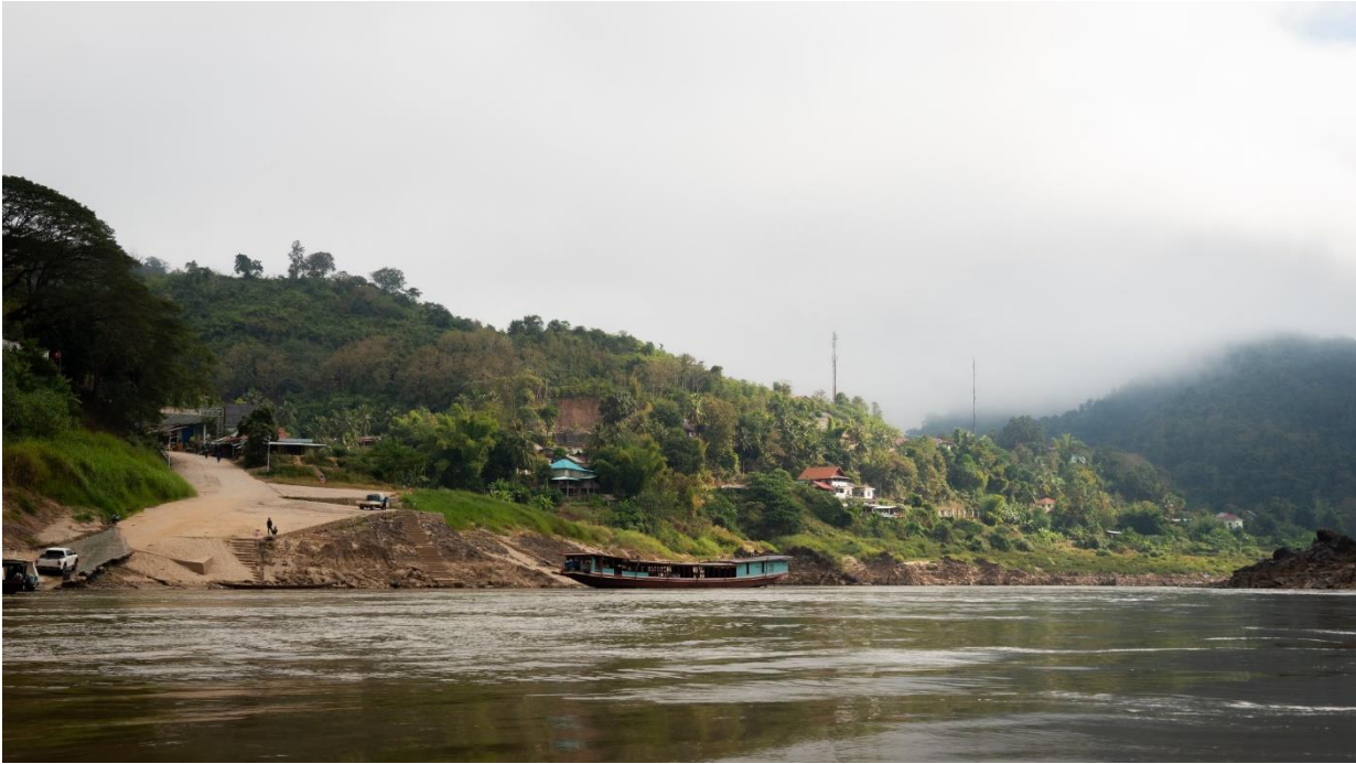
ภาพที่ 4 บรรยากาศเมืองปากแฉกยามเช้ากับน้ำโขงที่ไหลอย่างสงบตามวิถี