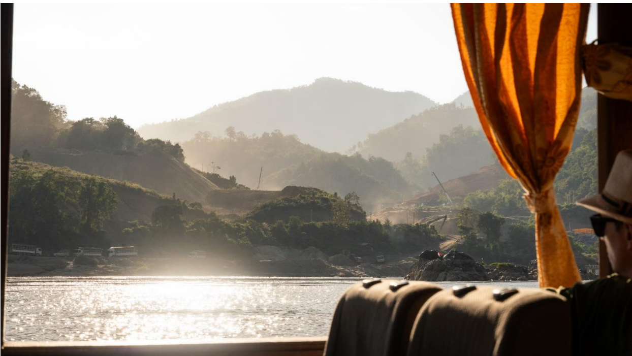
ภาพที่ 7 วิวสองข้างทางของการนั่งเรือเข้าเป็นกิจกรรมการสร้างเขื่อน ไม่แน่ว่าเมื่อสร้างเขื่อนเสร็จ เรือเข้าจากเมืองห้วยทรายไปหลวงพระบางยังสามารถสัญจรได้อีกไหม