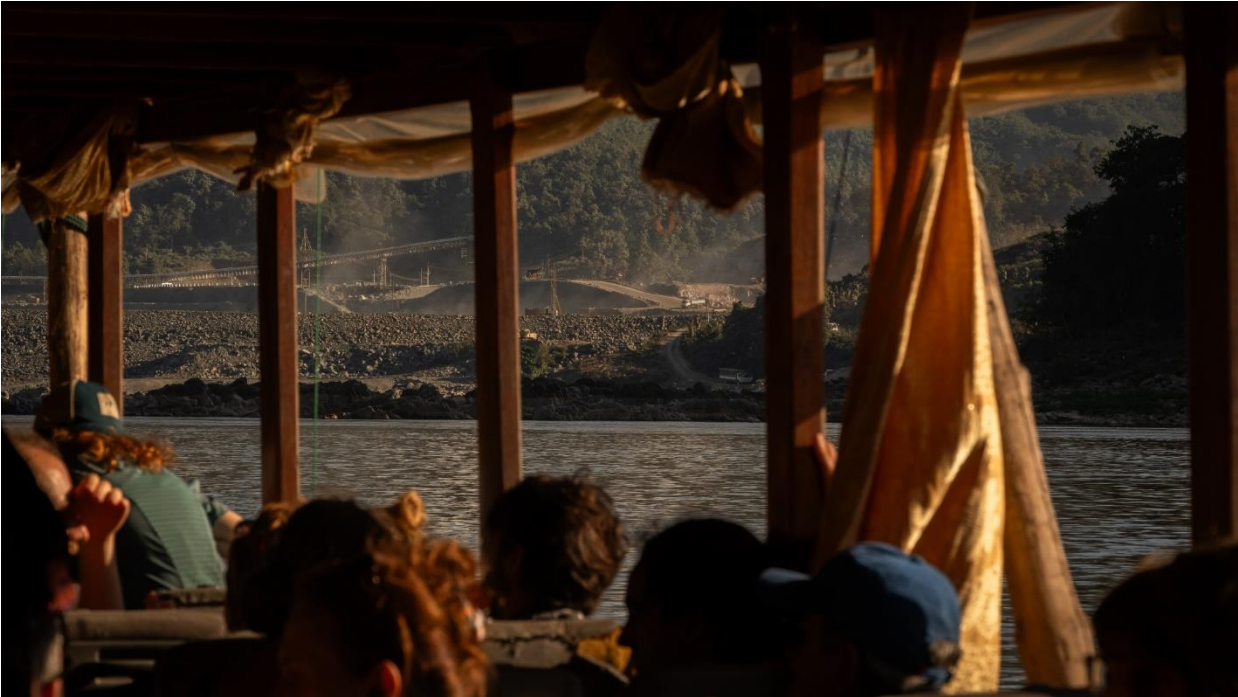
ภาพที่ 6 นั่งเรือเข้าไปหลวงพระบาง คืออีกหนึ่งเส้นทางของการเดินทางเข้าสู่เมืองหลวงพระบางของประเทศลาว โดยการเดินทางใช้เวลา 1 คืน 2 วัน นักเดินทางส่วนมากจะเป็นชาวต่างชาติและชาวบ้านริมโขงที่ต้องการสัญจรจากหมู่บ้านหนึ่งไปอีกหนึ่งหมู่บ้าน