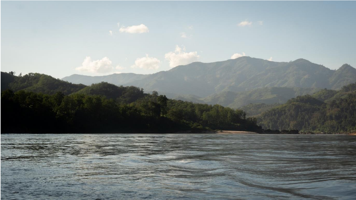
ภาพที่ 2 ภูเขา หาดทราย โขดหิน ความอุดมสมบูรณ์ของระบบนิเวศริมน้ำโขงบริเวณเมืองปาก แบง