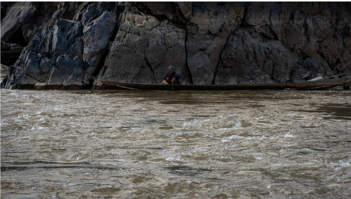
ภาพที่ 3 ชาวบ้านริมฝั่งโขงกำลังหาปลาบริเวณน้ำไหลเชี่ยว