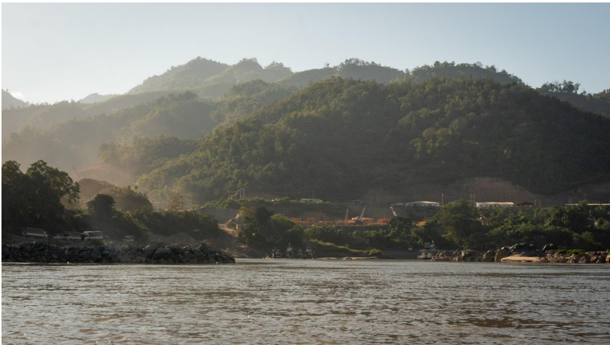
ภาพที่ 5 เขื่อนปากแฉกกำลังก่อสร้าง ซึ่งห่างจากท่าเรือและหมู่บ้านปากแฉกประมาณ 9 กม.