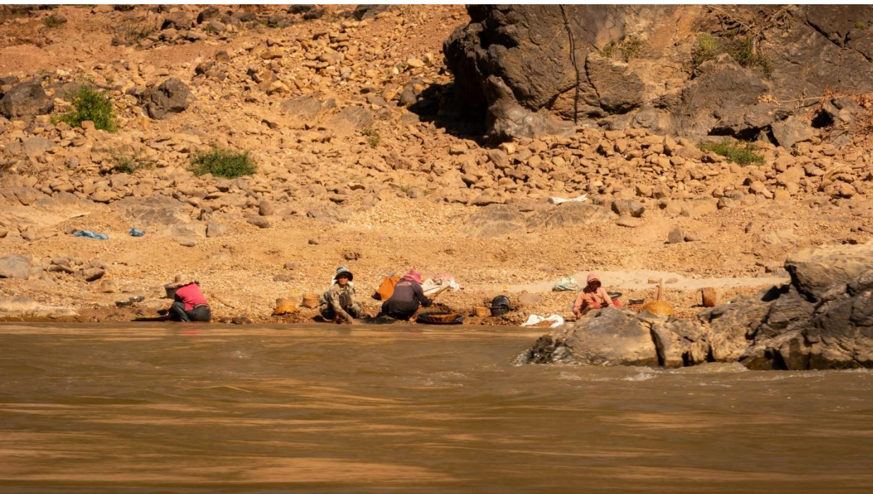
ภาพที่ 9 ชาวบ้านริมโขงกำลังร่อนหาทองตามวิถีเดิม