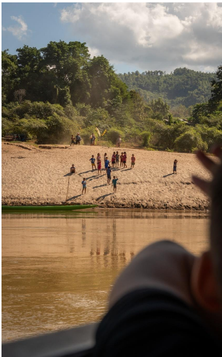
ภาพที่ 11 อ่ำลาสายน้ำและผู้คนริมโขง สายน้ำโดนหันอีกครั้ง ผู้คนยังคงดำเนินชีวิตตราบที่อยู่ วิถีของสิ่งมีชีวิตและสายน้ำจะเปลี่ยนไปตลอดกาล