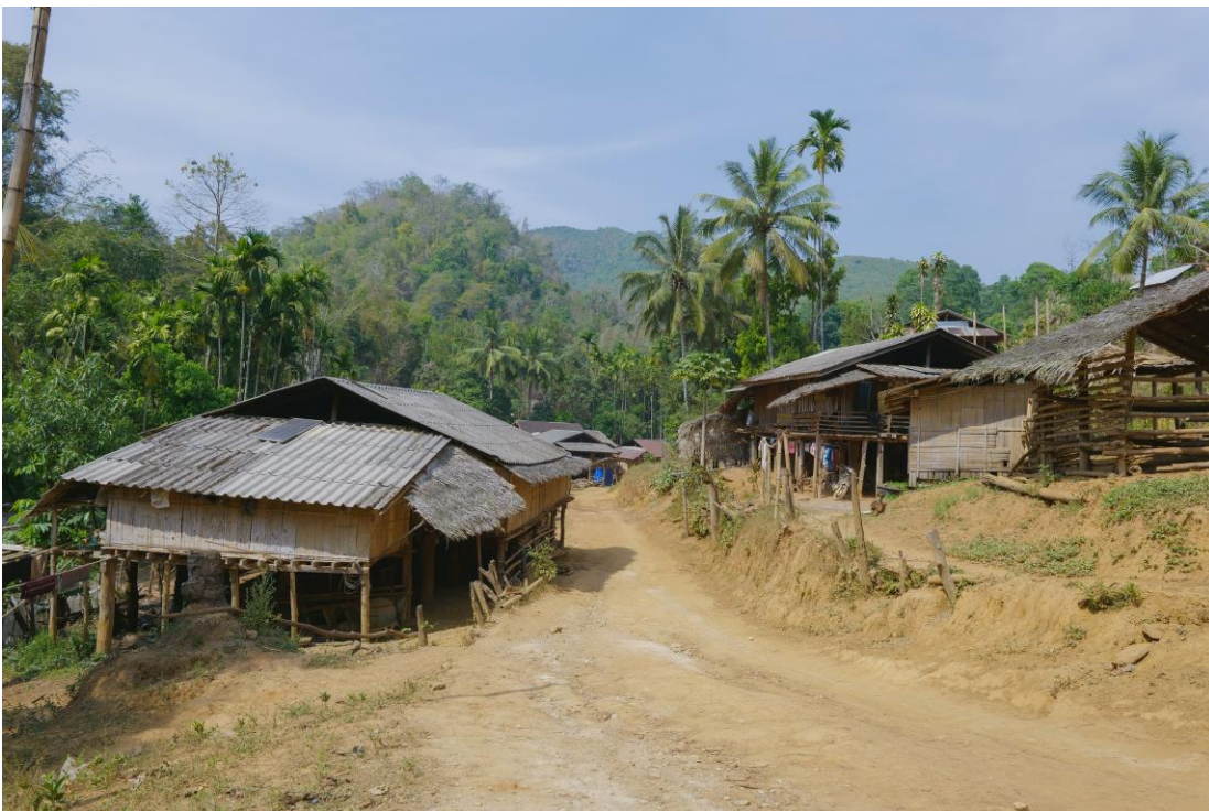
13. แม่ปอศิยามสาย ของเดือนมีนาคม ที่นี่สงบและร่วมเย็น ได้ยินเสียงของชะนี นก ลัตรีป่า ร้อง ประหนึ่งวงออเคสตรากลางผืนป่าใหญ่