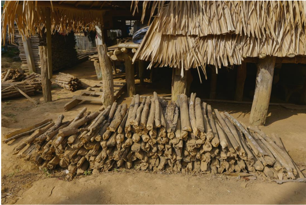
12. ฟืนจากไร่หมุนเวียนถูกนำมาเก็บไว้ใต้ถุนบ้าน สำหรับเชื้อเพลิงในการก่อไฟหุงข้าวในครัวเรือน และต้องเตรียมให้พอก่อนฤดูฝนจะมาถึง