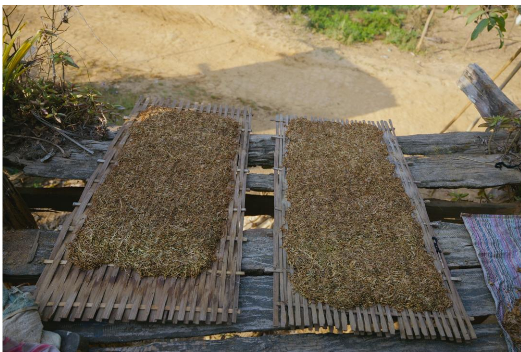
08. บนหลังคาหรือลานกว้างหน้าบ้าน ถูกเปลี่ยนเป็นที่ตากยาสูบ ซึ่งชาวบ้านปลูกเอง