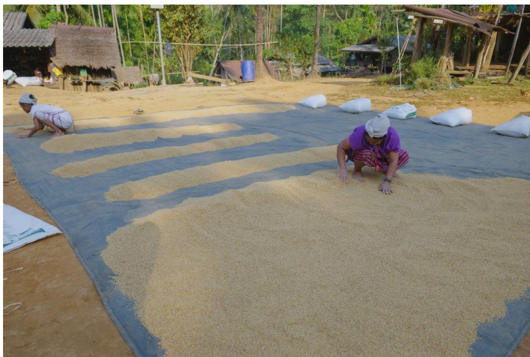
04. ลานกลางหมู่บ้าน เปลี่ยนเป็นลานตากข้าวชั่วคราวเพื่อลดความชื้นในข้าว ป้องกันการบูดเสีย