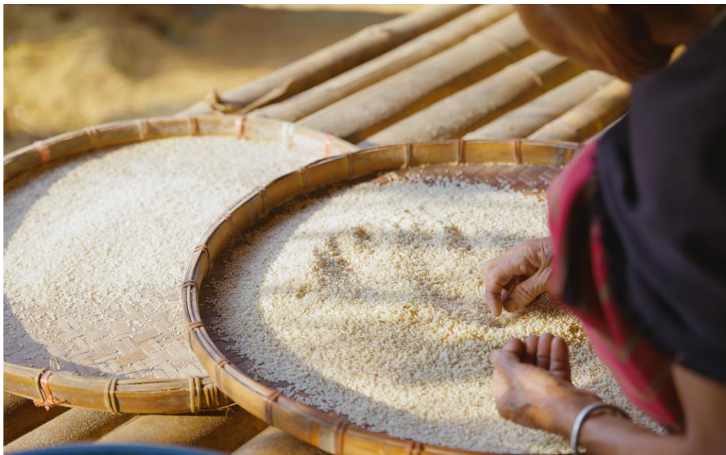
07. คัดแยกข้าวเปลือกออกจากข้าวสารอีกที ต้องใช้สมาธิในการเก็บ วิธีการนี้เป็นการฝึกสมาธิของคนชราได้เป็นอย่างดี