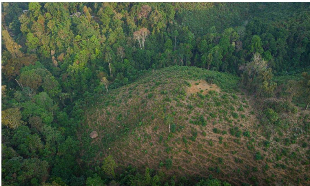
03. แหล่งความมั่นคงทางอาหาร ข้าวไร่หมุนเวียนเก็บเกี่ยวเสร็จสิ้นในเดือนพฤศจิกายน 2566