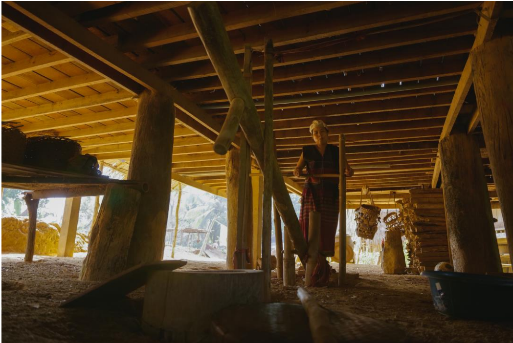
05. มีกำ หรือ ป่า ลุกขึ้นมาตำข้าวด้วย “กลี” หรือครกกระเดื่องที่ต้องอาศัยกำลังขาเป็นสำคัญ เพราะที่นี่ไม่มีไฟฟ้า ไม่มีเครื่องจักรหรือเครื่องสีข้าว