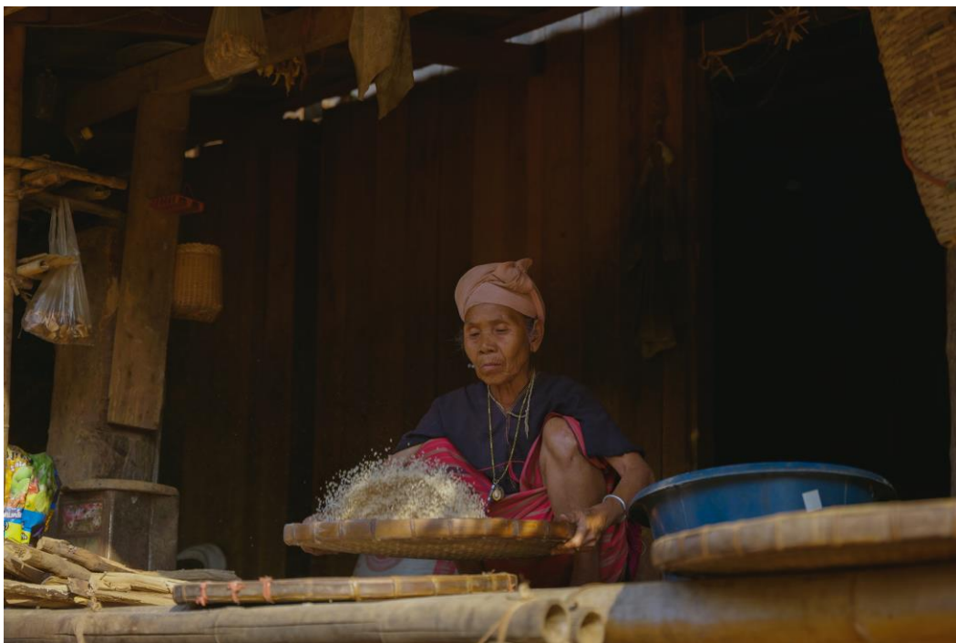
06. พี่พี หรือ ยาย กำลังฟัดข้าวเพื่อแยกข้าวออกจากข้าวเปลือก ทักษะนี้ต้องอาศัยการฝึกฝนให้เชี่ยวชาญ สำหรับมือใหม่ข้าวอาจจะหกออกจากกระด้งขณะฟัดข้าวก็เป็นได้