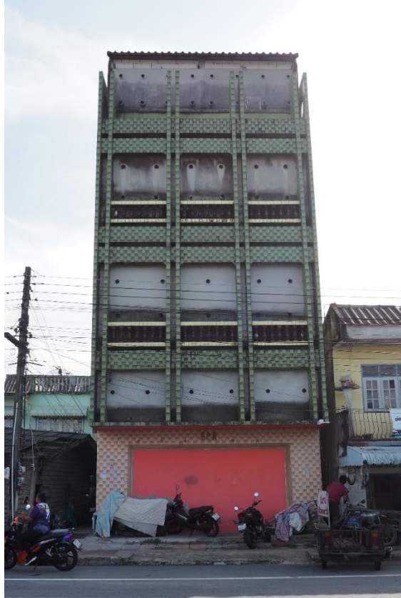
ภาพที่ 3 ตึกแถวที่ถูกตัดแปลงให้เป็นคอนโดนิกแอนด์ในอำเภอปากพ่อง (3 มิถุนายน 2567)