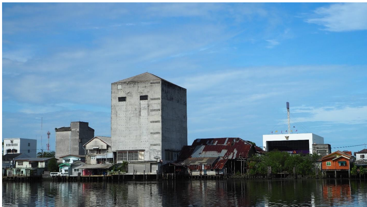
ภาพที่ 2 คอนโดนกแอ่นริมแม่น้ำในอำเภอปากพนัง ภาพ: รณพล เลิศเกียรติดำรงค์ (3 มิถุนายน 2567)

ประชากรนกแอ่นลดลง ในขณะเดียวกัน พื้นที่นอกสัมปทานก็ทยอยปรากฏการปรับตัวของนกแอ่นเพื่ออาศัยอยู่ในระบบนิเวศแห่งใหม่อย่างเช่นย่านเมืองท่าริมชายฝั่งทะเลเช่นที่ปากพนัง นครศรีธรรมราช จนนำไปสู่การคิดค้นหาวิธีการหาผลประโยชน์จากรังนกนอกเขตสัมปทานอย่าง การทำบ้านนกแอ่นด้วยการปรับเปลี่ยนอาคารเก่าและการสร้างสิ่งปลูกสร้างใหม่เพื่อนกแอ่นโดยเฉพาะที่คนท้องถิ่นปากพนังเรียกติดปากว่า “คอนโดนกแอ่น”