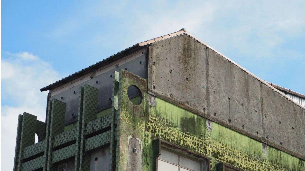
ภาพที่ 4 การเปลี่ยนแปลงระบบนิเวศแบบถ้ำด้วยการใช้วัสดุเปลือยไร้กลี้นสารเคมี ความชื้น-ทึบ มีอากาศถ่ายเทน้อย เป็นตัวแปรสำคัญที่มักจะเลือกพื้นที่สำหรับทำรัง ภาพ: ธนพล เลิศเกียรติดำรงค์ (3 มิถุนายน 2567)

อย่างไรก็ตาม แม้จะกล่าวว่าการสร้างคอนโดนกแอ่นเป็นการออกแบบหลากหลายพันธุ์ แต่คอนโดนกแอ่นมีลักษณะแบบเอาสายพันธุ์ใดสายพันธุ์หนึ่งเป็นศูนย์กลาง คอนโดนกแอ่นออกแบบโดยมุ่งเน้นนกแอ่นเป็นศูนย์กลาง (swiftlet-centric) โดยมีมนุษย์ผู้ได้รับประโยชน์จากการเก็บรังนกเป็นผู้ได้ประโยชน์รองลงมา การออกแบบหลากหลายพันธุ์กรณีของคอนโดนกแอ่น จึงเบียดขับสายพันธุ์อื่นที่ไม่ใช่ชนกแอ่นและมนุษย์ให้ออกไปจากพื้นที่คอนโดนกแอ่น และสร้างปัญหาให้กับระบบนิเวศและสิ่งแวดล้อมเมืองในภาพรวมด้วย