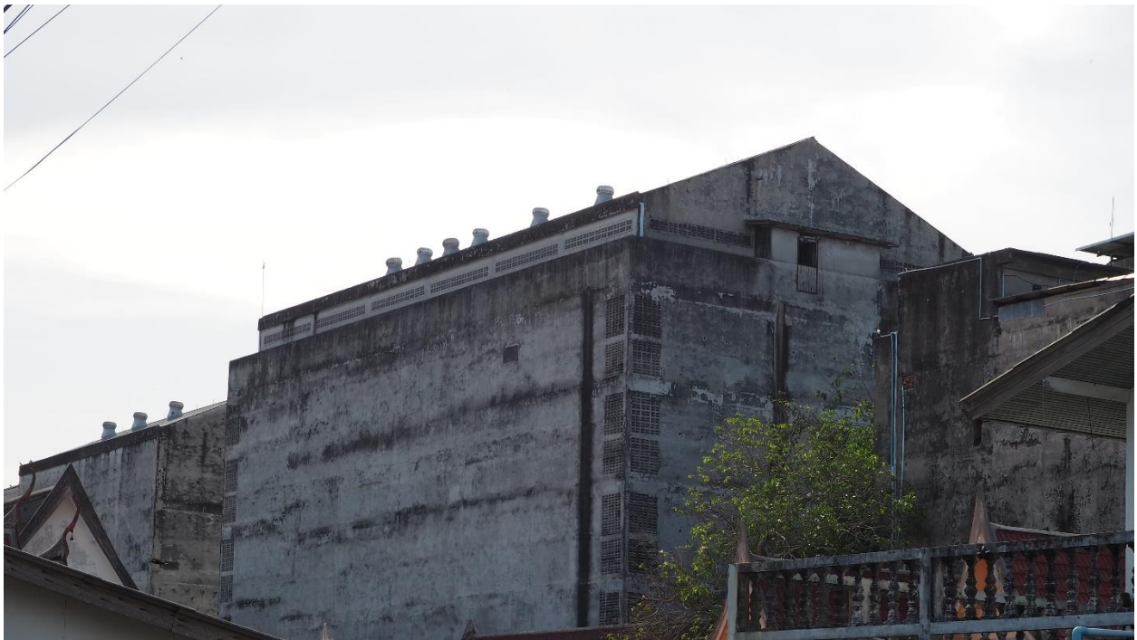
ภาพที่ 1 คอนโดนกแอ่นในอำเภอปากพนัง จังหวัดนครศรีธรรมราช (3 มิถุนายน 2567)

ท่ามกลางปัญหาระหว่างคนกับสัตว์ป่า มีบางกรณีพบว่าคนก็ได้ประโยชน์จากการมีอยู่ของสัตว์เหล่านี้ ดังเช่น ลิงแสมที่กลายมาเป็นหมุดหมายของการท่องเที่ยวของเขาสามนุกและเมืองลพบุรี แม้จะมีปัญหาแต่ในขณะเดียวกันก็ได้สร้างผลประโยชน์มหาศาลกับคนในสังคมบางกลุ่ม สำหรับในบทความนี้ผู้เขียนขอพูดถึงกรณีของ นกแอ่นกินรัง ที่มนุษย์ได้อานิสงค์จากการขายและบริโภครังนกในฐานะสินค้าราคาแพง จนคนบางกลุ่มเริ่มสร้างบ้านให้นกแอ่นเข้ามาอยู่มากขึ้นจนกลายเป็นปัญหาสิ่งแวดล้อมเมืองที่กำลังทวีความรุนแรงและเริ่มขยายตัวไปทั่วประเทศในปัจจุบัน