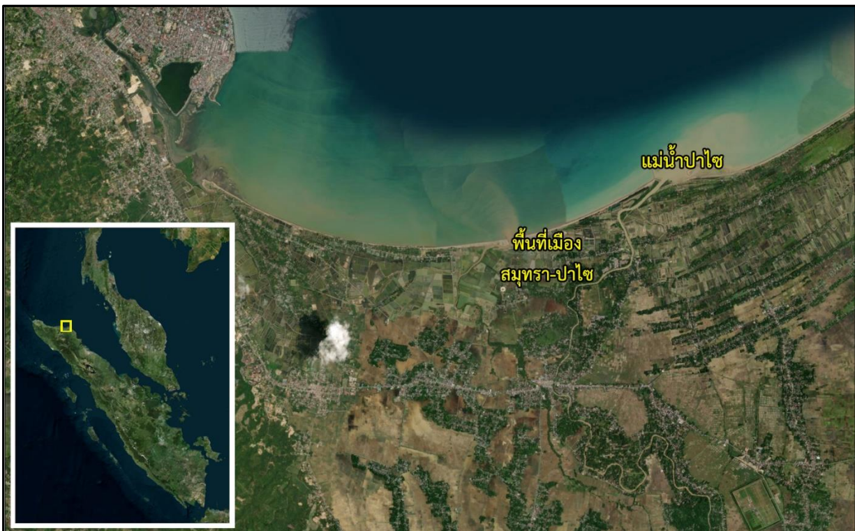
ภาพที่ 1 แผนที่แสดงที่ตั้งเมืองสมุทร-ปาไซในเอเชียอาคเนย์ ใกล้แม่น้ำสำคัญคือ แม่น้ำปาไซ

“ปาไซ” (Pasai) คือเมืองท่าสำคัญของชาวเกาะสุมาตราตอนเหนือ ตั้งอยู่บนพื้นที่ที่สัมพันธ์กับปากแม่น้ำปาไซ (Kuala Pasai) หรือ ตามภาษาอาจะฮ์ว่า “กรวงปาเซ” (Krueng Pase) ซึ่งอยู่บนชายฝั่งตอนบนด้านตะวันออกเฉียงเหนือของเกาะสุมาตรา ในทางประวัติศาสตร์นั้น ช่วงครึ่งหลังของศตวรรษที่ 13-ต้นศตวรรษที่ 15 เมืองนี้มีความสำคัญทางเศรษฐกิจและการเมืองอย่างมากในบริเวณน่านสมุทรฝั่งใต้ของปากทางเข้าช่องแคบมะละกา ตามตำนานนั้นกล่าวว่า แรกเริ่มตั้งเมืองนั้น เมืองแรกชื่อว่าเมืองสมุทร (Samudera; ตามสำเนียงมลายูว่า ชะมุเดอร่า ) ต่อมาจึงสร้างอีกเมืองชื่อ “ปาไซ” (Pasai) โดยไม่ระบุว่าอยู่บริเวณใด แต่ควรเป็นชุมชนที่อยู่ใกล้กัน ต่อมา ชื่อสมุทรนี้ได้กลายมาเป็นชื่อเรียกเกาะสุมาตรา (Sumatra) ในปัจจุบัน ความสำคัญอีกประการหนึ่งคือ ทั้งสองเป็นเมืองรุ่นแรกของ “ราชา” ที่หันมานับถือศาสนาอิสลาม ดังนั้น ในทางวิชาการจึงมักเรียกชื่อรัฐนี้เป็นชื่อคู่กันว่า “รัฐสุลต่านสมุทร-ปาไซ” (Samudera-Pasai Sultanate) (ภาพที่ 1) ที่ผ่านมามีริซาและคณะ (Mirsa et al. 2021) ได้วิเคราะห์ตำแหน่งที่ตั้งของสถานที่ต่างๆ ในเขตเมืองไว้อย่างน่าสนใจ (ภาพที่ 2)