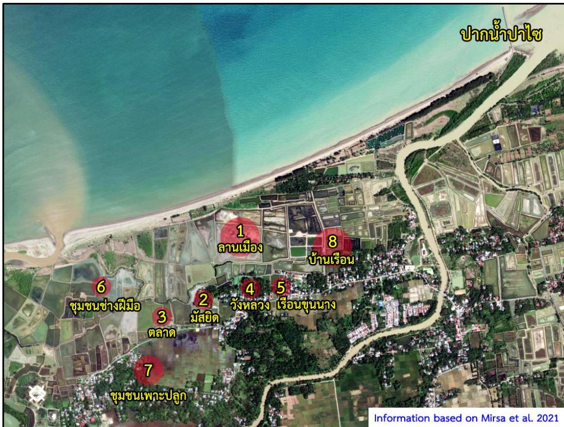
ภาพที่ 2 ตำแหน่งสถานที่ต่างๆ ในเขตเมืองสมุทร-ปาไซ ตามการศึกษาของมีร์ซาและคณะ (Mirsa et al. 2021); ปรับปรุงจากภาพลายเส้น "ภาพที่ 18 รูปแบบการใช้พื้นที่ของรัฐสุลต่านสมุทร-ปาไซ" (Mirsa et al. 2021: 101); (1) ลานเมือง (square), (2) มัสยิด (masjid), (3) ตลาด (market), (4) วังหลวง (palace), (5) เรือนขุนนาง (House of officials), (6) ชุมชนช่างฝีมือ (Society of craftsmen), (7) ชุมชนเพาะปลูก (Farming community), (8) บ้านเรือน (Settlement); จัดทำภาพโดย ตรงใจ (ผู้เขียน).

เอกสารสำคัญที่ให้ข้อมูลเกี่ยวกับตำนานกำเนิดราชวงศ์แห่งสมุทร-ปาไซคือ “ตำนานเหล่าราชันย์แห่งปาไซ” หรือที่เรียกกันตามภาษามลายูว่า “ฮิกายัต ราชา-ราชา ปาไซ” (Hikayat Raja-Raja Pasai) ซึ่งเล่าเรื่องราวตั้งแต่ต้นกำเนิดราชวงศ์ก่อนสมัยอิสลาม อันเกิดจากการเสกสมรสกันระหว่างเจ้าชายข้างसार (หรือ เมอระฮ์กาจะฮ์) กับเจ้าหญิงไมไฟ (หรือ ปุตรีเบอตง) และให้กำเนิดราชบุตรนามว่า “เมอระฮ์ซีลู”