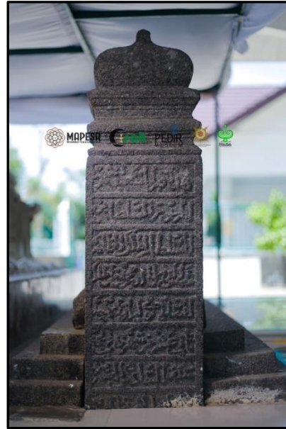
ภาพที่ 4 หินปักหลุมศพของสุลต่านนิรนาม