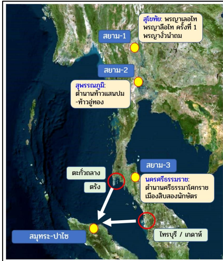
ภาพที่ 5 แผนที่แสดงตำแหน่ง “กลุ่มสยาม” ที่อยู่ในบริบทความเป็นไปได้ในปาไซ-สยามยุทธ์ หากเกิดศึกในช่วง ค.ศ. 1299-1310 (พ.ศ. 1842-1853)

ศตวรรษที่ 19 โดยปรากฏเงื่อนไขของการสถาปนาอำนาจและเริ่มขยายออกไป ตามที่ปรากฏเป็น ข้อมูลเรื่องเมืองสิบสองนักษัตร