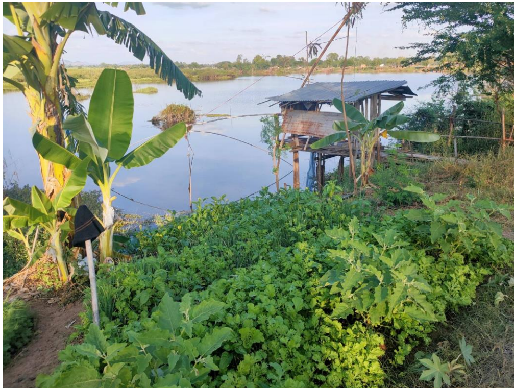
ภาพที่ 2 แปลงปลูกผักริมหนองสมอของชาวบ้านที่ประกอบอาชีพทำประมงยกยอในหนองสมอ

ส่วนในด้านเกษตรกรรม การขุดลอกหนองสมอให้ลึกเพื่อกักเก็บน้ำไว้ทำประมงและใช้ทำนาช่วงหน้าแล้ง การขุดเอาตะกอนดินที่มีแร่ธาตุอุดมสมบูรณ์ที่เคยอยู่ใต้ผิวน้ำขึ้นมาไว้ริมหนองสมอของเทศบาล ทำให้ผู้ที่ประกอบอาชีพประมงหนองสมอบางส่วนเริ่มปลูกผักแปลงเล็ก ๆ ไว้ริมหนองสมอเนื่องจากดินมีความอุดมสมบูรณ์ ภาพแปลงเกษตรริมหนองสมอถูกนำมาใช้ในการสื่อสารภาพวิถีชีวิตอันสวยงามสอดคล้องไปกับการท่องเที่ยวหนองสมอ