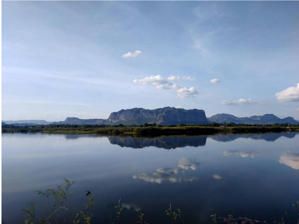
ภาพที่ 1 เงามของภูเขาและท้องฟ้าที่สะท้อนเหนือผิวน้ำบริเวณจุดชมวิวนองสมอ อำเภอภูผาม่าน จังหวัดขอนแก่น ที่มา: ธนพล เลิศเกียรติดำรงค์ ถ่ายเมื่อ: 14 ธันวาคม 2566

ที่ตำบลโนนคอม อำเภอภูผาม่าน จังหวัดขอนแก่น มีแหล่งน้ำแห่งหนึ่งที่คนปัจจุบันเรียกกันว่าหนองสมอ เป็นแหล่งท่องเที่ยวและจุดถ่ายรูปเชิคอินที่สำคัญของอำเภอภูผาม่าน จากภูมิทัศน์ที่สวยงามที่บึงน้ำนิ่งเรียบสะท้อนเงาของท้องฟ้าและภูเขาหินปูนเป็นฉากหลัง ปัจจุบันหนองสมอ กำลังกลายเป็นอ่างเก็บน้ำไว้รองรับการทำนาและการท่องเที่ยว อย่างไรก็ตามอดีตก่อนที่หนองสมอ จะกลายเป็นสถานที่ท่องเที่ยว พื้นที่แห่งนี้เคยเป็นทาม ระบบนิเวศที่มีความสำคัญต่อการใช้ชีวิตของคนหลายชุมชนที่อาศัยอยู่รอบหนองสมอมาก่อน แต่การเปลี่ยนแปลงของหนองสมอเกิดขึ้นจากการเปลี่ยนแปลงการใช้ที่ดิน (Land transformation) และทรัพยากรที่เกี่ยวข้องเชื่อมโยงกับความสัมพันธ์กับวิถีชีวิตของคนในอำเภอภูผาม่าน บทความนี้จึงจะชวนผู้อ่านย้อนกลับไปดูประวัติศาสตร์ความสัมพันธ์ของหนองสมอกับวิถีชีวิตชาวไทภู ตั้งแต่ยุคสมัยแห่งป่าทาม จนถึงยุคแห่งการท่องเที่ยวในปัจจุบันที่การเปลี่ยนแปลงรูปแบบปฏิสัมพันธ์ระหว่างคนกับทามหนองสมอ เกิดขึ้นจากการเปลี่ยนแปลงทางสังคมของชุมชนรอบหนองสมอในแต่ละช่วงเวลา