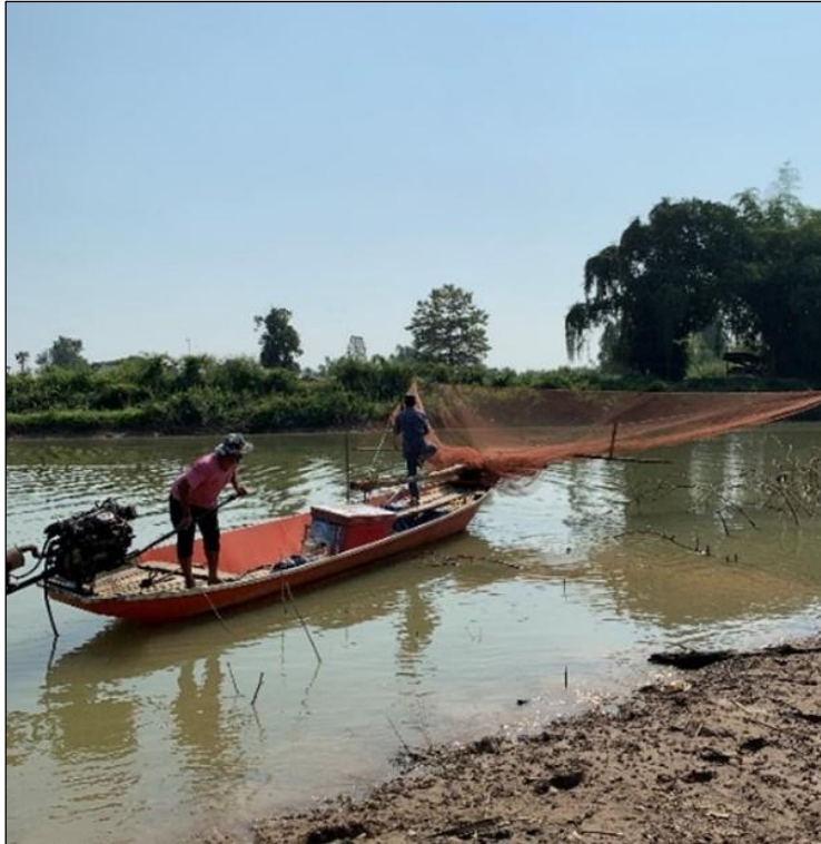
ภาพที่ 2 เรือช้อนสนั่นแห่งชุมชนบ้านกงในปัจจุบัน