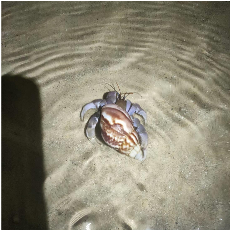
ภาพที่ 1 ปูเสฉวนที่พบบริเวณตอนใต้หาดบางเทากับเปลือกหอยทากยักษ์แอฟริกา

ช่วงต้นเดือนมีนาคม ผู้เขียนเดินทางไปตามติดตามการทำงานของชุมชนแห่งหนึ่งในแถบบางเทา จังหวัดภูเก็ต เมื่อมีเวลาว่างช่วงกลางวัน ผู้เขียนได้รับการเชิญชวนจากเพื่อน ๆ และอาจารย์ในโครงการวิจัยไปเดินริมทะเลช่วงบริเวณปลายหาดบางเทา ระหว่างที่เดินเล่นอยู่นี้เอง ผู้เขียนและคนอื่น ๆ พบปูเสฉวนออกมาเดินอยู่บนหาดทรายริมทะเลเยอะในระดับหนึ่ง (ไม่ถึงกับหนาแน่น) ปูเสฉวนเป็นหนึ่งในสิ่งมีชีวิตทั่วไปที่ใช้ชีวิตอยู่ริมชายหาดและมีโอกาสพบได้หลายแห่งในประเทศไทยและมีข่าวพุดถึงในแวดวงอนุรักษ์อยู่เป็นระยะจากการลดลงของเปลือกหอยและถิ่นที่อยู่อาศัย ตลอดจนภาพปูเสฉวนหันไปพึ่งพาวัวสดอื่นนอกเหนือจากเปลือกหอย แม้ปูเสฉวนที่พบที่หาดบางเทาจะยังใช้เปลือกหอยอยู่แต่สิ่งที่สะดุดตาผู้เขียน คือ เปลือกหอยที่ปูเสฉวนเหล่านี้แบกอยู่นั้นไม่ใช่เปลือกหอยทะเล แต่เป็นเปลือกหอยทากที่อาศัยบนบกและหอยที่อาศัยอยู่ในน้ำจืดซึ่งทั้งสองเป็นสายพันธุ์ต่างถิ่น บทความนี้จึงชวนผู้อ่านไปสำรวจความเป็นเมืองของเกาะภูเก็ตที่ส่งผลกระทบต่อ การเปลี่ยนไปใช้เปลือกหอยต่างถิ่นของปูเสฉวนเหล่านี้