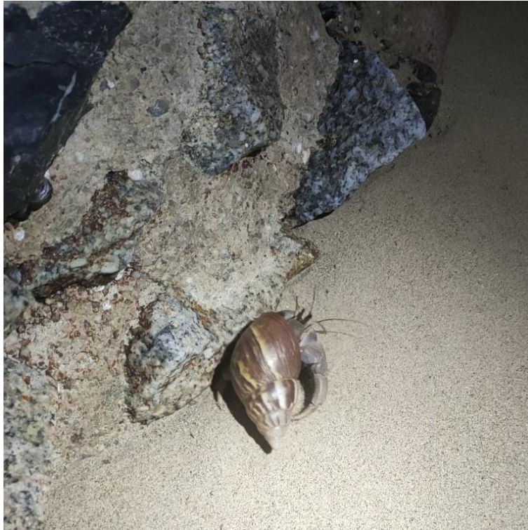
ภาพที่ 2 ปูเสฉวนที่พบบริเวณแนวกำแพงปูนของโรงแรมแห่งหนึ่งริมหาดบางเท บริเวณชอกหินในกำแพงยังพบปูเสฉวนขนาดเล็กอีกจำนวนมากด้วย ถ่ายเมื่อ 2 มีนาคม 2567

ประชิดชายหาดนำพาหอยทากต่างถิ่นมาสู่ริมทะเลที่ปูเสฉวนซึ่งเป็นสัตว์พื้นถิ่นเองก็มีการปรับตัวให้เข้ากับสังคมมนุษย์และใช้ประโยชน์จากเปลือกหอยทากในช่วงเวลาที่พื้นที่ริมชายหาดของหาดบางเทากลายเป็นโรงแรม ร้านอาหารและสถานที่ท่องเที่ยวไปแล้ว