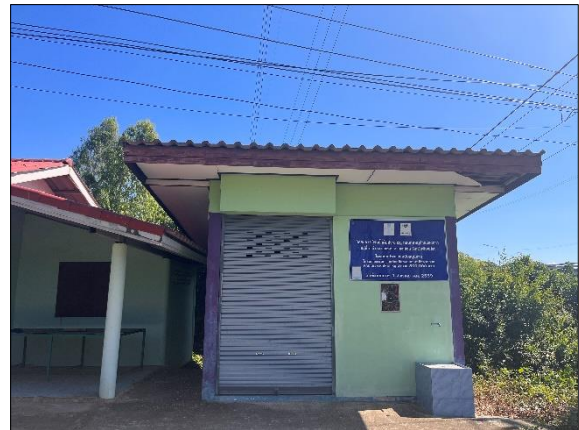
ภาพที่ 4 ศูนย์ข้าวชุมชนบ้านท่าตะเคียนและศูนย์จัดการศัตรูพืชชุมชนบ้านท่าตะเคียนจัดตั้งต้นทศวรรษ 2540 ภาพที่ 5 โรงน้ำดื่มประชารัฐ กองทุนหมู่บ้านแสงดาว จัดตั้ง พ.ศ.2559