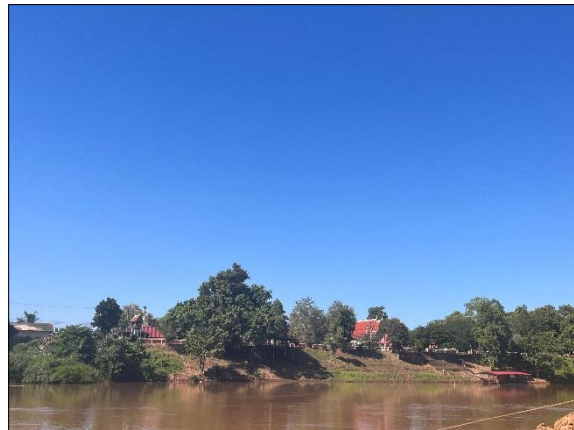
ภาพที่ 2 วัดแสงดาว แห่งชุมชนบ้านแสงดาวตะวันออก