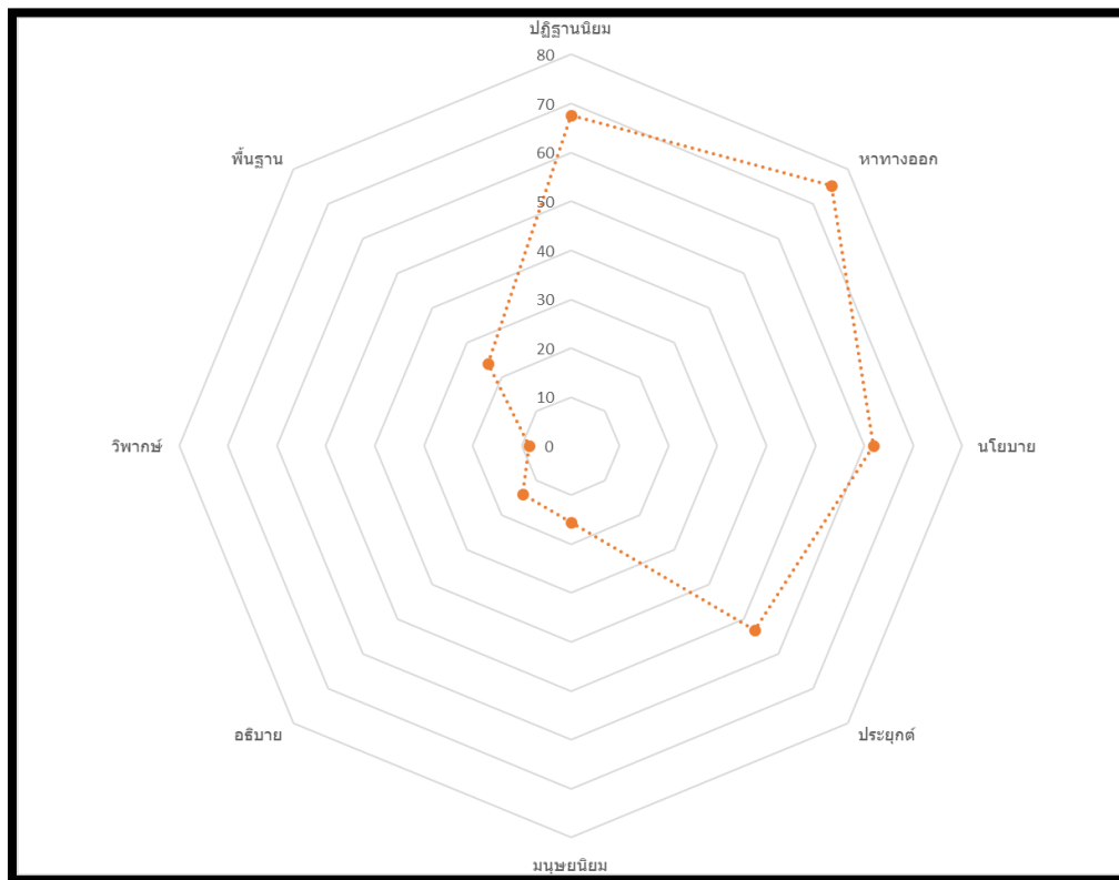
แผนภาพแสดงการกระจายตัวโดยร้อยละของการสร้างความรู้ตามตัวแบบ 4 คู่แกน 8 ตัวแปรจากฐานข้อมูลงานวิจัย วช. และ สกว. พ.ศ 2553 - 2562