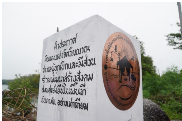
ภาพที่ 6 หลักหมุดสัญลักษณ์การประกาศพื้นที่คุ้มครองวิถีชีวิตกลุ่มชาติพันธุ์บ้านหินลูกเดียว ที่มาภาพ: ผู้เขียน 26 พฤศจิกายน 2566

การขับเคลื่อนพื้นที่คุ้มครองวิถีชีวิตกลุ่มชาติพันธุ์ยังเป็นอีกหนึ่งแนวนโยบายที่มีการดำเนินงานอย่างต่อเนื่อง ภายใต้การดำเนินงานของศูนย์มานุษยวิทยาสิรินธร และเครือข่ายองค์กรภาคี โดยในปี 2566 ได้ปรากฏการนำแนวคิดพื้นที่วิถีชีวิตกลุ่มชาติพันธุ์ไปใช้ในการกำหนดแนวทางการแก้ไขปัญหาและพัฒนาชุมชนชาติพันธุ์ 2 พื้นที่ ได้แก่ การจัดงานประกาศพื้นที่