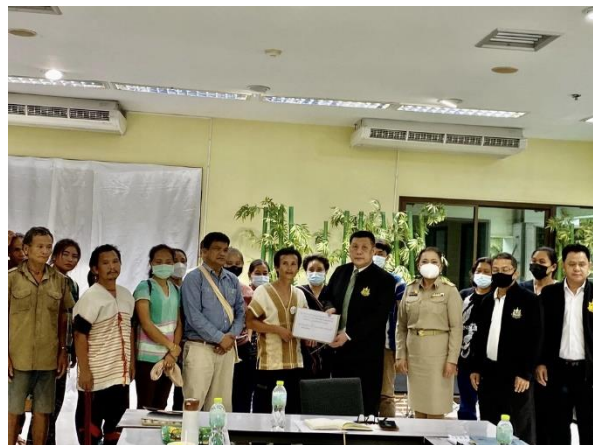
ภาพที่ 15 ชาวกะเหรี่ยงบ้านบางกลอยยื่นหนังสือทวงถามความคืบหน้าการดำเนินงานตามข้อเสนอของคณะกรรมการอิสระฯ

ทั้งนี้ภายหลังจากจัดตั้งรัฐบาลใหม่ ในช่วงเดือนกันยายน 2566 ชาวกะเหรี่ยงบ้านบางกลอยได้มีการติดตามทวงถามความคืบหน้าการดำเนินงานตามข้อเสนอของคณะกรรมการฯ โดยได้เข้ายื่นหนังสือถึง พล.ต.อ.พัชรวาท วงษ์สุวรรณ รมต.ว่าการกระทรวงทรัพยากรธรรมชาติและสิ่งแวดล้อม ณ กระทรวงทรัพยากรธรรมชาติและสิ่งแวดล้อม (ทส.) เพื่อเรียกร้องให้สานต่อแนวทางการแก้ไขปัญหาชุมชนกะเหรี่ยงบ้านบางกลอย ตามมติของคณะกรรมการอิสระเพื่อตรวจสอบข้อเท็จจริงและแก้ไข