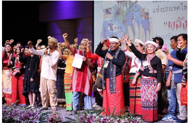
ภาพที่ 10 การจัดงานรณรงค์และเฉลิมฉลองเนื่องในวันสากลชนเผ่าพื้นเมืองโลกและวันชนเผ่าพื้นเมืองแห่งประเทศไทย ประจำปี 2566 ณ ศูนย์มานุษยวิทยาสิรินธร

อย่างไรก็ดี ในเดือนสิงหาคม ศูนย์มานุษยวิทยาสิรินธร ร่วมกับสภาชนเผ่าพื้นเมืองแห่งประเทศไทย จัดงานรณรงค์และเฉลิมฉลองเนื่องในวันสากลชนเผ่าพื้นเมืองโลกและวันชนเผ่าพื้นเมืองแห่งประเทศไทย ประจำปี 2566 ภายใต้ธีม “พลังเยาวชนชนเผ่าพื้นเมือง ร่วมสร้างสรรค์สังคมสู่การเปลี่ยนแปลง” ณ ศูนย์มานุษยวิทยาสิรินธร 11 เป็นการสร้างพื้นที่และโอกาสให้เครือข่ายชนเผ่าพื้นเมืองจำนวน 46 กลุ่มจากทั่วประเทศ แบ่งเป็นชนเผ่าพื้นเมืองจากภาคเหนือพื้นที่สูง ภาคเหนือพื้นที่ราบ ภาคกลาง ตะวันออก