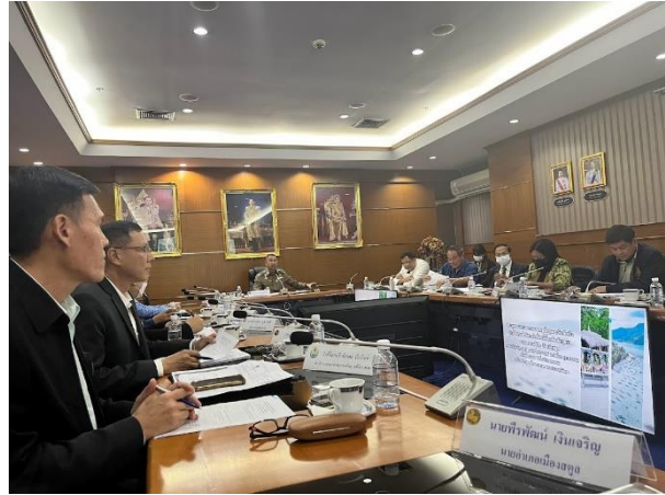
ภาพที่ 18 การประชุมคณะกรรมการตรวจสอบข้อมูลและข้อเท็จจริงกรณีปัญหาข้อพิพาทในที่ดินที่เกี่ยวข้องกับชุมชนชาวเล เกาะหลีเป๊ะ

ชายหาดที่ผู้คนบนเกาะใช้ร่วมกัน ทั้งบนสินค้าข้าวของจำเป็นต่าง ๆ ซึ่งเป็นเส้นทางเดียวกับการนำเครื่องมือประมง เช่น ลอบหรือไซ ไปยังหน้าหาดเพื่อประกอบอาชีพก็ไม่สามารถทำได้ ทำให้ชาวเลประสบปัญหาความเดือดร้อนไม่สามารถใช้เส้นทางในการสัญจรได้ 19 จึงเป็นที่มาของการเรียกร้องให้มีการแก้ไขปัญหาลอกประเภท จันทรอชา (อดีต นายกรัฐมนตรี) จึงได้มีคำสั่งสำนักนายกรัฐมนตรี ที่ 339/2565 เรื่อง แต่งตั้งคณะกรรมการตรวจสอบข้อมูลและข้อเท็จจริงกรณี ปัญหาข้อพิพาทในที่ดินที่เกี่ยวข้องกับชุมชนชาวเลเกาะหลีเป๊ะ จังหวัดสตูล ลงวันที่ 29 ธันวาคม 2565 โดยมีพลเอกสุรเชษฐ์ หักพาล เป็นประธานคณะกรรมการ ดำเนินการแก้ไขปัญหามาอย่างต่อเนื่อง