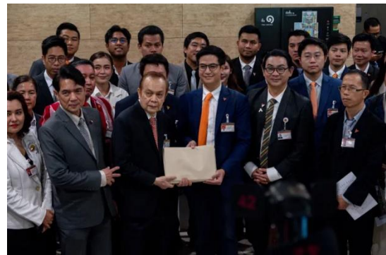
ภาพที่ 2 พรรคการเมืองยื่น พรบ.คุ้มครองสิทธิชาติพันธุ์ฯ ในวันชาติพันธุ์สากล

อย่างไรก็ดี ในปี 2566 ยังมีการเคลื่อนไหวของพรรคการเมืองและภาคประชาชนที่ร่วมกันผลักดันให้มีกฎหมายเพื่อการคุ้มครองและส่งเสริมวิถีชีวิตกลุ่มชาติพันธุ์ โดยในช่วงเดือนสิงหาคมซึ่งถือเป็นเดือนแห่งการเฉลิมฉลองและรณรงค์ว่าด้วยสิทธิชนเผ่าเมืองสากล ได้มีพรรคการเมืองยื่นเสนอ “ร่างพระราชบัญญัติส่งเสริมและคุ้มครองกลุ่มชาติพันธุ์และชนเผ่าพื้นเมือง พ.ศ. ...” เข้าสู่กระบวนการพิจารณาของสภาผู้แทนราษฎร 3 โดยนำเสนอให้เห็นว่าปัจจุบันประชากรกลุ่มชาติพันธุ์ในประเทศ