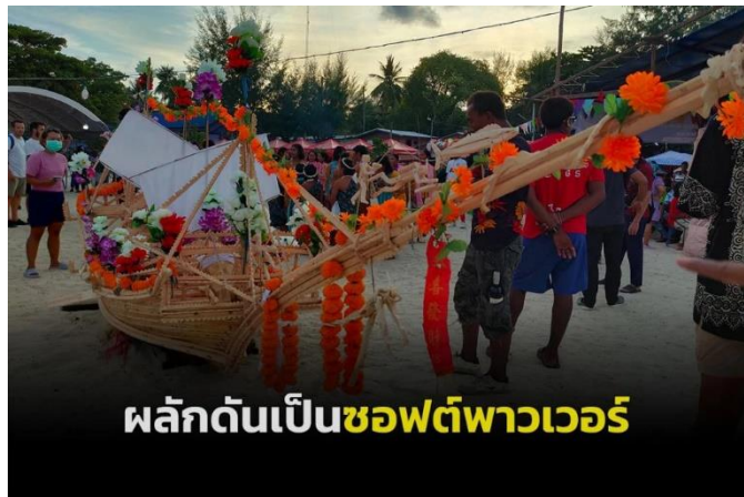
ภาพที่ 11 พิธีลอยเรือของกลุ่มชาติพันธุ์ชาวเลอุรักลาไว๋

เดือนธันวาคม 2566 กระทรวงวัฒนธรรมได้มีการพิจารณาขึ้นบัญชีประกาศให้ประเพณีลอยเรืออุรักลาไว๋เป็นมรดกภูมิปัญญาทางวัฒนธรรมระดับชาติ ด้านแนวปฏิบัติทางสังคม พิธีกรรม ประเพณี และเทศกาล ประจำปี 2566 12 โดยเกิดจากการร่วมกันผลักดันของสำนักงานวัฒนธรรมจังหวัดสตูลและชุมชนชาติพันธุ์ชาวเลเกาะหลีเป๊ะ ที่ได้มีการศึกษารวบรวมข้อมูลและนำเสนอให้เห็นว่าประเพณีลอย