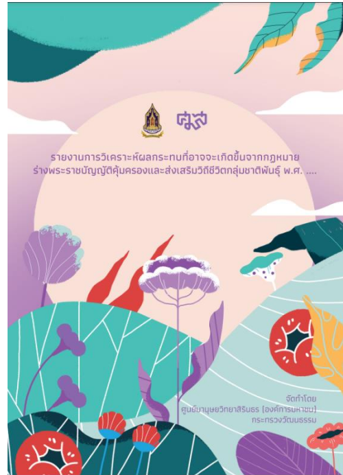
ภาพที่ 1 รายงานการวิเคราะห์ผลกระทบที่อาจเกิดขึ้นจากกฎหมาย ของร่างพระราชบัญญัติคุ้มครองและส่งเสริมวิถีชีวิตกลุ่มชาติพันธุ์ พ.ศ. ....

การผลักดันให้มีกฎหมายเพื่อการคุ้มครองและส่งเสริมวิถีชีวิตกลุ่มชาติพันธุ์ ได้มีการดำเนินงานมาอย่างต่อเนื่อง สอดคล้องตามรัฐธรรมนูญแห่งราชอาณาจักรไทย พ.ศ.2560 มาตรา 70 รัฐพึงส่งเสริมและให้ความคุ้มครองชาวไทยกลุ่มชาติพันธุ์ต่าง ๆ ให้มีสิทธิดำรงชีวิตในสังคมตามวัฒนธรรม ประเพณี และวิถีชีวิตดั้งเดิมตามความสมัครใจได้อย่างสงบสุข ไม่ถูกรบกวน ทั้งนี้ เเท่าที่ไม่เป็นการขัดต่อความสงบเรียบร้อยหรือศีลธรรมอันดีของประชาชน หรือเป็นอันตรายต่อความมั่นคงของรัฐ หรือสุขภาพอนามัย 1 และแผนปฏิรูปประเทศด้านสังคมที่กำหนดให้ศูนย์มานุษยวิทยาสิรินธร เป็นหน่วยงานหลักในการจัดทำร่างกฎหมายดังกล่าว ซึ่งเริ่มดำเนินการมาตั้งแต่ปี 2563 โดยในช่วงต้นปี 2566 ศูนย์มานุษยวิทยาสิรินธร ได้เปิดเผยผลการรับฟังความคิดเห็นและการวิเคราะห์ผลกระทบที่อาจเกิดขึ้นจากร่างพระราชบัญญัติคุ้มครองและส่งเสริมวิถีชีวิตกลุ่มชาติพันธุ์ พ.ศ. ... ซึ่งชี้ให้เห็นว่า การมีพระราชบัญญัตินี้ดังกล่าวจะก่อให้เกิดประโยชน์ใน 3 ระดับคือ 1) ระดับประเทศ จะเป็นส่วนสำคัญต่อการสงวนรักษามรดกทางวัฒนธรรมของชาติ เกิดการพัฒนาเศรษฐกิจบนฐานภูมิปัญญาและศักยภาพกลุ่มชาติพันธุ์ ตลอดจนการสร้าง confianza ให้กับประเทศ โดยมุ่งส่งเสริมความเข้าใจความแตกต่างและยอมรับความหลากหลายในวิถีวัฒนธรรมกลุ่มชาติพันธุ์ 2) ระดับสังคม ส่งเสริมให้สังคมเรียนรู้ความหลากหลายทางวัฒนธรรมของกลุ่มชาติพันธุ์ ลดช่องว่างความเหลื่อมล้ำในสังคม โดยมุ่งให้กลุ่มชาติพันธุ์มีศักยภาพในการดำรงชีวิตบนฐานภูมิปัญญาและวัฒนธรรม 3) ระดับประชาชน แบ่งเป็นประชาชนกลุ่มชาติพันธุ์จะได้รับการคุ้มครองสิทธิทางวัฒนธรรม ปกป้องไม่ให้ถูกคุกคาม ถูกละเมิดเหยียดหยามหรือเลือกปฏิบัติ สามารถดำรงชีวิตบนฐานภูมิปัญญา วิถีวัฒนธรรมของตน