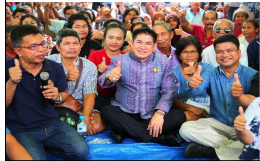
ภาพที่ 5 ร้อยเอกธรรมนัส พรหมเผ่า รว. เกษตรฯ รองประธานคณะกรรมการแก้ไขปัญหาพ็มพพบกลุ่มผู้ชุมนุม

รัฐบาลเดินหน้าแก้ปัญหา ‘พ็มพ’ 10 ด้าน พม.-พอช. ร่วมแก้ปัญหากลุ่มชาติพันธุ์-ที่ดิน-ที่อยู่อาศัย