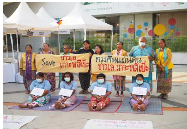
ภาพที่ 17 ชาวเลเกาะหลีเป๊ะจัดกิจกรรมเชิงสัญลักษณ์สื่อสาร สร้างการรับรู้สถานการณ์ปัญหาต่อสังคม

ปมความขัดแย้งระหว่างกลุ่มชาติพันธุ์ชาวเลและนายทุนที่อ้างกรรมสิทธิ์ครอบครองได้ปรากฏขึ้น เมื่อนายทุนได้เข้าครอบครองที่ดินที่อยู่อาศัยและพื้นที่จิตวิญญาณของชาวเล โดยอ้างเอกสารสิทธิ์ครอบครองตามกฎหมาย ส่งผลให้ชาวเลต้องเผชิญกับการถูกฟ้องร้องดำเนินคดีในชั้นศาลมาอย่างต่อเนื่อง และเหตุการณ์สำคัญที่ทำให้เรื่องราวชาวเลเกาะหลีเป๊ะเป็นที่รับรู้ของสังคมอย่างกว้างขวางนั้น เริ่มขึ้นอีกครั้งในปี 2565 เมื่อนายทุนเอกชนอ้างเอกสารสิทธิ์ ทำการสร้างรั้วกั้นทางสาธารณะ ทั้งทางลงพื้นที่หาดและทางเข้าโรงเรียนบ้านเกาะหลีเป๊ะ ทำให้นักเรียนไม่สามารถเดินเข้า-ออกโรงเรียน ในเส้นทางที่ยืนยันใช้มาแต่ดั้งเดิมได้ รวมถึงทางเดินลง