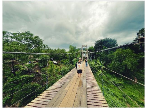
ภาพที่ 12 สะพานข้ามแม่น้ำเพชรบุรีก่อนเข้าสู่บ้านบางกลอย 3 กันยายน 2565

ชาวกะเหรี่ยงบ้านบางกลอยเป็นกลุ่มชาติพันธุ์ที่ได้รับผลกระทบจากการถูกให้ย้ายถิ่นที่อยู่ดั้งเดิมใจกลางผืนป่าแก่งกระจานหรือที่เรียก “ใจแผ่นดิน” มาอยู่บางกลอยล่าง หมู่บ้านโป่งลึก ตั้งแต่ปี พ.ศ. 2539 การตั้งถิ่นฐานในพื้นที่ใหม่เป็นเงื่อนไขที่ทำให้ชาวกะเหรี่ยงกลุ่มดังกล่าวต้องปรับตัว ปรับเปลี่ยนวิถีการดำรงชีวิตให้สอดคล้องกับบริบทสังคม และระบบนิเวศที่เปลี่ยนแปลงไป แม้รัฐจะมีการจัดสรรที่ดินผืนใหม่ให้อยู่อาศัยและทำกิน แต่ก็ไม่เพียงพอ ขณะเดียวกันยังพบว่าผืนดินที่ได้รับการจัดสรร