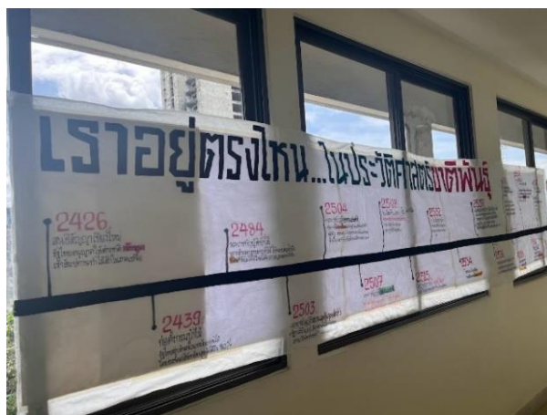
ภาพที่ 14 การจัดแสดงนิทรรศการแสดงข้อมูลลำดับเหตุการณ์ชาวกะเหรี่ยงบางกลอย 22 สิงหาคม 2566

ประเด็นสำคัญที่มีการพูดคุยและนำเสนอในเวทีสาธารณะครั้งนี้ได้เน้นย้ำให้เห็นว่า กรณีปัญหาที่เกิดขึ้นกับชาวกะเหรี่ยงบ้านบางกลอยเกิดจากกระบวนการทัศน์หลักในการอนุรักษ์และจัดการป่าไม้ของไทยที่เชื่อว่าป่าต้องปลอดคน จึงนำมาสู่วิธีการในการอนุรักษ์และจัดการป่าที่มุ่ง