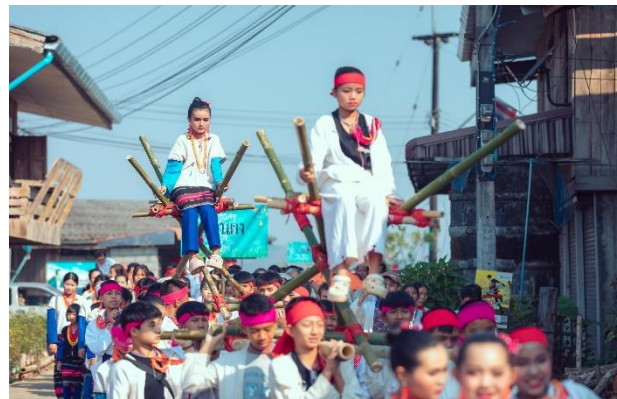
ภาพที่ 9 บรรยากาศขบวนแห่ของเครือข่ายกลุ่มชาติพันธุ์ละเวือะ ในงานสืบสานวัฒนธรรมชนเผ่าละเวือะ ครั้งที่ 2 ณ บ้านละอูบ

ตลอดระยะเวลาเวลาที่ผ่านมา สังคมไทยได้ให้ความสำคัญกับการเปิดพื้นที่ให้กลุ่มชาติพันธุ์ได้นำเสนอตัวตนผ่านการบอกเล่าเรื่องราว การจัดกิจกรรมตามประเพณี ความเชื่อ การแต่งกายและการใช้ภาษาที่หลากหลาย ถือเป็นกระบวนการสำคัญที่ตอกย้ำให้สังคมได้เรียนรู้ร่วมกันว่าสังคมไทยประกอบด้วยกลุ่มคนที่มีความหลากหลายทางวัฒนธรรม การใช้ภาษา และวิถีการดำรงชีวิตที่แตกต่าง ดังปรากฏในช่วงเดือนมีนาคม 2566 กลุ่มชาติพันธุ์ละเวือะได้จัดงานสืบสานวัฒนธรรมชนเผ่าละเวือะ ครั้งที่ 2 ณ บ้านละอูบ ต.ห้วยห่อม อ.แม่ลาน้อย จ.แม่ฮ่องสอน 10 การจัดงานดังกล่าวได้แสดงให้เห็นศักยภาพของกลุ่มชาติพันธุ์ละเวือะในการสืบทอดและดำรงประเพณี วิถีปฏิบัติในชีวิตตั้งแต่การเกิด การแต่งงาน การขึ้นบ้านใหม่ การตาย การทำไร่หมุนเวียน การอนุรักษ์และจัดการทรัพยากรธรรมชาติ การแต่งกายและการใช้ภาษาที่เป็น