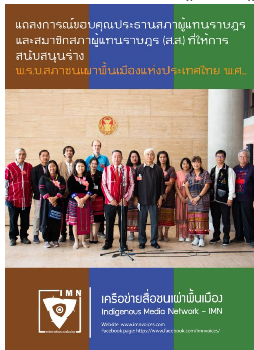
ภาพที่ 3 เครือข่ายสภาชนเผ่าพื้นเมืองแถลงข่าวขอบคุณประธานและรองประธานสภาผู้แทนราษฎร ที่สนับสนุนให้มีการอภิปรายร่าง พ.ร.บ.สภาชนเผ่าพื้นเมือง

อย่างไรก็ตาม การผลักดันให้มีกฎหมายเพื่อการคุ้มครองและส่งเสริมวิถีชีวิตกลุ่มชาติพันธุ์ ยังมีร่างกฎหมายอีก 1 ฉบับที่อยู่ระหว่างการพิจารณาของนายกรัฐมนตรีนว่าเป็นกฎหมายที่เกี่ยวข้องกับการเงินหรือไม่คือ “ร่างพระราชบัญญัติคุ้มครองสิทธิและส่งเสริมวิถีชีวิตกลุ่มชาติ