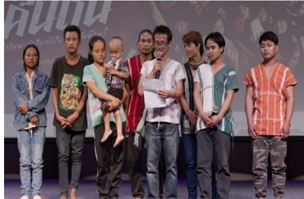
ภาพที่ 13 ชาวกะเหรี่ยงบ้านบางกลอยร่วมเวทีสาธารณะ อ่านแถลงการณ์ยืนยันการกลับไปดำรงชีวิตตามวิถีดั้งเดิมที่ใจแผ่นดิน

อย่างไรก็ตามภายหลังจากการลงนามเห็นชอบของนายกรัฐมนตรีต่อแนวทางการแก้ไขปัญหาดังกล่าว ชาวกะเหรี่ยงบ้านบางกลอยต่างมีความหวังที่จะกลับไปทำกินด้วยวิธีการทำไร่หมุนเวียน แต่ภายใต้กระบวนการดำเนินงานที่เกี่ยวข้องกับหน่วยงาน องค์กรหลายภาคส่วน โดยเฉพาะความกังวลต่อผลกระทบที่จะเกิดขึ้นต่อทรัพยากรธรรมชาติในผืนป่าแก่งกระจาน ทำให้การดำเนินการยังไม่ปรากฏความคืบหน้ามากนัก ชาวกะเหรี่ยงบ้านบางกลอยจึงร่วมกับภาคีเครือข่ายภาคประชาสังคมจัดเวทีสาธารณะ “3 ปี บางกลอยคืนถิ่น ถึงไหน ทำไมยังไม่ได้กลับบ้าน?” เมื่อวันที่ 22 สิงหาคม 2566 ณ ศูนย์มานุษยวิทยาสิรินธร 16 โดยนำเสนอผ่านการจัดนิทรรศการภาพถ่าย ซึ่งรวบรวมจากเครือข่ายภาคประชาสังคมที่เคยลงพื้นที่ติดตามเรื่องราวของชาวบางกลอย และเห็นปัญหาต่าง ๆ รวมถึงการร่วมต่อสู้เรียกร้องเพื่อชาวบางกลอย พร้อมทั้งข้อมูลลำดับเหตุการณ์ เพื่อเป็นการทบทวนสะท้อนภาพปัญหา ผลกระทบชาวกะเหรี่ยงบางกลอย จ.เพชรบุรี ที่ยังไม่สามารถกลับถิ่นฐานเดิมเพื่อดำรงชีวิตทำไร่หมุนเวียนตามวิถีดั้งเดิมของตน ซึ่งเป็นความมั่นคงทางอาหารและความมั่นคงในชีวิตของพวกเขา