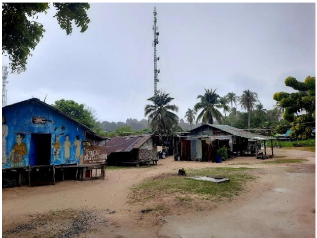
ภาพที่ 16 สภาพบ้านเรือนชาวเลบนเกาะหลีเป๊ะ