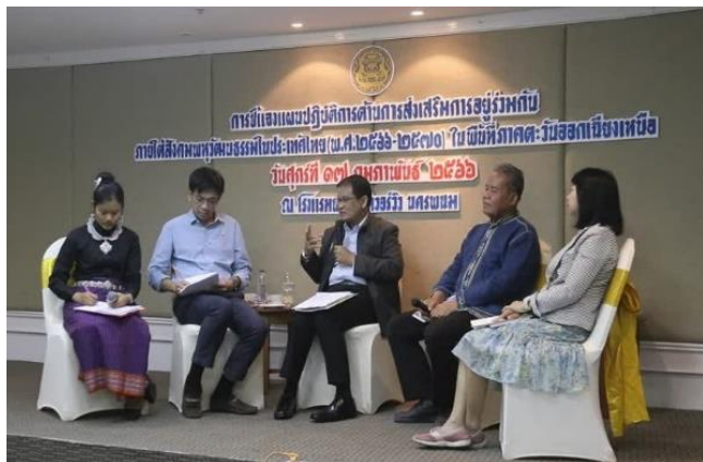
ภาพที่ 4 เวทีประชุมชี้แจงแผนปฏิบัติการด้านการส่งเสริมการอยู่ร่วมกันภายใต้สังคมพหุวัฒนธรรมในประเทศไทย (พ.ศ. 2566 – 2570)

การดำเนินงานเพื่อนำไปสู่การแก้ไขปัญหาที่เกี่ยวข้องกับกลุ่มชาติพันธุ์ในสังคมไทย นอกจากการผลักดันให้มีกฎหมายเพื่อการคุ้มครองและส่งเสริมวิถีชีวิตกลุ่มชาติพันธุ์โดยการมีส่วนร่วมทั้งจากภาครัฐ พรรคการเมือง และภาคประชาชนแล้ว การขับเคลื่อนในด้านนโยบายเป็นอีกหนึ่งความเคลื่อนไหวที่น่าสนใจ เมื่อสภาความมั่นคงแห่งชาติ (สมช.) ได้มีดำเนินการขับเคลื่อนแผนปฏิบัติการด้านการส่งเสริมการอยู่ร่วมกันภายใต้สังคมพหุวัฒนธรรมในประเทศไทย (พ.ศ. 2566 – 2570) 5 โดย