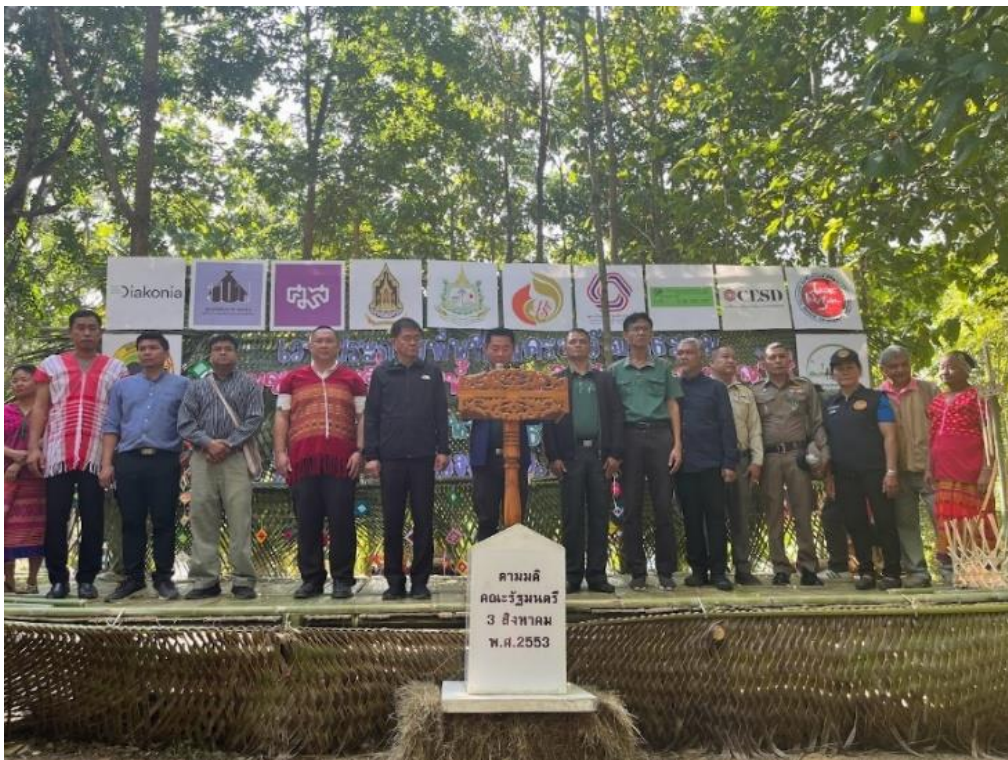
ภาพที่ 7 การจัดกิจกรรมประกาศพื้นที่คุ้มครองวิถีชีวิตกลุ่มชาติพันธุ์ชุมชนกะเหรี่ยงลุ่มน้ำลำตะเพิน ต.วังยาว อ.ด่านช้าง จ.สุพรรณบุรี 8 ธันวาคม 2566

คุ้มครองวิถีชีวิตกลุ่มชาติพันธุ์บ้านหินลูกเดียว ต.ไม้ขาว อ.กลาง จ.ภูเก็ต เมื่อวันที่ 26 พฤศจิกายน 2566 8 และการจัดงานประกาศพื้นที่คุ้มครองวิถีชีวิตชุมชนชาติพันธุ์กะเหรี่ยงลุ่มน้ำลำตะเพิน ต.วังยาว อ.ด่านช้าง จ.สุพรรณบุรี ในวันที่ 8-10 ธันวาคม 2566 9 ซึ่งในการจัดงานประกาศพื้นที่คุ้มครองวิถีชีวิตกลุ่มชาติพันธุ์ทั้ง 2 แห่งนั้น ได้เน้นย้ำให้เห็นหลักการสำคัญของการประกาศเป็นพื้นที่คุ้มครองวิถีชีวิตกลุ่มชาติพันธุ์คือการจัดทำข้อมูลชุมชนที่แสดงให้เห็นข้อมูลหลักฐานทางประวัติศาสตร์ เพื่อยืนยันหลักสิทธิชุมชนดั้งเดิม ตลอดจนการนำเสนอให้เห็นข้อมูลวิถีชีวิต วัฒนธรรม ภูมิปัญญาที่แสดงให้เห็นความโดดเด่นและอัตลักษณ์ของความเป็นชุมชนชาติพันธุ์ การจัดทำข้อมูลพื้นที่ทางกายภาพของชุมชนให้ชัดเจน ประกอบด้วยพื้นที่อยู่อาศัย พื้นที่ทำกิน พื้นที่ใช้ประโยชน์ พื้นที่พิธีกรรม และพื้นที่อนุรักษ์ ซึ่งพื้นที่เหล่านี้สามารถเรียกรวมได้ว่าเป็น “พื้นที่จิตวิญญาณ” ของชุมชนชาติพันธุ์