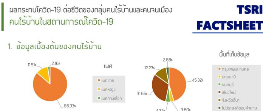
ที่มา: (บุญเลิศ วิเศษปรีชา และคณะ, 2563)

กล่าวคือสภาพปัญหาคนไร้บ้านที่ขยายตัวอย่างรวดเร็วยังคงไม่ปรากฏความชัดเจนต่อแนวทางการแก้ไขหรือรับมือต่อปัญหาดังกล่าว