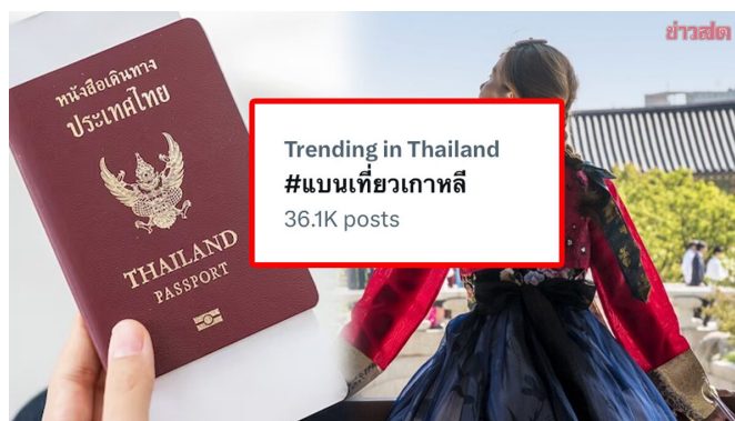
รูปที่ 1: กระแส “แบนเที่ยวเกาหลี” ที่ขึ้น Hashtag อันดับ 1 ในโลกทวิตเตอร์(X)

ภายใน 90 วัน กล่าวคือทำงานและอยู่อาศัยในเกาหลีได้อย่างผิดกฎหมายจนกว่าจะพอใจ หรือที่สังคมไทยคุ้นชินกันดีกับคำว่า "ผีน้อย" (อุมาพร สิทธิบูรณาญา, 2019)