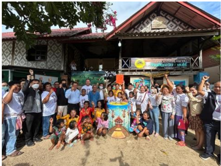
รูป 4 ภาพงานวันรวมญาติชาติพันธุ์ชาวเลครั้งที่ 12 บ้านทับตะวัน ต.บางม่วง อ.ตะกั่วป่า จ.พังงา มีการประกาศให้เป็นพื้นที่คุ้มครองวิถีชีวิตกลุ่มชาติพันธุ์แห่งแรกของกลุ่มชาติพันธุ์ชาวเล

การประกาศให้มีมติคณะรัฐมนตรีว่าด้วยการฟื้นฟูวิถีชีวิตชาวเล เมื่อ 2 มิถุนายน 2553 ถือเป็นจุดเริ่มต้นของจุดเปลี่ยนสำคัญที่ส่งผลต่อวิถีการดำรงอยู่ของชาวเล เพราะการประกาศให้มีมติคณะรัฐมนตรีดังกล่าวได้ถูกนำไปใช้ประกอบการดำเนินงานของหน่วยงานภาครัฐ โดยเฉพาะในมิติของการส่งเสริม ฟื้นฟู และอนุรักษ์วิถีชีวิต วัฒนธรรม ภูมิปัญญาของกลุ่มชาติพันธุ์ชาวเล ผ่านกลไกของหน่วยงานภาครัฐ องค์กรพัฒนาเอกชนและเครือข่ายชุมชนชาติพันธุ์ชาวเลในพื้นที่ 5 จังหวัด ขณะเดียวกัน