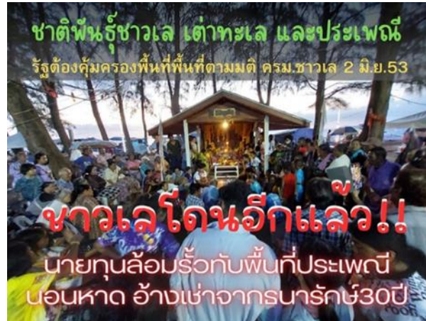
รูป 3 ภาพแสดงการสื่อสารเรียกร้องให้มีการปกป้องคุ้มครองพื้นที่นอหาดของชุมชนชาวเล จ.ภูเก็ต

มั่นคงในที่ดินทำกินและอยู่อาศัยของชาวเล ยังเกี่ยวข้องกับการถูกประกาศเป็นเขตอนุรักษ์ทรัพยากรธรรมชาติของรัฐ ทำให้ชาวเลในหลายพื้นที่กลายเป็นผู้บุกรุกไม่มีสิทธิครอบครองและใช้ประโยชน์ในทรัพยากรธรรมชาติในพื้นที่ตามวิถีดั้งเดิมของตน เช่น ชาวเลมอแกนหมู่เกาะสุรินทร์ ที่มีประวัติศาสตร์การอยู่อาศัยและใช้ประโยชน์ในท้องทะเลและป่าไม้ตามเกาะแก่ง และอ่าวต่าง ๆ ในบริเวณหมู่เกาะสุรินทร์มาช้านาน แต่ปัจจุบันพื้นที่ทั้งหมดที่เคยอยู่อาศัยและใช้ประโยชน์ได้ถูกประกาศเป็นพื้นที่อนุรักษ์ตามกฎหมายอุทยาน ทำให้ชาวเลมอแกนต้องปรับเปลี่ยนวิถีชีวิตมาตั้งบ้านเรือนที่ถาวรในพื้นที่อ่าวเดียวกัน ส่งผลให้มีสภาพความเป็นอยู่ที่แออัด ถูกจำกัดสิทธิในการประโยชน์จากทรัพยากรธรรมชาติตามวิถีภูมิปัญญา เช่น ไม่สามารถหาปลาตามเกาะแก่งต่าง ๆ รวมถึงการใช้ประโยชน์จากป่าไม้บนเกาะได้เหมือนอดีตที่ผ่านมา เป็นต้น ดังนั้นความไม่มั่นคงเกี่ยวกับที่ดิน ที่อยู่อาศัย จึงถือเป็นปัญหาเรื้อรังที่อยู่เคียงคู่กลุ่มชาติพันธุ์ชาวเลมาโดยตลอด แม้จะมีการประกาศมติคณะรัฐมนตรีว่าด้วยการฟื้นฟูวิถีชีวิตชาวเลตั้งแต่วันที่ 2 มิถุนายน 2553 เป็นต้นมา แต่ก็ยังไม่สามารถนำไปสู่การแก้ไขปัญหาที่ดินที่อยู่อาศัยและพื้นที่จิตวิญญาณของชาวเลให้หมดไปได้ ในห้วงเวลาของการครบรอบ 13 ปี การประกาศมติคณะรัฐมนตรี และการเปลี่ยนแปลงของรัฐบาลใหม่ที่กำลังจะเข้ามาปฏิบัติหน้าที่ต่อ กลุ่มชาติพันธุ์ชาวเลจึงยังคงมีความหวังกับก้าว