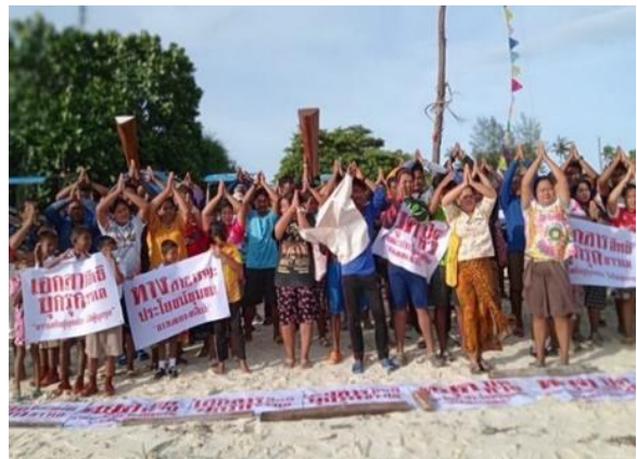
รูป 2 ภาพแสดงการเรียกร้องให้มีการแก้ไขปัญหาความขัดแย้งระหว่างชาวเลกับนายทุนบนเกาะหลีเป๊ะ

ปัจจุบันชุมชนชาติพันธุ์ชาวเลในหลายพื้นที่กำลังเผชิญกับการถูกคุกคามและริดรอนสิทธิจากนายทุนที่อ้างกรรมสิทธิ์ครอบครองที่อยู่อาศัย และพื้นที่สาธารณะ เช่น กรณีชาวเลเกาะหลีเป๊ะที่ถูกนายทุนอ้างกรรมสิทธิ์ครอบครองพื้นที่หน้าหาดที่อยู่อาศัย และพื้นที่จิตวิญญาณหรือสุสานดั้งเดิมของชาวเล โดยการสร้างรีสอร์ท โรงแรมที่พัก หับที่ของชาวเล รวมถึงการปิดเส้นทางที่ชาวเลใช้สัญจรไปมา ขณะเดียวกันก็เผชิญกับการถูกข่มขู่คุกคาม ด้วยการใช้อิทธิพลและการอ้างกฎหมายทำให้ชาวเลเกิดความหวาดกลัว เนื่องจากไม่มี