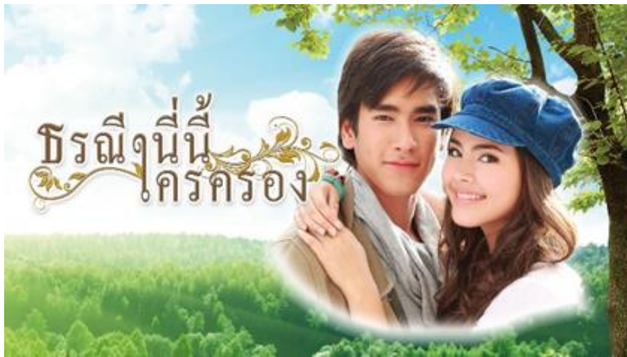
รูปที่ 10 ภาพหน้าปกละครเรื่อง ธณีนีนี่ใครครอง

“เลือดมังกร” ที่พยายามปลูกกระแสลูกหลานจีนในประเทศไทยให้ต่อสู้กับโลกที่เปลี่ยนแปลงไป จากรุ่นพ่อและแม่ที่พยายามใช้ความรุนแรงในการควบคุมกิจการหรือการทำธุรกิจ สู้ยุคลูกหลาน ได้ลดความรุนแรงลง สร้างความชอบธรรมและปรับรูปแบบธุรกิจไปเป็นแบบความรับผิดชอบต่อสังคมเชิงบริษัท (Corporate social responsibility) ที่ควบคุมหรือถ่วงดุลลัทธิทุนนิยมแทนระบบทุนนิยมเดิม จากตัวอย่างละครที่มีประเด็นว่าด้วยสังคมไทยในกระแสความเปลี่ยนแปลง สิ่งที่ได้พบ คือ การได้เห็นภาพความพยายามที่จะเปลี่ยนแปลงของสังคมไทยที่มีการพัฒนาและปรับตัว เพื่อให้เข้ากับกระแสโลกาภิวัตน์