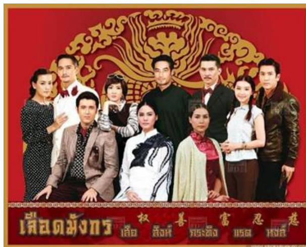
รูปที่ 11 ภาพหน้าปกละครเรื่องเลือดมังกร