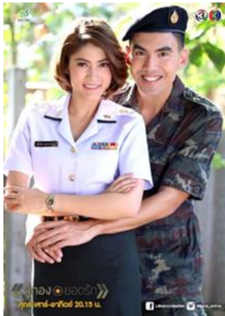
รูปที่ 6 ภาพหน้าปกละครเรื่อง ผู้กองยอดรัก

ประเด็นที่ว่าด้วยมนุษย์กับความสัมพันธ์ก็เป็นอีกประเด็นหนึ่งที่ถูกวิเคราะห์ได้ผ่านละครโทรทัศน์ นอกจากความสัมพันธ์ระหว่างเพศที่ได้กล่าวไปในบทที่ผ่านมา ในสังคมยังมีความสัมพันธ์ระหว่างมนุษย์รูปแบบอื่นอยู่ เช่น ความสัมพันธ์เรื่องของชนชั้นศักดินา ในละครเรื่อง “ผู้กองยอดรัก” เรื่องราวของหนุ่มทหารเกณฑ์ที่หลงรักผู้กองสาว ทำให้ผู้พันพ่อของผู้กองสาวไม่พอใจ เนื่องจากมองว่าเป็นเพียงแค่ทหารเกณฑ์จะพยายามมาเด็ดดอกฟ้า ผู้พันจึงพยายามกีดกันทั้งสองคนในทางกัน ซึ่งละครได้ใช้ความตลกแทรกเข้ามา เพื่อลดเส้นแบ่งระหว่างเส้นชนชั้นศักดินาที่ปรากฏในละคร หรือประเด็นในความสัมพันธ์เชิงอำนาจจากละครเรื่อง “หัตถการองพิภพ” ที่คุณหญิงศรีพยายามใช้อำนาจของการเป็นเรือนหลังใหญ่ ทำทาบกับอำนาจของพระยาสมิทธิภูมิ ในบทนี้จึงสะท้อนให้เห็นว่า นอกจากความสัมพันธ์ที่เกิดขึ้นระหว่างเพศ ที่เป็นเพศชายและเพศหญิง ยังมีความสัมพันธ์อีกหลากหลายมิติ เช่น อำนาจและชนชั้นศักดินา ที่คอยเชื่อมกันอยู่ ไม่ว่าจะเป็นการช่วงชิงกันของอำนาจหรือการกีดกันจากความต่างทางฐานะ ซึ่งหากสังเกตดูจะพบว่า ละครโทรทัศน์อาจใช้ความตลกหรือการแสดงเข้ามาลดภาพที่ดูเหลือมล้ำทางชนชั้นศักดินาหรืออำนาจในสังคม แต่ในความจริงกลับแตกต่างออกไป