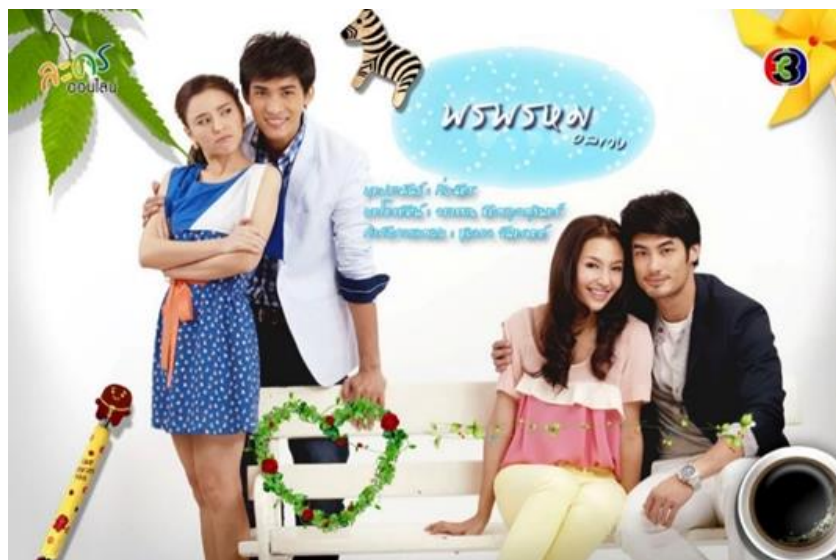
รูปที่ 2 ภาพหน้าปกละครเรื่อง พรหมอลวง

ส่วนประเด็นที่เกี่ยวกับครอบครัว ได้ยกตัวอย่างในเรื่องของความเป็นแม่ จากละครเรื่อง “ทองเนื้อเก้า” คำว่า “แม่” นิยามได้ว่าเป็นผู้ให้กำเนิดหรือเลี้ยงดูบุตร ในละครได้เสนอการเลี้ยงดูของ 2 ตัวละคร คือ “ปิ่น” แม่ของสันต์และ “แล” แม่ของลำยอง ซึ่งพฤติกรรมของแม่และการเลี้ยงดูของแม่ถือได้ว่าเป็นภาพสะท้อนจากแม่ออกมาผ่านลูก “ปิ่น” แสดงภาพแม่ที่ยันและเก็บอ้อมตามแบบฉบับแม่ที่ดีของคนไทย ส่วน “แล” แสดงภาพแม่ที่ทะเยอทะยาน อยากให้ลูกมีสามีที่รวย และมีพฤติกรรมที่ติดพันน เหล้า รวมถึงการเป็นขโมย สิ่งเหล่านี้ได้ส่งต่อทำให้ “สันต์” มีความขยัน ส่วน “ลำยอง” ติดพันน ดื่มเหล้า ไม่ต่างจากแม่ เทียบกับสุภาวิชิตไทยได้ว่า “ลูกไม้หล่นไม่ไกลต้น” แต่ถึงอย่างนั้น “ลำยอง” ที่ขึ้นชื่อว่าเป็นแม่ของ “วันเฉลิม” ในละคร “ลำยอง” ก็ไม่ได้เลี้ยงดู “วันเฉลิม” แต่ “วันเฉลิม” กลับมีความแสนดี กตัญญู และดูแล “ลำยอง” ในขณะที่คนอื่นไม่สนใจ จากการวิเคราะห์ละครทองเนื้อเก้าผ่านเรื่องที่ว่าด้วยเด็กและครอบครัว แม้ว่าสังคมไทยจะเชื่อในคำที่ว่าลูกที่ดีต้องมาจากพ่อแม่ที่ดี แต่ก็อาจมีข้อยกเว้นเนื่องจากสถาบันครอบครัวที่เป็นปัจจัยในการเลี้ยงดู ไม่ใช่สถาบันเดียวที่หล่อหลอมและดูแลเด็ก แต่ยังมีสังคมอื่น ๆ เช่น วัดหรือศาสนา ที่ช่วยกล่อมให้เด็กอยู่ในระเบียบของสังคมได้ จากละครทั้ง 2 เรื่อง ชี้ให้เห็นว่าเรื่องการเข้าใจเด็กหรือการเลี้ยงดูของสถาบันครอบครัว จะทำให้เข้าใจถึงสภาพเด็กและครอบครัวในสังคมมากขึ้น