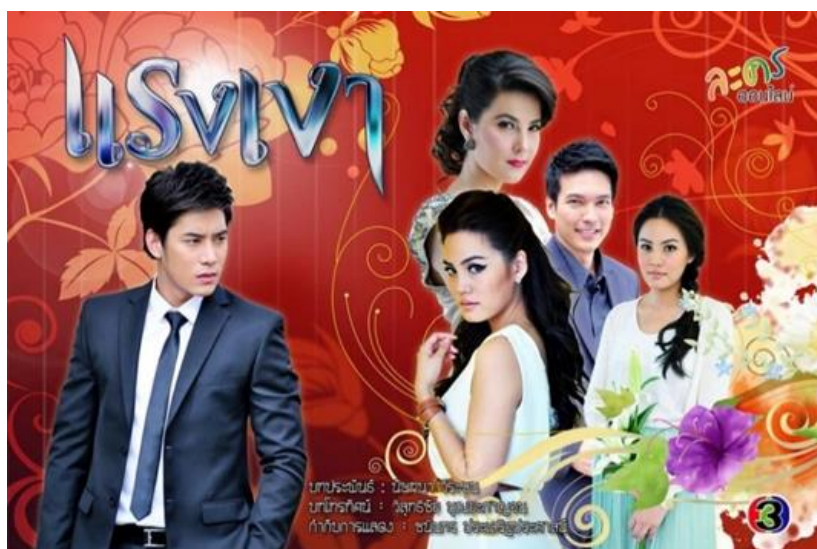
รูปที่ 5 ภาพหน้าปกละครเรื่อง แรงเงา