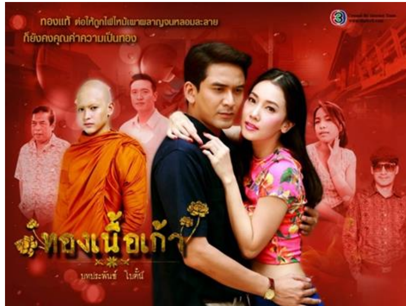
รูปที่ 3 ภาพหน้าปกละครเรื่อง ทองเนื้อเก่า

หมายเหตุจาก. https://www.sanook.com/movie/115369/gallery/958513/