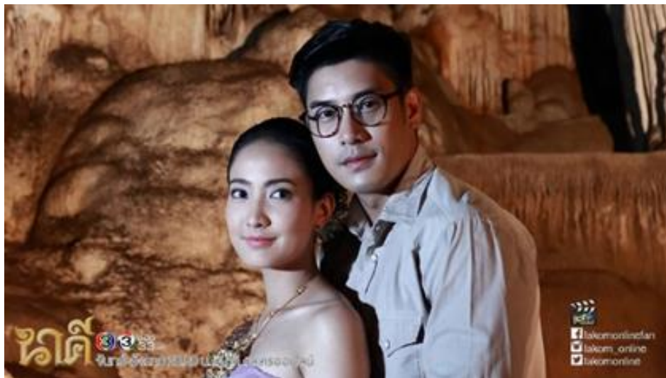
รูปที่ 9 ภาพหน้าปกละครเรื่อง นาคี หมายเหตุจาก. https://mgronline.com/drama/detail/9590000093234

และบทสุดท้ายของหนังสือคน ระคน ละคร จากประเด็นทั้งหมดที่กล่าวมาสู่ประเด็นที่ว่าด้วยสังคมไทยในกระแสความเปลี่ยนแปลง ที่ใช้ละครจำลองภาพของการเปลี่ยนแปลงของสังคม การปรับตัวของคนไทยต่อกระแสโลกาภิวัตน์ ละครเรื่อง “ธณีนีนี้ใครครอง” ที่ตัวละคร “อาทิจ” ได้เรียนจบในด้านการเกษตรจากกรุงเทพฯ และได้เดินทางกลับไปใช้ชีวิตในชุมชนที่เคยอยู่ ประสานความรู้ที่ได้มากับฐานของท้องถิ่น พัฒนาไร่ของคุณย่าและชุมชน หรือเป็นการประสานกระแสโลกาภิวัตน์กับพลังท้องถิ่นภูมิลักษณ์และชุมชนภูมิลักษณ์ หรือละครชุดเรื่อง