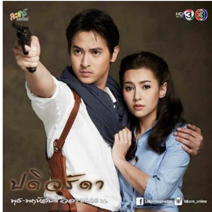
รูปที่ 4 ภาพหน้าปกละครเรื่อง ปดิวรีดา

ผู้คนที่เข้ามาทำร้าย และสร้างความยุติธรรมแก่ตนเอง จากบทนี้ชี้ให้เห็นประเด็นที่ว่าด้วยผู้หญิง และผู้ชาย ซึ่งทำให้เห็นภาพบทบาทของเพศ โดยเน้นไปที่บทบาทของผู้หญิงที่ได้มีการเปลี่ยนแปลงและมีความแข็งแกร่งมากขึ้นจากอดีตสู่ปัจจุบัน