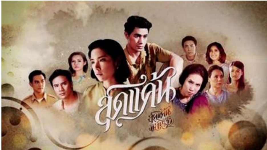
รูปที่ 8 ภาพหน้าปกละครเรื่อง สุดแค้นแสนรัก หมายเหตุจาก. https://ch3plus.com/oldseries/643