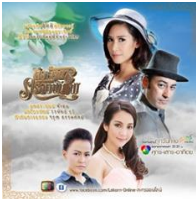
รูปที่ 7 ภาพหน้าปกละครเรื่อง หัตถาครองพิภพ

หมายเหตุจาก. https://mgronline.com/drama/detail/9560000147178