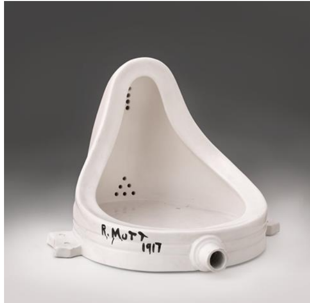
รูปที่ 3 โถปัสสาวะ The Fountain หมายเหตุจาก. https://papichayanan064.wordpress.com/2015/03/09/the-origins-of-modern-art/