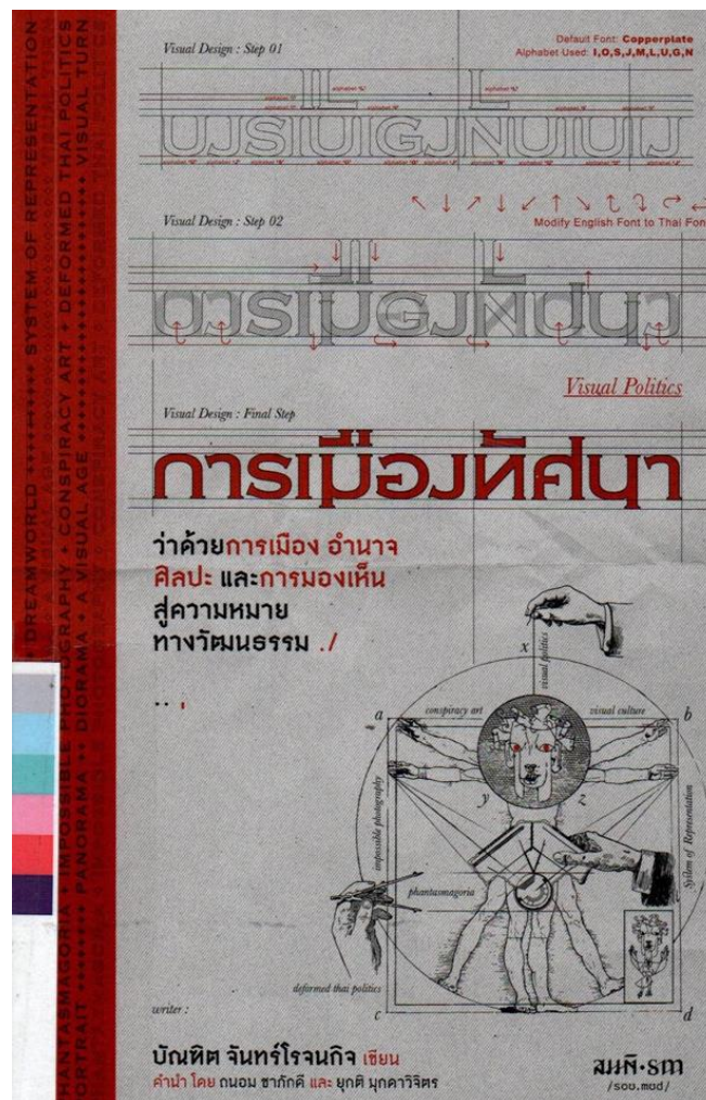
รูปที่ 1 ปกหนังสือ การเมืองทัศนาศิลปะ : ว่าด้วยการเมือง อำนาจ ศิลปะ และการมองเห็น สู่ความหมายทางวัฒนธรรม หมายเหตุจาก. ห้องสมุดศูนย์มานุษยวิทยาสิรินธร (องค์การมหาชน)

ดร.ถนอม ชากักดี นักวิจารณ์ศิลปะผู้ล่วงลับได้กล่าวในคำนำของหนังสือการเมือง ทัศนาศิลปะ : ว่าด้วยการเมือง อำนาจ ศิลปะ และการมองเห็น สู่ความหมายทางวัฒนธรรม ไว้ที่น่าสนใจว่า