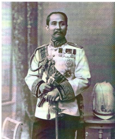
รูปที่ 4 พระบาทสมเด็จพระจุลจอมเกล้าเจ้าอยู่หัวทรงถือคทาจอมพลที่กองทัพบกได้สร้างทูลเกล้าฯ ถวายเมื่อ พ.ศ. 2446 หมายเหตุ. จาก หนังสือทหารของพระราชากับการสร้างสำนักแห่งศรัทธาและภักดี หน้า 55

ผู้เขียนได้วิเคราะห์ไว้ว่าการยกเลิกระบบไพร่และทาสรวมถึงการมีพระราชบัญญัติเกณฑ์ทหารล้วนแสดงให้เห็นถึงการได้รับพระมหากษัตริย์คุณจากรัชกาลที่ 5 ที่นอกจากจะเป็นการทลายกำแพงของระบบชนชั้นในสังคมแล้วการปลูกปั้นกองทัพสมัยใหม่ยังถือเป็นกองสร้างกองทัพส่วนพระองค์เพื่อป้องกันไม่ให้ขุนนางหรือผู้ที่อยู่ฝั่งตรงข้ามกับรัชกาลที่ 5