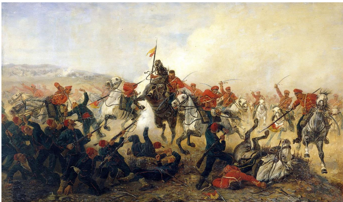
ภาพวาดสงครามระหว่างรัสเซียและตุรกีในช่วงปี ค.ศ. 1877-1878

(ที่มา: https://www.wikidata.org/wiki/Q174205 )