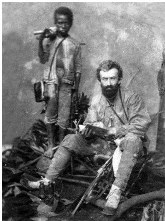
ภาพถ่ายของ Nicholas Miklouho-Maclay (ค.ศ. 1846-1888) ถ่ายในหมู่เกาะนิวกินี เขตมหาสมุทรแปซิฟิก ซึ่งเขาเดินทางมาถึงในวันที่ 20 กันยายน ค.ศ. 1871