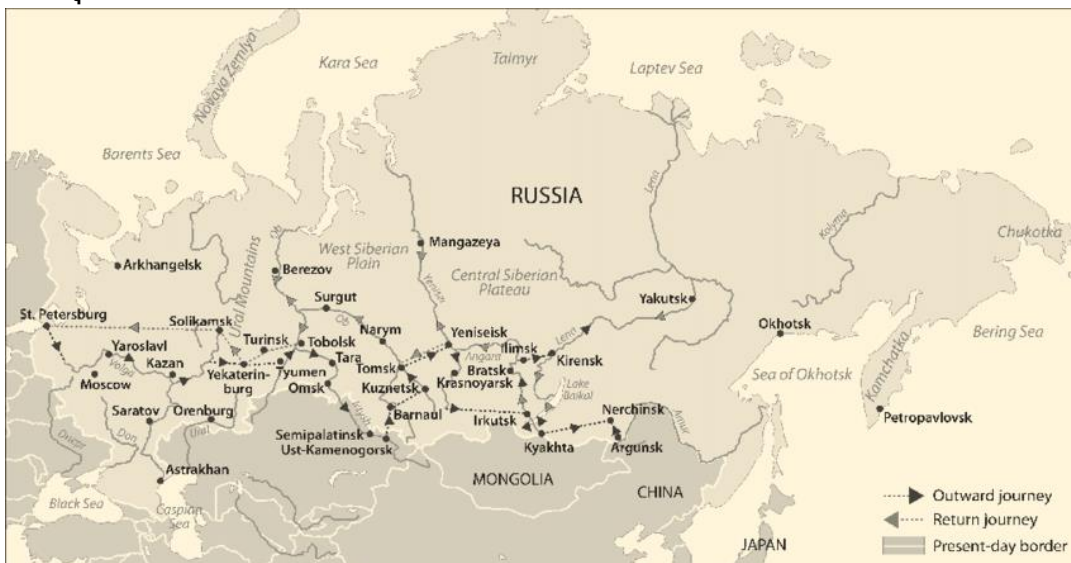
ภาพแผนที่แสดงเส้นทางการสำรวจภูมิประเทศและวัฒนธรรมในเขตไซบีเรียของ Gerhard Friedrich Muller ช่วงปี ค.ศ. 1733-1743