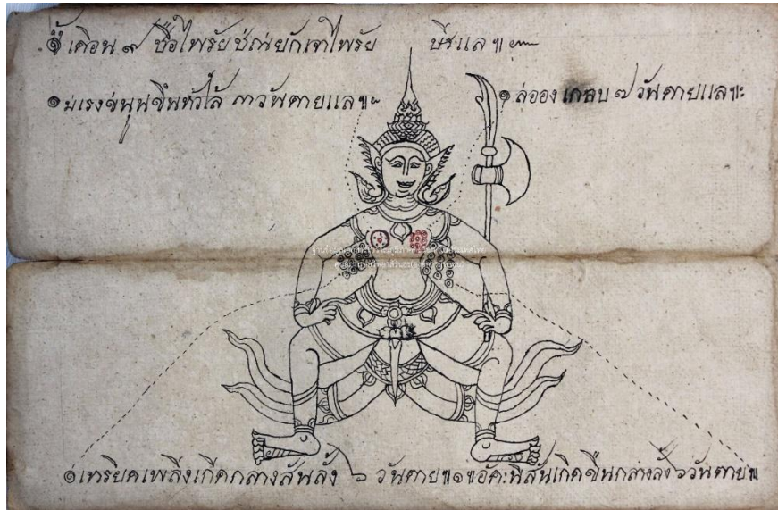
ภาพแผนผัง (ยักษ์) จากตำราผีมะเร็ง ในฐานะข้อมูลเอกสารโบราณภูมิภาคตะวันตกในประเทศไทย รหัสไฟล์ภาพ NPT002-002.TamraFiMareng-001-007

ภาพวาดแผนผังอีกประเภทหนึ่งจะวาดภาพเป็นรูปมนุษย์ทั้งชายและหญิง พร้อมภาพผีที่เกิดขึ้นในตำแหน่งต่าง ๆ ตามร่างกายตั้งแต่ศีรษะจนถึงฝ่าเท้า พร้อมบอกชื่อของผี จำนวนวันที่เกิดขึ้นของผีแล้วจะรอดหรือไม่รอด