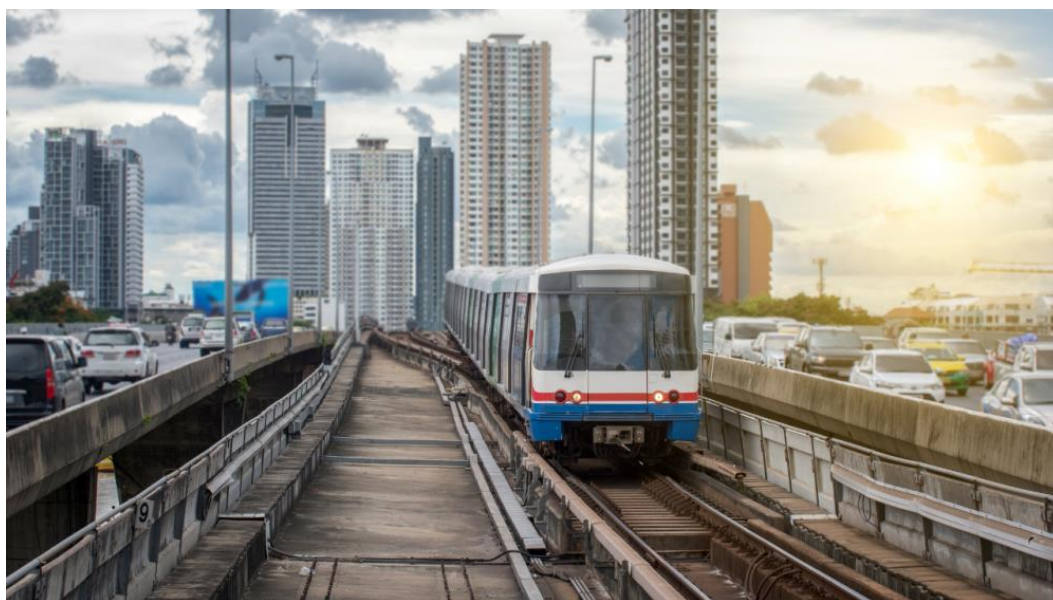
ในเขตเมืองจะมีการพัฒนาระบบสาธารณสุขปกคลุมที่ครบถ้วนและทันสมัย

นักมานุษยวิทยาชาวอเมริกัน Paul Farmer (2003) ได้นำแนวคิดความรุนแรงเชิงโครงสร้างไปใช้อธิบายโครงสร้างสังคมในฐานะเป็น “ปฏิบัติการสังคมแบบมวลชน” (collective social actions) โดยชี้ให้เห็นว่าสถาบันและองค์กรทางสังคมมีวิธีการปฏิบัติที่สร้างกฎเกณฑ์และระเบียบข้อบังคับอันส่งผลต่อความไม่เป็นธรรมทางสังคม กฎเกณฑ์ต่างๆ ที่สถาบันสังคมสร้างขึ้นแสดงออกในเชิงรูปธรรม เช่น การสร้างระบบสาธารณสุขปกคลุม เส้นทางคมนาคม ระบบชลประทาน ระบบไฟฟ้า และสิ่งอำนวยความสะดวกต่างๆ ในพื้นที่สาธารณะ รวมไปถึงการสร้างโรงเรียน โรงพยาบาล สนามบิน ปฏิบัติการเหล่านี้สะท้อนว่าความรุนแรงเชิงโครงสร้างเกิดขึ้นจากวิธีการจัดสรรทรัพยากรที่ไม่เป็นธรรม เช่น ในเขตเมืองจะมีการพัฒนาระบบสาธารณสุขปกคลุมที่ครบถ้วนและทันสมัย ในขณะที่เขตชนบทจะไม่มีการพัฒนาถนนหนทาง ไฟฟ้าและน้ำประปา การจัดสรรทรัพยากรที่ไม่เท่าเทียมนี้ทำให้คนในพื้นที่ชนบทมีคุณภาพชีวิตที่แย่กว่าคนเมือง