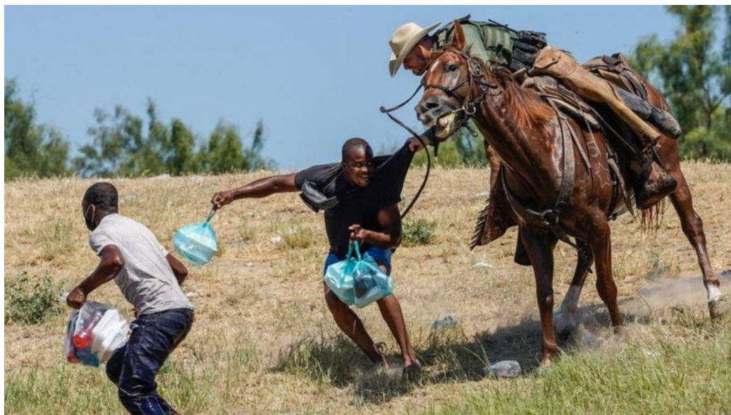
ภาพเจ้าหน้าที่ขี่ม้าไล่กวาดผู้อพยพ พร้อมกวัดแกว่งสายบังเหียนยาวราวกับแส้ที่พรมแดนสหรัฐฯ - เม็กซิโก

เม็กซิโกจะถูกจ้างด้วยราคาต่ำ แต่ผลกำไรจากสินค้าจะตกเป็นของบริษัทชาวอเมริกัน ชาวเม็กซิโกจึงดิ้นรนที่จะเดินทางไปทำงานทำในต่างประเทศเพื่อที่จะมีรายได้เพิ่มขึ้น และเป้าหมายของชาวเม็กซิโกคือการเข้าไปทำงานในสหรัฐอเมริกาซึ่งเสี่ยงต่อการถูกจับและมีชีวิตอย่างไร้ศักดิ์ศรี สิ่งนี้สะท้อนระบอบอำนาจของความรุนแรง