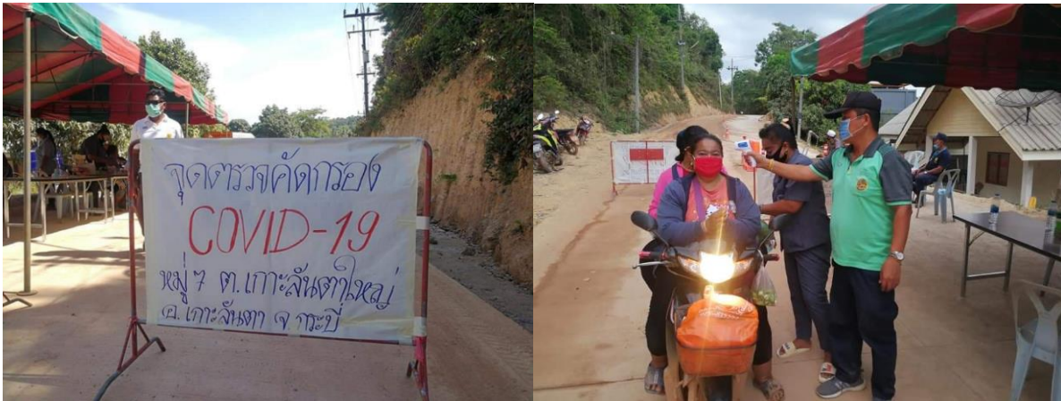
ภาพผู้นำท้องถิ่นและเจ้าหน้าที่ อสม. ชุมชนสังกาอู๋ กำลังวัดอุณหภูมิบริเวณจุดคัดกรอง COVID-19 ภายในชุมชน ช่วงเดือน เมษายน 2563