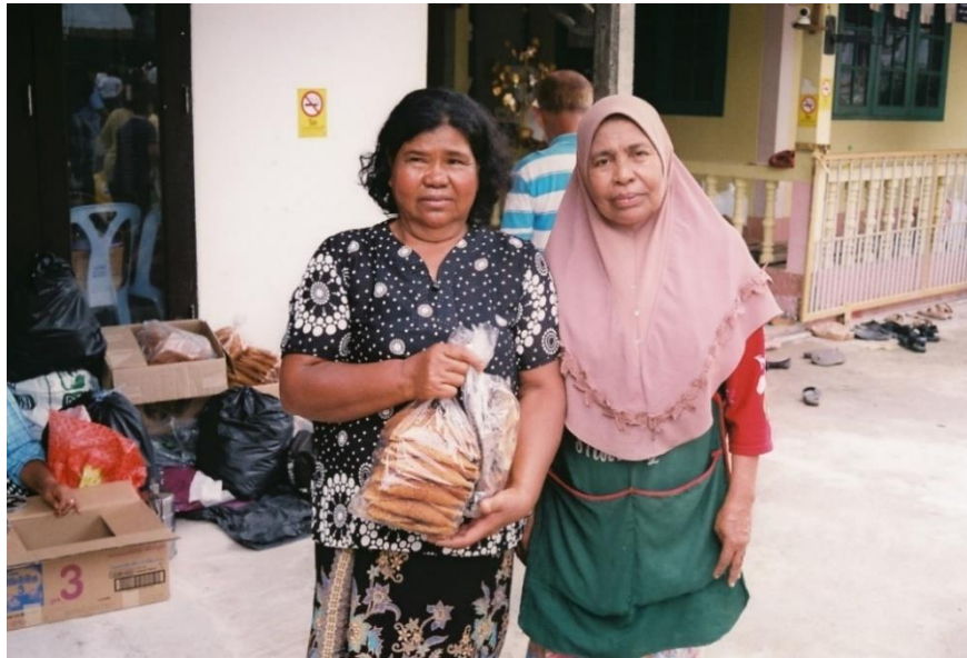
ภาพสตรีชาวอุรุกรลาไวยและสตรีชาวมลายูมุสลิมนำของมาแลกที่วัดธรรมมาวุธธรรมาราม เมื่อวันที่ 17 กันยายน 2563