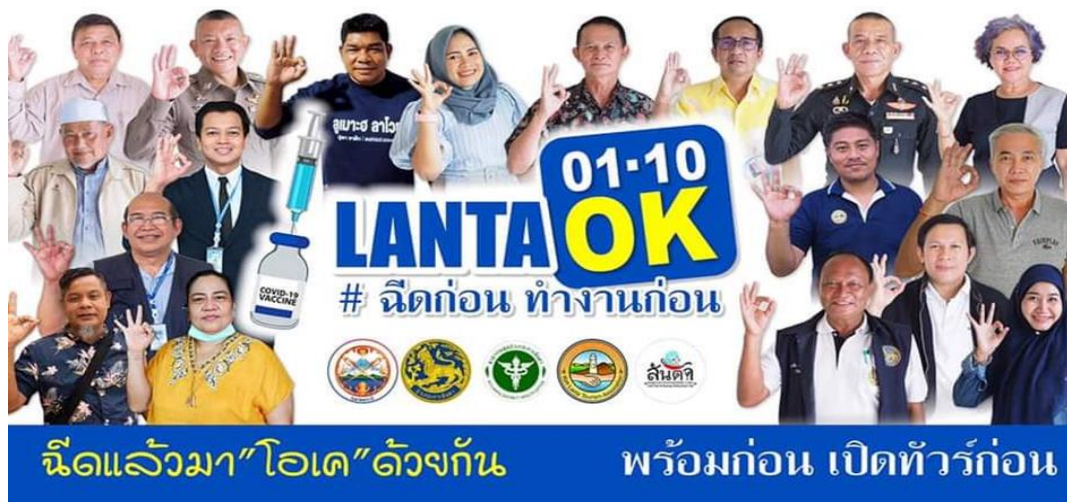
รูปภาพ ตัวแทนชาวอุรักลาโว้ย และชาวเกาะลันตาในทุกภาคส่วน ร่วมรณรงค์ให้ชาวเกาะลันตาเข้ารับการฉีดวัคซีน โควิด-19

“สมาคมธุรกิจการท่องเที่ยวเกาะลันตาได้ออกรณรงค์ผ่านสไลด์แกนลันตา OK 01-10 #ฉีดก่อนทำงานก่อน เพื่อเตรียมความพร้อมในการต้อนรับกลุ่มนักท่องเที่ยวต่างชาติในวันที่ 1 ตุลาคม 2564 ที่จะถึงนี้ในโครงการ Andaman Sandbox ทางสมาคมจึงตั้งเป้าหมายให้เกิน 70% ของคนในเกาะต้องได้รับการฉีดวัคซีนให้ได้มากที่สุด โดยเฉพาะประชากรในกลุ่มพื้นที่เกาะลันตาใหญ่และเกาะลันตาน้อยที่เป็นพื้นที่การท่องเที่ยวภายในเกาะ ซึ่งตอนนี้เราเดินทางมามากกว่า 50% แม้จะไม่มีนักท่องเที่ยวในตอนนี้ แต่การระบาดก็มาได้ เราต้องรับมือและควบคุมตามมาตรการการควบคุมโรคของจ.กระบี่ อยู่ตลอดเวลา”