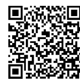
“หลักไชย ฉบับวัดสำโรง จ.นครปฐม ในฐานข้อมูลเอกสารโบราณภูมิภาคตะวันตกในประเทศไทย”

ฐานข้อมูลเอกสารโบราณ ภูมิภาคตะวันตกในประเทศไทย ศูนย์มานุษยวิทยาสิรินธร (องค์การมหาชน)