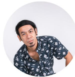
กราฟิก วิสูตร สิงห์โส