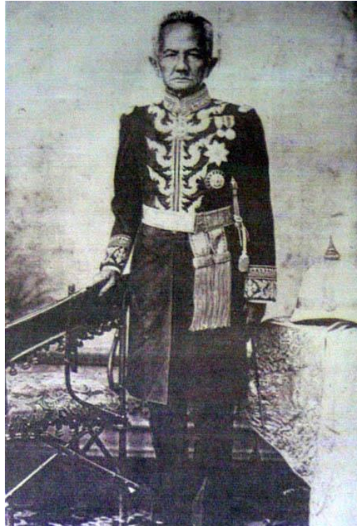
ภาพที่ 1 เจ้าหลวงพิริยเทพวงษ์ เจ้าหลวงองค์สุดท้ายของเมืองแพร่

การ “ปลด” เนื่องด้วยละเลย หนีราชการ แต่ไม่ได้กล่าวถึงการมีส่วนร่วมในการก่อการ “กบฏ” ครั้งนี้แต่อย่างใด ทำให้ละเลย ลดทอน ภาพกบฏลงไปได้อย่างมาก