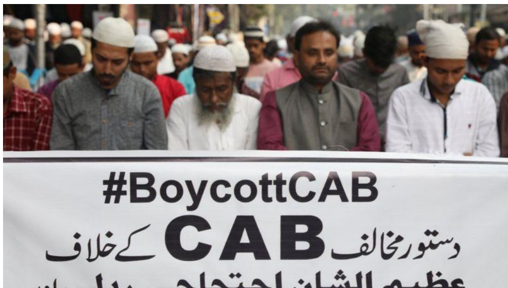
ผู้ประท้วงชาวมุสลิมในเมืองกัลกัตตา ได้ออกมาละหมาดโดยมีป้ายข้อความประท้วงอยู่ข้างหน้า

Crush and Ramachandran (2010) ตั้งข้อสังเกตว่า การศึกษาส่วนใหญ่ที่อธิบายความเกลียดคนต่างชาตินักจะใช้ตัวอย่างจากประเทศร่ำรวยในสังคมตะวันตก ยังมีการศึกษาน้อยที่จะทำความเข้าใจประเทศยากจนที่มีคนต่างชาตินักที่ร่ำรวยจากตะวันตกเข้าไปอยู่อาศัย และได้ประโยชน์ในประเทศเหล่านั้น รวมทั้งประสบการณ์ของแรงงานต่างด้าวที่เข้าไปทำงานในประเทศกำลังพัฒนาในเอเชียและลาตินอเมริกา การศึกษาความเกลียดคนต่างชาตินักที่เกิดในประเทศนอกตะวันตกจึงอาจให้แง่มุมที่ต่างไป ตัวอย่างเช่น รัฐบาลอินเดียมีนโยบายต่อต้านและกีดกันผู้อพยพชาวมุสลิมจากประเทศเพื่อนบ้าน (Ramachandran, 2019) ในปี ค.ศ. 2016 ชาวต่างชาติในประเทศแซมเบียถูกเผาทั้งเป็นโดยชาวบ้านที่รู้สึกเกลียดคนต่างชาตินัก และนำไปสู่การจลาจลที่คนในประเทศออกมาทำลายร้านค้าของชาวต่างชาติ (Tonga, 2017) เหตุการณ์เหล่านี้ทำให้เห็นว่าความเกลียดคนต่างชาตินักมีเงื่อนไขที่ซับซ้อน มิได้เป็นเพียงการกีดกันที่ชาวตะวันตกมีต่อคนเชื้อชาติอื่นเท่านั้น