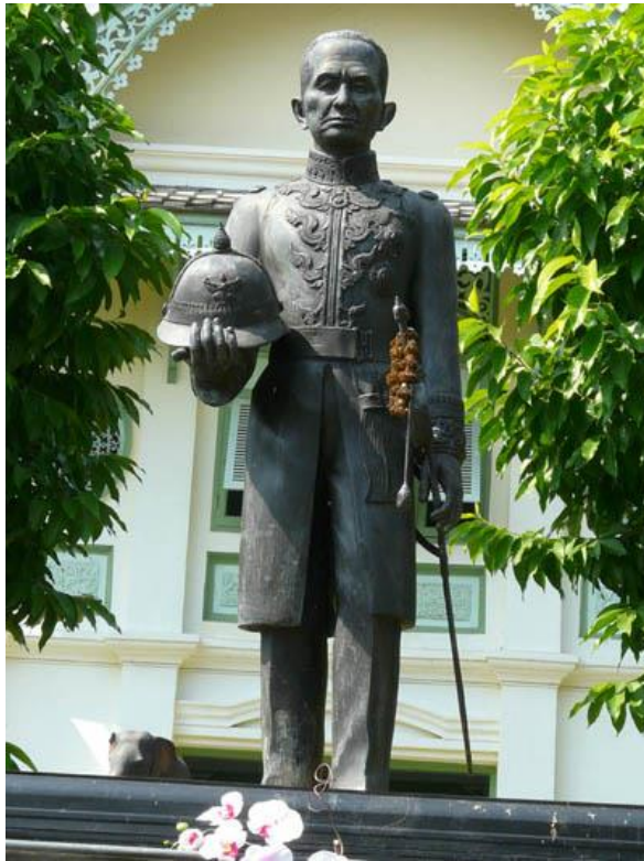
ภาพที่ 2 ‘อวตาร’ เจ้าหลวงพริยเทพวงษ์ เจ้าหลวงองค์สุดท้ายของเมืองแพร่

ชาติ ซึ่งครอบงำความคิดของคนอย่างลึกซึ้งอยู่แล้ว (ดูเพิ่มใน ประวัติศาสตร์–การสร้างประวัติศาสตร์ชาตินิยม ท้องถิ่นนิยม ท้องถิ่นชาตินิยม และ ประวัติศาสตร์ท้องถิ่นชาตินิยม: พิธีกรรมกบฏเงี้ยวเมืองแพร่ (พ.ศ.2445))