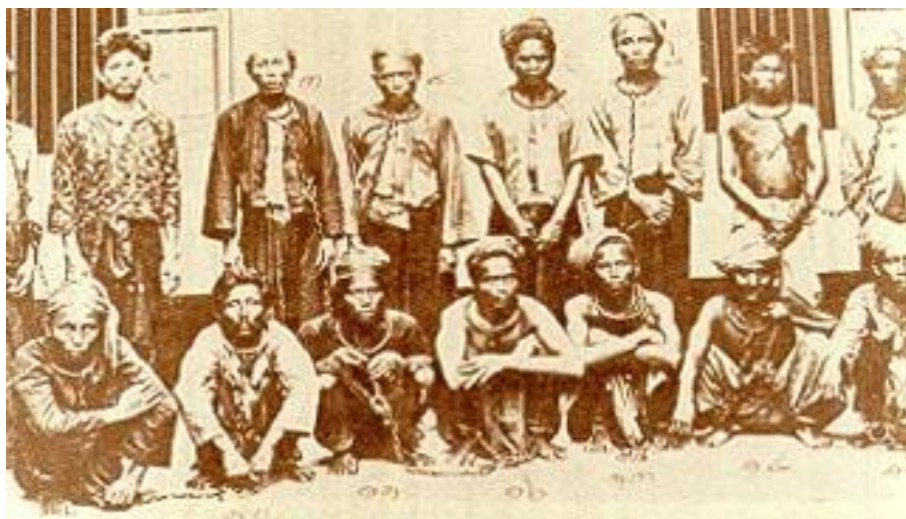
ภาพที่ 1 กบฏเงี้ยวที่ถูกจับในปี พ.ศ. 2445

ยังมีการสร้างคำอธิบายว่าก่อนที่จะเกิดกบฏ เจ้าพิริยเทพวงศ์ และชายาเป็นที่ โปรดปรานของรัชกาลที่ 5 เป็นอย่างมาก และได้รับโปรดเกล้าฯ ให้เข้าเฝ้าอยู่เสมอ “...ในสมัย รัชกาลที่ 5 เจ้าหลวงเมืองแพร่นั้นเป็นผู้ที่รัชกาลที่ 5 ทรงรักและไว้วางใจมาก โดยเฉพาะกับกรม หลวงดำรงราชานุภาพ...ก็ทรงชอบพอกับเจ้าหลวงฯ ทั้งพ่อ ทั้งเพื่อน ทั้งพี่ กรมหลวงดำรงรา ชานุภาพฯ ได้ทรงอบรมสั่งสอนเจ้าหลวงฯ ทุกอย่าง...” ๗ เพื่อสร้างโครงเรื่องให้ตอบรับการ เหตุการณ์ข้างต้น