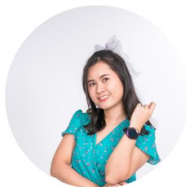
ผู้เขียน