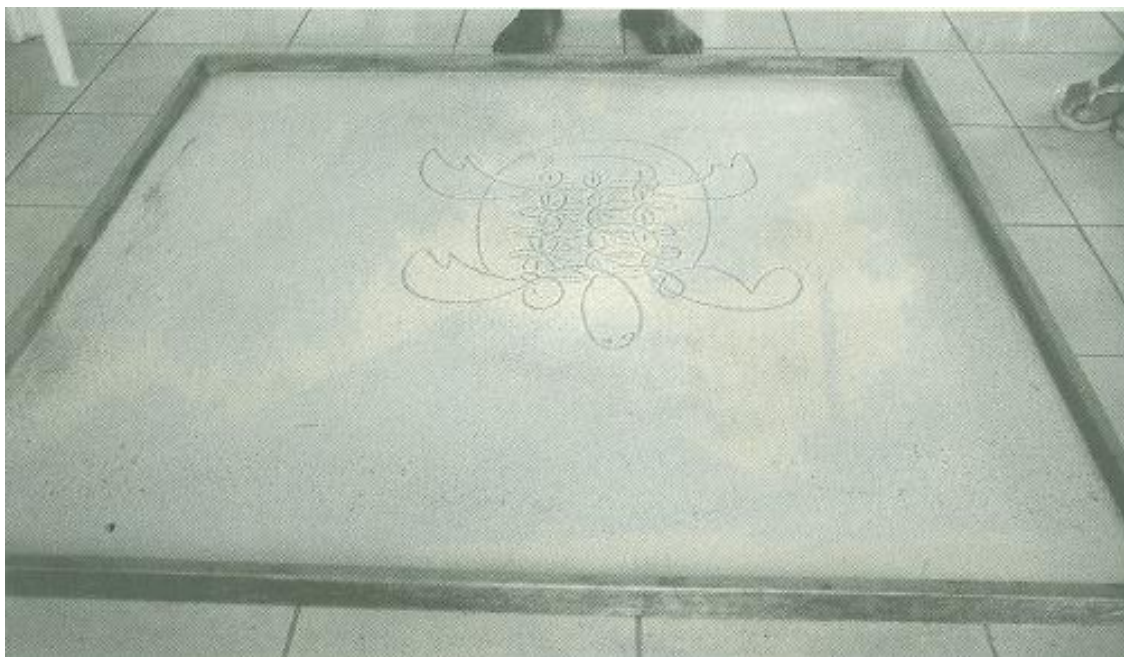
การจัดแสดงแบบมีปฏิสัมพันธ์ที่ใช้ในงานเขียนทรายในพิพิธภัณฑ์สถานแห่งชาติ (จาก หนังสือมรดกวัฒนธรรมที่ไม่เป็นกายภาพกับพิพิธภัณฑ์: มุมมองใหม่ในการอนุรักษ์ทางวัฒนธรรม หน้า 108)

นอกจากภาพเขียนทรายแล้ว ยังมีสิ่งอื่นๆ ที่น่าสนใจได้แก่ รถม้า และธงชาติของนิว เฮบริดีส์ (New Hebrides) ซึ่งประกอบด้วยธงชาติอังกฤษและฝรั่งเศส วัตถุเหล่านี้เป็นตัวแทนยุคอาณานิคมในประวัติศาสตร์ของวานูอาตู รวมไปถึงวัตถุที่พบจากการขุดค้นทางโบราณคดี เช่น เครื่องปั้นดินเผา เครื่องใช้จากหลุมฝังศพของหัวหน้าเผ่า ที่คาดว่าน่าจะเป็นหัวหน้าเผ่า โรอิ มาตา (Chief Roi Mata) ที่ถูกค้นพบโดยนักโบราณคดีชาวฝรั่งเศส นอกจากวัตถุทางโบราณคดีแล้ว ยังมีวัตถุทางชาติพันธุ์วรรณา วัตถุทางพิธีกรรม วัตถุทางประวัติศาสตร์ธรรมชาติ รวมถึงภาพถ่ายและโปสเตอร์กิจกรรมต่างๆ ของ VCC อีกมากมาย ซึ่งทั้งหมดที่นำมาจัดแสดงนั้น ล้วนสะท้อนความหมายของธรรมเนียมปฏิบัติและความสัมพันธ์ของผู้คนกับสิ่งของต่างๆ เหล่านี้ได้เป็นอย่างดี แสดงให้เห็นว่า มรดกทางวัฒนธรรมที่เป็นกายภาพหรือจับต้องได้ และมรดกทางวัฒนธรรมที่ไม่เป็นกายภาพหรือจับต้องไม่ได้นั้น ไม่สามารถแยกออกจากกันได้อย่างชัดเจน