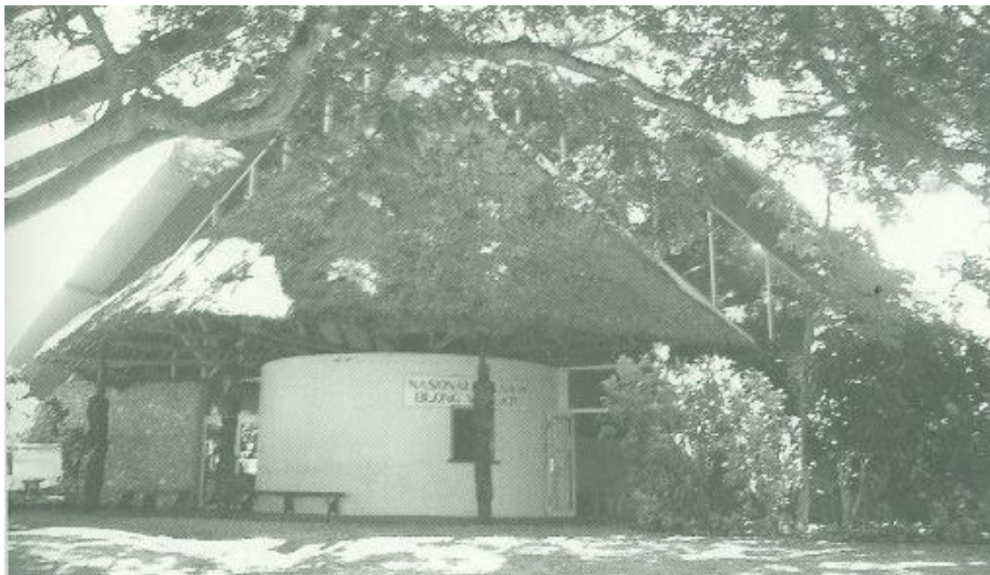
ศูนย์วัฒนธรรมวานูอาตู

ของเกาะเมลานีเซียน รัฐวานูอาตู ซึ่งปัจจุบันไม่เพียงแต่ทำหน้าที่พิพิธภัณฑ์ อนุสาวรีย์และ จัดนิทรรศการเท่านั้น แต่ยังมีหน้าที่ด้านการทำวิจัยระดับนานาชาติและการพัฒนาชุมชนอีกด้วย