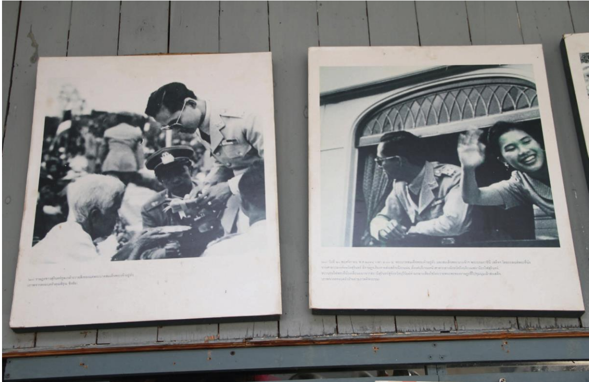
ภาพซ้าย : ทั้งสองพระองค์เยี่ยมพลกนิกร ณ บริเวณหน้าศาลากลางจังหวัดสุรินทร์ ภาพขวา : ทรงโบกพระหัตถ์ แด่พลกนิกร เมื่อขบวนรถไฟผ่านสถานีรถไฟศรีนครินทร์

กลุ่มภาพที่สำคัญๆ เช่น กลุ่มภาพที่พระบาทสมเด็จพระปรมินทรมหาภูมิพลอดุลยเดช และ สมเด็จพระนางเจ้าสิริกิติ์ พระบรมราชินีนาถ พระบรมราชชนนีพันปีหลวง เสด็จฯ จังหวัดสุรินทร์ เมื่อวันที่ 19-20 พฤศจิกายน 2498 โดยรถไฟพระที่นั่งจากจังหวัดอุบลราชธานี ถึง นครราชสีมา คุณอักษางค์ เล่าต่อมาจากคำบอกเล่าของคนเฒ่าคนแก่ว่า การเสด็จฯ เยี่ยมพลกนิกรในพื้นที่ภาคอีสานของทั้งสองพระองค์ในครั้งนั้น นับว่าเป็นเหตุการณ์หนึ่งที่พลิกฟ้าคว่ำแผ่นดิน ด้วยว่าไม่เคยมี กษัตริย์พระองค์ใดเสด็จฯ ในพื้นที่ภาคอีสาน ในครั้งนั้นได้ก่อให้เกิดความรัก ศรัทธา และหลาย ครอบครัวล้มต้อปากค้าขายจนมีฐานะได้ พลกนิกรทั้งที่อยู่ใกล้ไกล ต่างเดินทางมารอรับเสด็จฯ กันอย่างเนืองแน่น ข้าวปลาอาหารที่มีคนทำขาย ทำเท่าไรก็ขายหมด