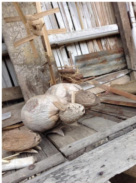
ของเล่นงานไม้