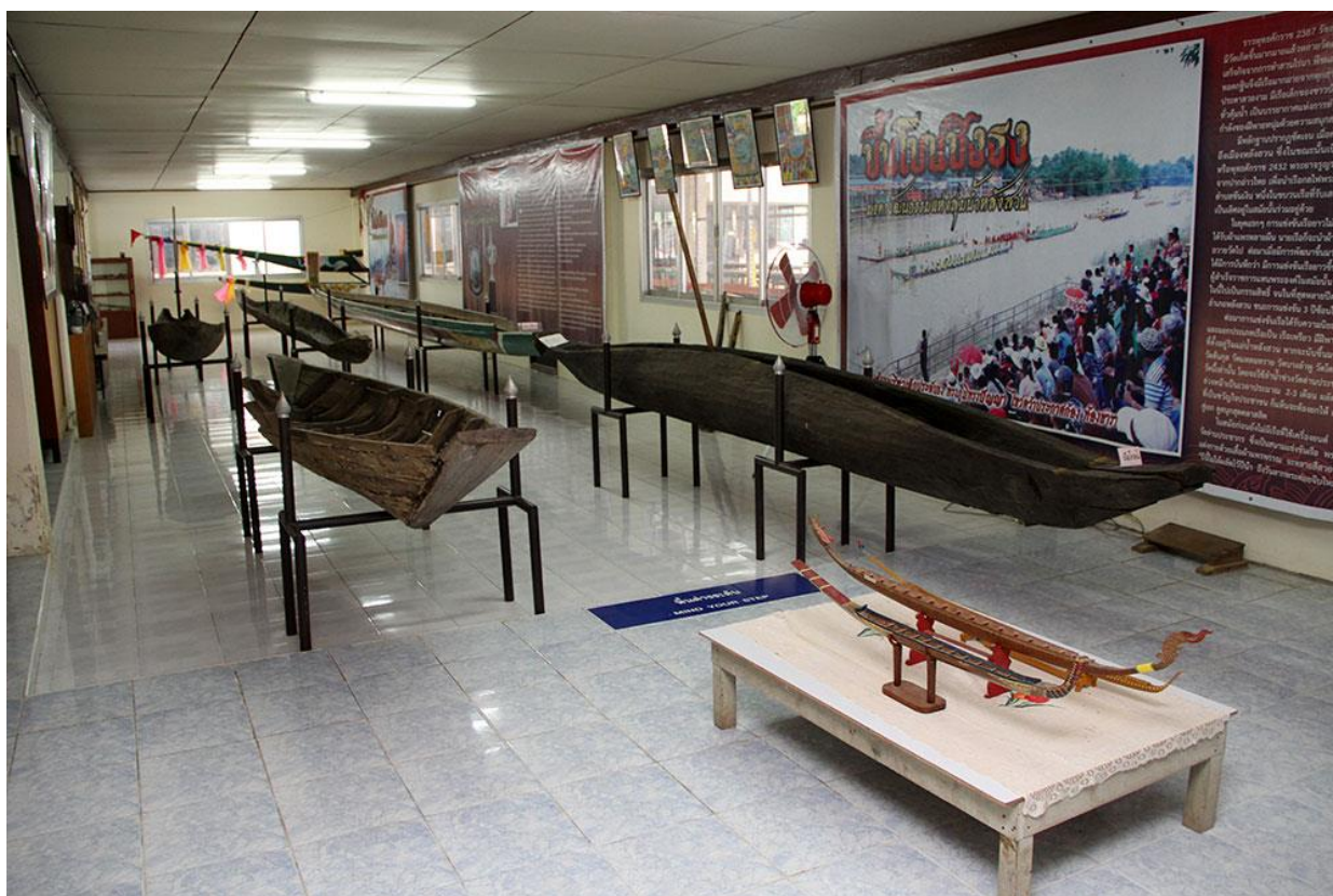
พิพิธภัณฑ์ภูมิปัญญาชาวบ้าน โรงเรียนสวนศรีวิทยา

เรียนรู้ถึงการแข่งเรือ และเรือแข่งของชาวหลังสวน พิพิธภัณฑ์แห่งนี้ก็เป็นแหล่งเรียนรู้ที่สำคัญอีกแห่งหนึ่ง 1