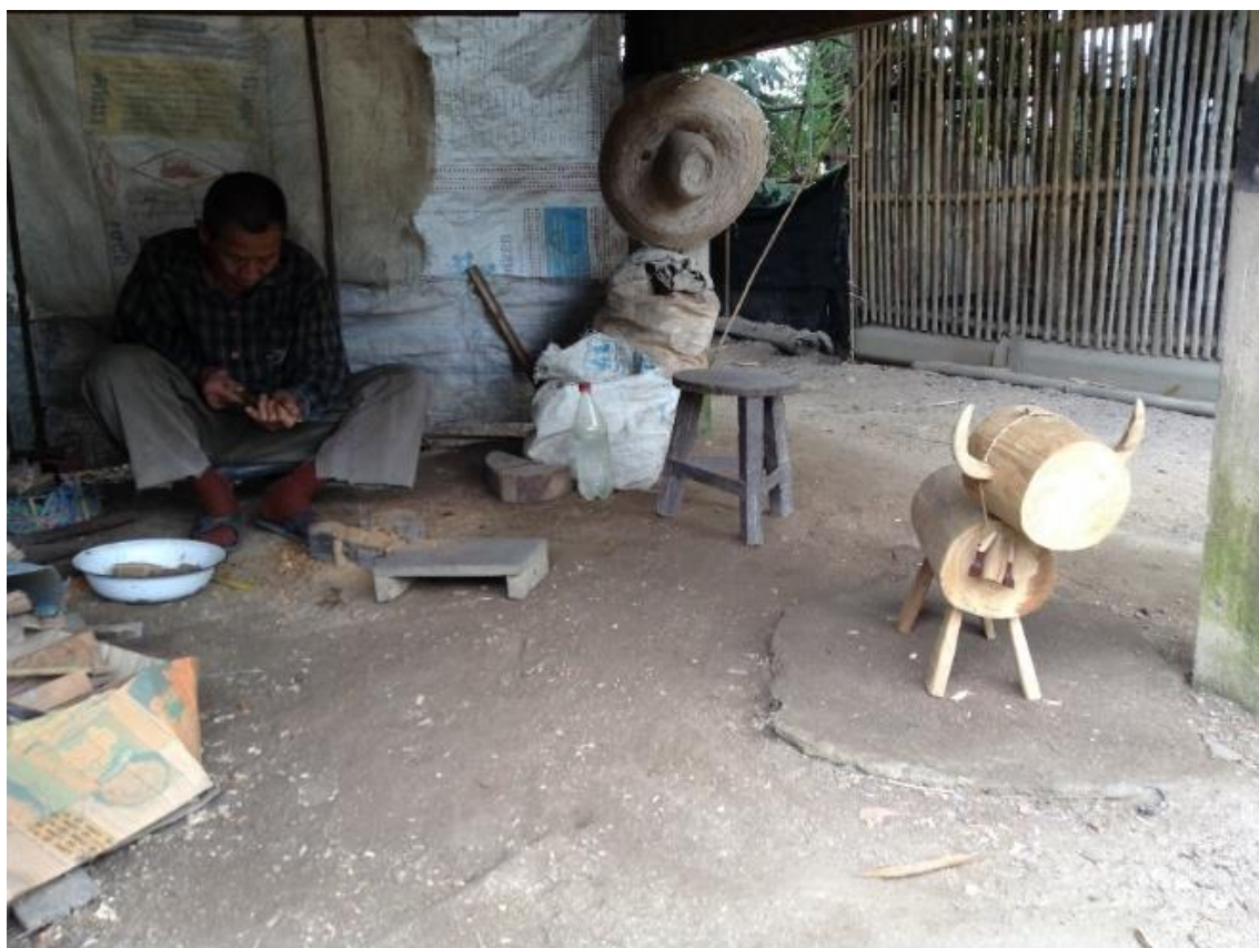
พ่ออุ๊ยสาธิตทำของเล่น