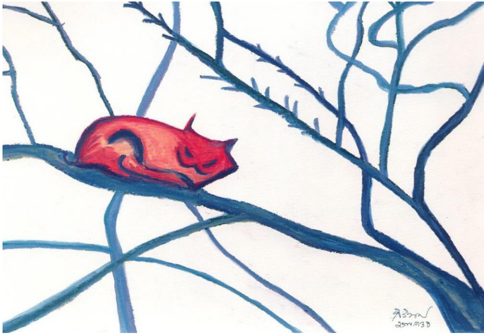
ภาพจากหนังสือ ทอสีเทียบฝัน

ชื่อภาพ: แมวที่เมืองอัสตราคาน ปี: 2538 เทคนิค: สีเทียน