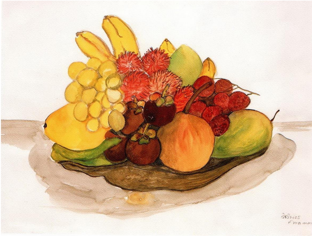
ภาพจากหนังสือ ทอสีเทียบฝัน

ชื่อภาพ: ถาดผลไม้ ปี: 2533 เทคนิค: สีน้ำ