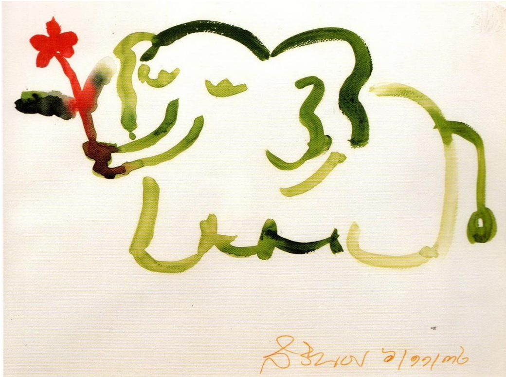
ภาพจากหนังสือ ทอสีเทียบฝัน

วาดข้างด้วย และในที่สุดทรงใช้รูปข้างเป็นตัวแทนของพระองค์ นอกจากนี้พระองค์ก็ทรงวาดภาพ ในลักษณะการ์ตูนเนื่องในโอกาสเสด็จพระราชดำเนินไปในงานต่างๆ