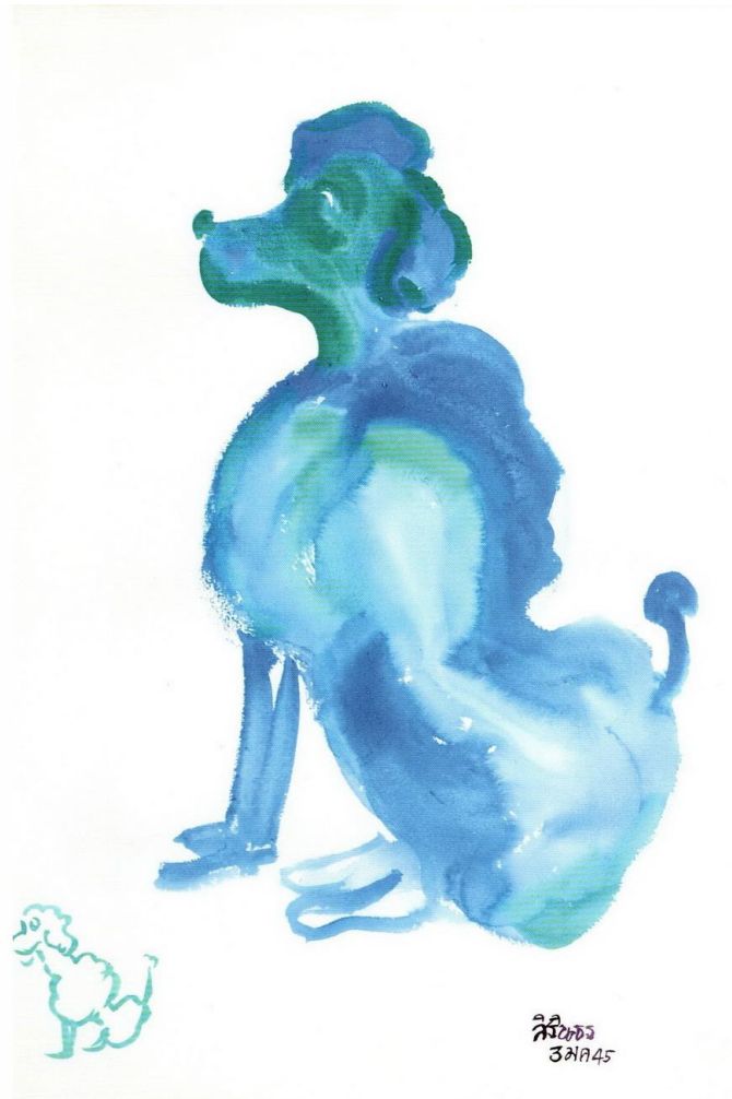
ภาพจากหนังสือ

นิทรรศการเฉลิมพระเกียรติ สมเด็จพระเทพรัตนราชสุดาฯ สยามบรมราชกุมารีกับงานศิลปะและวัฒนธรรม