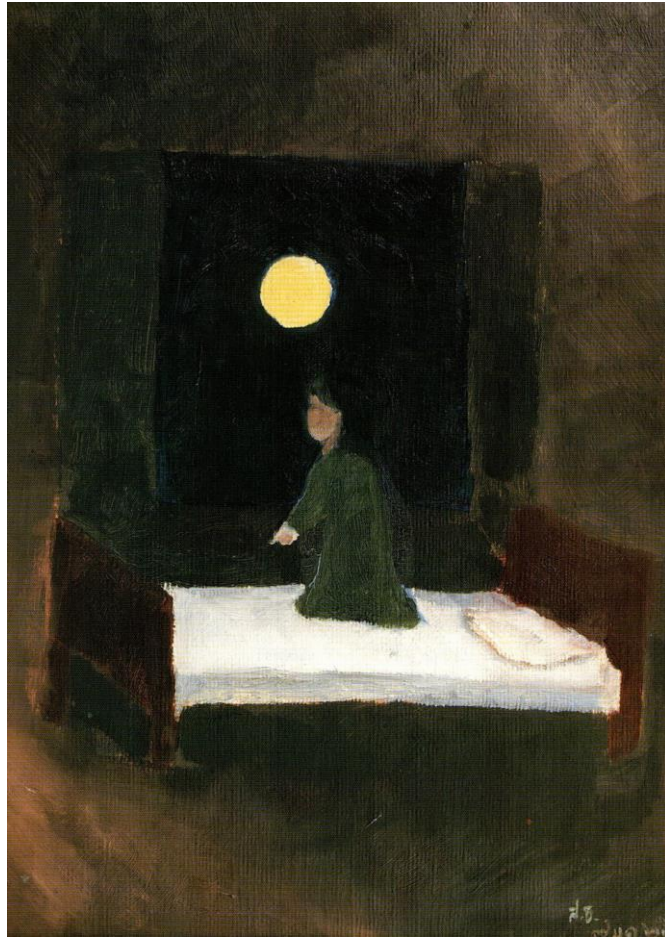
ภาพจากหนังสือ ทอสีเทียบฝัน

ชื่อภาพ: แลจันทร์ ปี: 2526 เทคนิค: สีน้ำมัน