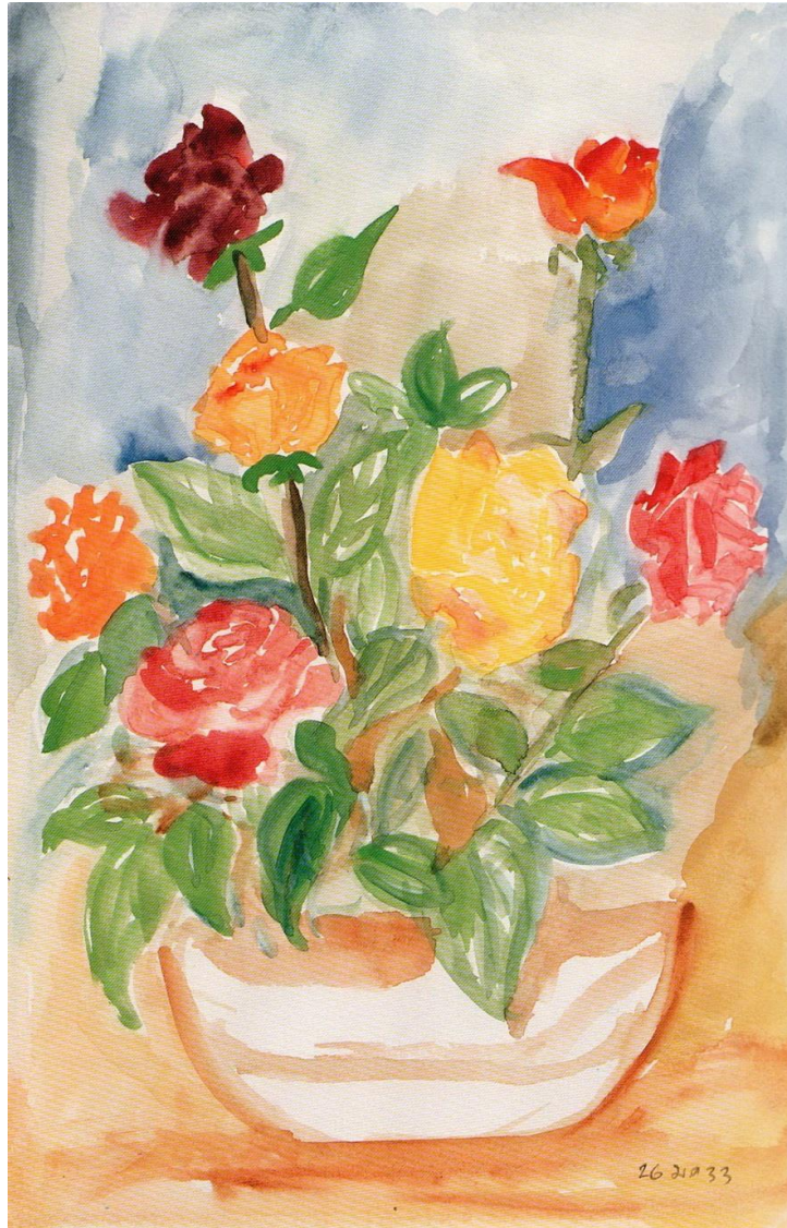
ภาพจากหนังสือ ทอสีเทียบฝัน

ชื่อภาพ: ดอกกุหลาบ 2 ปี: 2533 เทคนิค: สีน้ำ