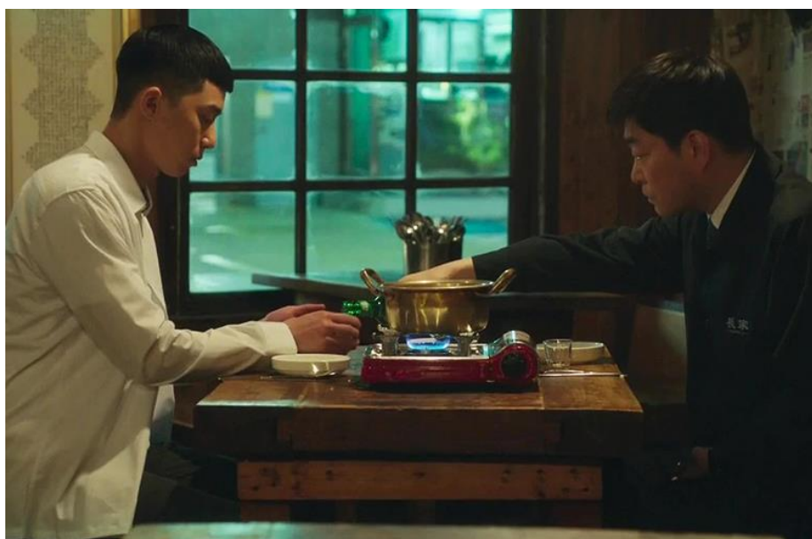
ฉากนำประทับใจใน Itaewon Class ที่พ่อสอนลูกถึงมารยาททางสังคมในการดื่มโซจู

ซีรีส์เกาหลีใต้เรื่อง “ธุรกิจ ปิดเกมแค่น” (Itaewon Class) มีฉากที่พัคซองยอล (แสดงโดย ชนฮยอนจู) สอนวิธีการรินและดื่มโซจูให้พัคแฮรอย (แสดงโดย พัคชอจุน) ผู้เป็นลูกชายวัยรุ่นุ่นว่ามารยาทการรินและดื่มโซจูต่อหน้าผู้อาวุโสกว่าต้องทำอะไรบ้าง