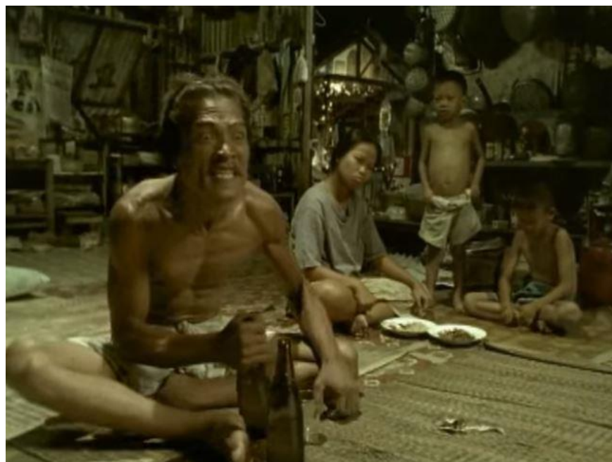
Screenshot จากภาพยนตร์โฆษณาในแคมเปญ "จน เครียด กินเหล้า" ที่ยังติดหูติดตามมาจนปัจจุบัน