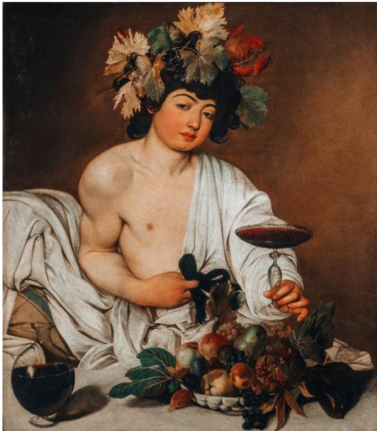
ไดโอนีซุส (แบคคัส) ในจินตนาการของ Caravaggio (ค.ศ. 1571-1610) ศิลปินชาวอิตาลี

“เหล้า” หรือ “สุรา” เป็นเครื่องดื่มที่ผูกพันกับมนุษยชาติมายาวนาน ในการประกอบพิธีกรรม เหล้าเป็นส่วนหนึ่งของเครื่องเซ่น ในฟากฝั่งโลกตะวันตก ภาพที่เราคุ้นตาคือคริสต์ศาสนิกชนจะดื่มเหล้าองุ่นอันเป็นเสมือนโลหิตของพระเยซูในพิธีมิสซาเพื่อความเป็นหนึ่งเดียวกับพระเจ้า นอกจากนี้ เทพปกรณัมกรีกยังกล่าวถึงไดโอนีซุส (Dionysus) หรือแบคคัส (Bacchus) ของชาวโรมันว่าเป็นเทพแห่งองุ่นและเหล้าองุ่น ทั้งยังเป็นเทพแห่งความรื่นเริงบันเทิงใจด้วย ว่ากันว่าตำแหน่งที่แถมพ่วงมาด้วยนี้ก็เป็นผลจากฤทธิ์ของเหล้าองุ่นนั่นเอง