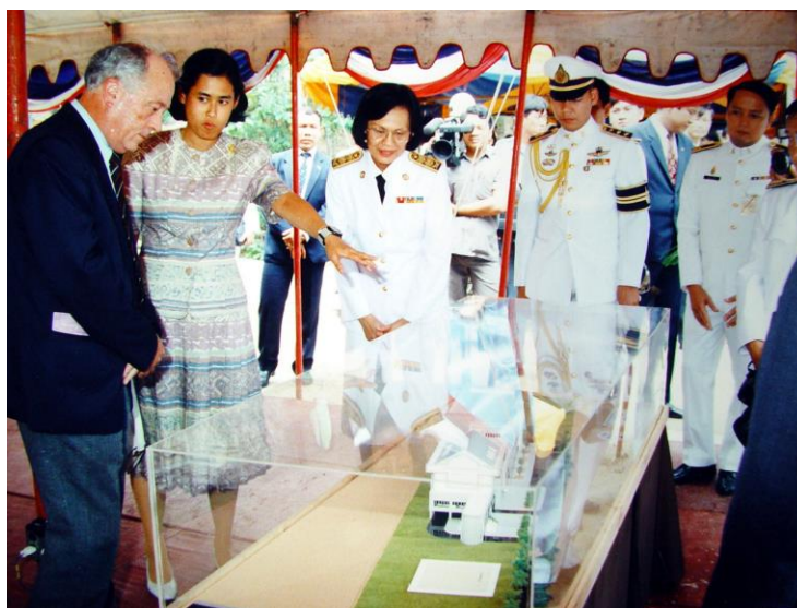
พิธีวางศิลาฤกษ์อาคารศูนย์มานุษยวิทยาสิรินธร วันศุกร์ที่ 7 มิถุนายน 2534