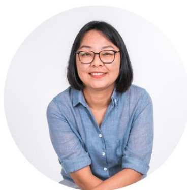
ผู้เขียน

1 ปรับปรุงจากบทความ “มานุษยวิทยาในมรรคาเจ้าฟ้าสิรินธร” ใน จดหมายข่าวศูนย์มานุษยวิทยาสิรินธร ปีที่ 17 ฉบับที่ 85 เมษายน-มิถุนายน 2558