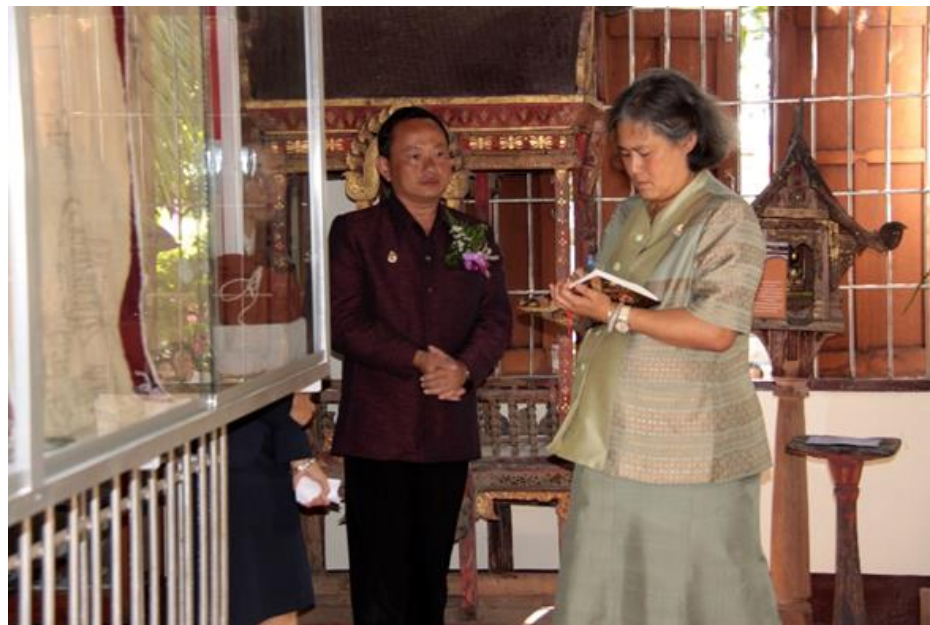
สมเด็จพระกนิษฐาธิราชเจ้า กรมสมเด็จพระเทพรัตนราชสุดาฯ สยามบรมราชกุมารี เสด็จไปเปิดพิพิธภัณฑ์ที่ วัดไหล่หินหลวง ต.ไหล่หิน อ.เกาะคา จ.ลำปาง เมื่อวันที่ 28 ตุลาคม 2552 ในขณะนั้นมี ดร.ปรีตตา เฉลิมเผ่า กอนันทกุล เป็นผู้อำนวยการศูนย์มานุษยวิทยาสิรินธร (องค์การมหาชน)