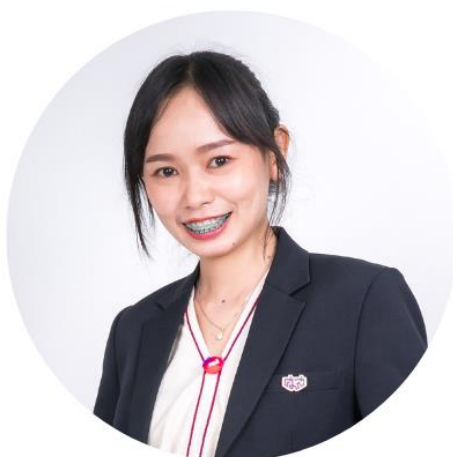
ผู้เขียน

ห้องสมุดสุข กาย ใจ วันจันทร์-ศุกร์ : 08.00-18.00 น. และวันเสาร์ : 09.00-17.00 น.