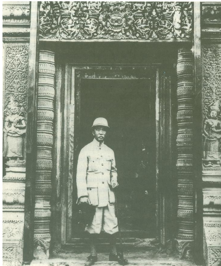
สมเด็จพระบรมวงศ์เธอ กรมพระยาดำรงราชานุภาพ ทรงนิพนธ์หนังสือ ไทยรบพม่า ตั้งแต่ปี 2460-2463 หนังสือเล่มนี้เป็นตัวอย่างสำคัญของลัทธิอุดมการณ์ทางประวัติศาสตร์ ที่ฝังรากลึกในสังคมไทย โดยเฉพาะอย่างยิ่งในความคิดของสังคมไทยที่มีต่อพม่า

“คนอื่น” กลุ่มสุดท้าย คือ ประเทศเพื่อนบ้านของไทย ในอดีตไทยไม่เคยมองประเทศรอบข้างเป็นกลุ่มก้อนเดียวกันในเชิงภูมิภาคเอเชียตะวันออกเฉียงใต้ ความสัมพันธ์ของไทยกับประเทศเพื่อนบ้านอยู่บนฐานของมุมมองที่ยึดตัวเองเป็นศูนย์กลาง และมองประเทศเพื่อนบ้านว่า หากไม่ใช่ศัตรูคู่แข่งกันทางอำนาจ ก็เป็นประเทศที่ด้อยกว่า ซึ่งเป็นความคิดที่ตกทอดมาจากยุคก่อนสมัยใหม่ และยังคงหลงเหลืออยู่ในปัจจุบัน