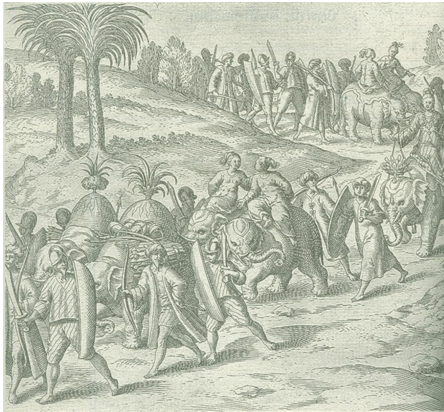
พระราชินีแห่งปัตตานี โดย เดอ บราย (Johann Theodore de Bry & Johann Israel de Bry) พิมพ์ที่แฟรงก์เฟิร์ต เยอรมนี เมื่อปี 1606 (พ.ศ. 2149) เป็นภาพพิมพ์ “ปัตตานี”เก่าแก่สุดที่พบขณะนี้

ด้วยหลักเกณฑ์นี้ทำให้แบ่ง “คนอื่น” ของความเป็นไทย ได้เป็น 4 กลุ่ม โดยมี 2 กลุ่ม เป็นกลุ่มคนที่อาศัยอยู่ในประเทศไทย ได้แก่ คนอื่นที่ถูกจัดแบ่งเป็นประเภทตามถิ่นฐาน แบ่งได้เป็นสองกลุ่มหลักๆ คือ “ชาวป่า” และ “ชาวบ้านนอก” โดยยึดจากกรุงเทพฯ เป็นหลัก ซึ่งคน 2 กลุ่มนี้มีถิ่นฐาน วิถีชีวิต ความเป็นอยู่ วัฒนธรรม ประเพณี และความเชื่อที่แตกต่างจากชาวกรุงเทพฯ ทำให้ถูกมองว่าเป็น “คนอื่น” แม้จะอาศัยอยู่ในประเทศไทยเหมือนกันก็ตาม และอีกกลุ่มหนึ่งที่อาศัยอยู่ในประเทศไทย แต่ก็ถูกมองว่าเป็น “คนอื่น” เช่นกัน คือ จังหวัดปัตตานี เนื่องจากมีความแตกต่างหลายอย่างซ้อนทับกัน ได้แก่ ภูมิรัฐศาสตร์ ชาติพันธุ์ ศาสนา และประวัติศาสตร์ ปัตตานีจึงเป็น “คนอื่น” และ “ความเป็นอื่น” ที่สุดของความเป็นไทย