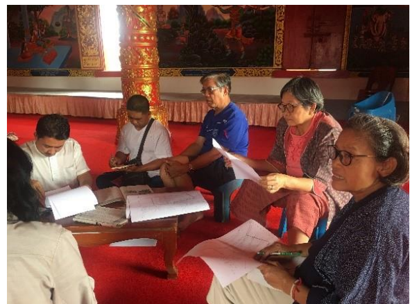
คณะผู้ดำเนินโครงการ