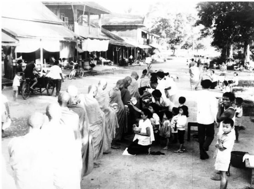
ชุมชนชาวจีน ตักบาตรถนนย่านการค้าริมโขง

โยนก) ที่มาอยู่ก่อนแล้ว มีอาชีพทำการเกษตร ทำไร่ทำนาเลี้ยงวัว เลี้ยงควาย ในซอยวัดปงสนุกแต่เดิม ถือว่าเป็นซอยที่มีวัว ควาย มากที่สุด สำหรับบ้านเวียงเหนือ ก็จะมีคนเมืองอาศัยอยู่ในซอยวัดผ้าขาวบ้านถึงวัดพุกพันตอง และริมทำนน้ำวัดผ้าขาวบ้านไปจนถึงกำแพงด้านทิศเหนือ และทิศใต้ถึงที่ว่าการอำเภอ คนพื้นเมืองในซอยวัดผ้าขาวบ้านส่วนหนึ่งมาอยู่ก่อน 2440 และเป็นลูกหลานของตระกูลเชื้อเจ็ดตนที่อพยพมาสร้างบ้านแปงเมืองในสมัยรัชกาลที่ 5 (ข้อมูลจาก ชุดข้อมูลที่ 8 ย่านการค้าชุมชนของชาวจีน เมื่อวันวาน รายงานรายงานผลฉบับสมบูรณ์ โครงการการจัดการข้อมูลประวัติศาสตร์ สังคม และวัฒนธรรม เมืองเชียงใหม่ ระยะที่ 1 2562)