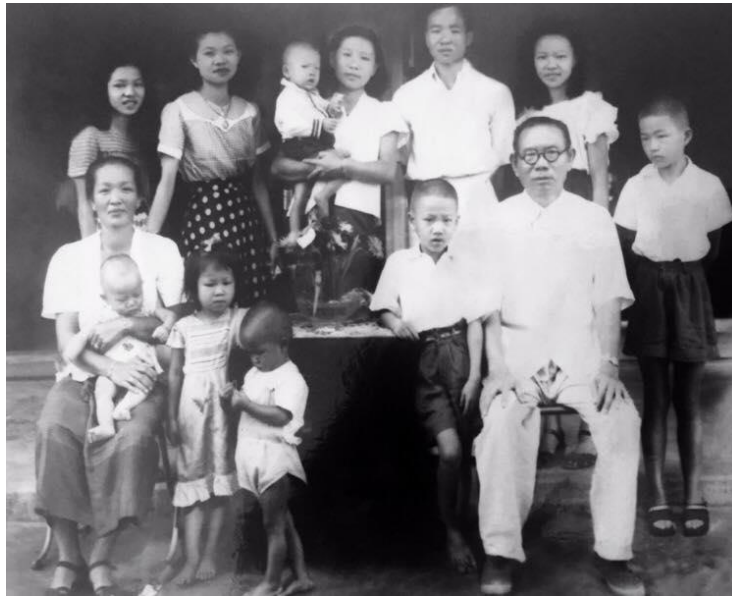
ครอบครัวอาม่าอินกับเตี้ยยง คู่สุวรรณ พ่อค้าในเชียงใหม่