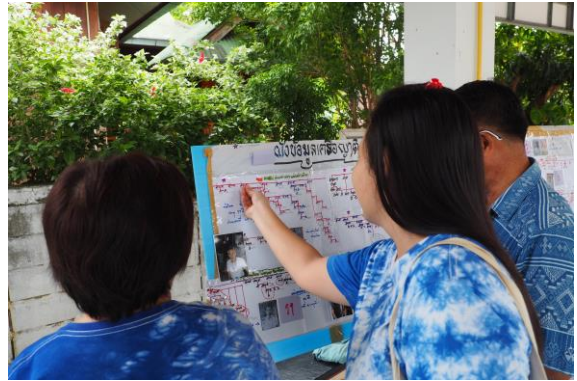
ภาพผังเครือญาติตระกูลอ่อนน้อม