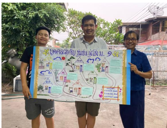
ภาพการจัดทำประวัติบุคคลสำคัญ

ประวัติบุคคลสำคัญ ทำการคัดเลือกบุคคลสำคัญในชุมชน ที่มีประสบการณ์ ความรู้ความสามารถ เป็นที่ยอมรับ จำนวน 8 คน โดยทีมเก็บรวบรวมข้อมูลได้ลงพื้นที่สัมภาษณ์ บันทึกข้อมูล แล้วนำข้อมูลที่ได้มา เรียบเรียง และจัดเตรียมนำเสนอในเวทีระดมความคิดเห็นระดับชุมชน ซึ่งผลจากการลงพื้นที่เก็บข้อมูลทำให้เกิดการแลกเปลี่ยนเรียนรู้ระหว่างกันเองในชุมชนมากขึ้น การได้พูดคุย สัมภาษณ์ สอบถาม ทำให้คนในชุมชน ได้สร้างความสัมพันธ์อันดีระหว่างบุคคล เกิดความสนใจ รับรู้ รับทราบ ข้อมูลบุคคลในชุมชนของตนเองมากขึ้น เป็นการเชิดชู สร้างกำลังใจ และสร้างคุณค่าในตัวของบุคคลสำคัญในชุมชน