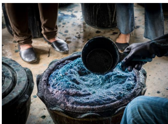
ภาพการย้อมสีหม้อห้อม

ผู้ประกอบการหม้อห้อม เป็นอาชีพที่มีความสำคัญสร้างรายได้ให้กับชาวไทยพวนบ้านทุ่งโฮ้งเป็นอย่างมาก เนื่องจากเป็นแหล่งผลิต ตัดเย็บ ออกแบบ จำหน่าย และเป็นแหล่งเรียนรู้การทำผ้าหม้อห้อมที่สำคัญของจังหวัดแพร่ รวมทั้งเป็นจุดหมายปลายทางที่นักท่องเที่ยวทุกเพศทุกวัยให้ความสนใจ ในการเก็บรวบรวมข้อมูลได้แบ่งออกเป็น 2 กลุ่ม คือ กลุ่มร้านค้าทั่วไป ที่มีการผลิต การตัดเย็บ การย้อมสี และการจำหน่าย และกลุ่มร้านค้าดั้งเดิมที่มีภูมิปัญญาการสืบทอดทางวัฒนธรรมและเรื่องราวที่เกี่ยวข้องกับวิถีชีวิต ความเป็นอยู่ ซึ่งได้ทำการรวบรวมข้อมูลจากการจัดทำแบบสอบถามข้อมูลร้านค้าหม้อห้อม การลงพื้นที่สัมภาษณ์เพื่อเก็บข้อมูลด้านการผลิต และการจำหน่ายผ้าหม้อห้อม นอกจากนี้ยังพบว่า คนรุ่นใหม่สนใจกลับมาสืบทอดกิจการมากขึ้น มีการประยุกต์ ออกแบบเครื่องแต่งกายและสินค้าให้มีความทันสมัย สอดคล้องกับวิถีชีวิต ภูมิปัญญา และเป็นมิตรกับสิ่งแวดล้อม ซึ่งมีร้านค้าที่ให้ความร่วมมือในการเก็บรวบรวมข้อมูล จำนวน 50 ร้าน