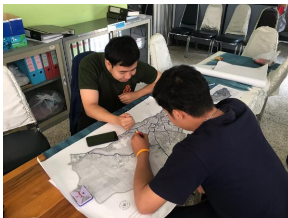
ภาพ การจัดทำแผนที่ชุมชน

ที่ตั้งอยู่ ณ จุดใดบ้าง และข้อมูลความสัมพันธ์ของคนในชุมชน การได้พูดคุย สอบถาม แลกเปลี่ยนเรียนรู้ระหว่างกันเองในชุมชน ทำให้ชุมชนหันกลับมาสนใจข้อมูลในพื้นที่ของตนเองว่ามีความสำคัญ