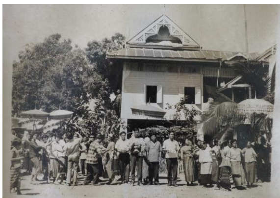
ภาพประเพณีปอยบวชพระ

ประวัติบุคคลสำคัญ ทำการคัดเลือกบุคคลสำคัญในชุมชน ที่มีประสบการณ์ ความรู้ความสามารถ เป็นที่ยอมรับ จำนวน 8 คน โดยทีมเก็บรวบรวมข้อมูลได้ลงพื้นที่สัมภาษณ์ บันทึกข้อมูล แล้วนำข้อมูลที่ได้มา เรียบเรียง และจัดเตรียมนำเสนอในเวทีระดมความคิดเห็นระดับชุมชน ซึ่งผลจากการลงพื้นที่เก็บข้อมูลทำให้เกิดการแลกเปลี่ยนเรียนรู้ระหว่างกันเองในชุมชนมากขึ้น การได้พูดคุย สัมภาษณ์ สอบถาม ทำให้คนในชุมชน ได้สร้างความสัมพันธ์อันดีระหว่างบุคคล เกิดความสนใจ รับรู้ รับทราบ ข้อมูลบุคคลในชุมชนของตนเองมากขึ้น เป็นการเชิดชู สร้างกำลังใจ และสร้างคุณค่าในตัวของบุคคลสำคัญในชุมชน