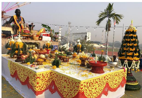
ภาพบวงสรวงเจ้าชมพูงานประเพณีกำฟ้า

ของชาวพวน ชุมวิถีสืบทอดการทำผ้าหม้อห้อม ชุมความเชื่อและพิธีกรรม เป็นต้น ซึ่งเป็นการแสดงถึงภูมิปัญญาของบรรพชนชาวไทยพวนที่แฝงไว้ด้วยคุณค่าแห่งความกตัญญูกตเวทีก การสร้างขวัญกำลังใจ ความสามานสามัคคีในหมู่คณะให้มีความเชื่อถือศรัทธาในพิธีกรรมบูชาฟ้า เป็นศูนย์รวมแห่งจิตใจ ทำให้ชาวไทยพวนบ้านทุ่งโฮ้งมีวัฒนธรรมอันเข้มแข็งยากที่วัฒนธรรมอื่นจะเข้าครอบงำได้ เป็นการสร้างความภาคภูมิใจในการแสดงอัตลักษณ์ของความเป็นไทยพวน สร้างสำนึกร่วมในการเป็นส่วนหนึ่งของการอนุรักษ์ ฟื้นฟูวัฒนธรรม