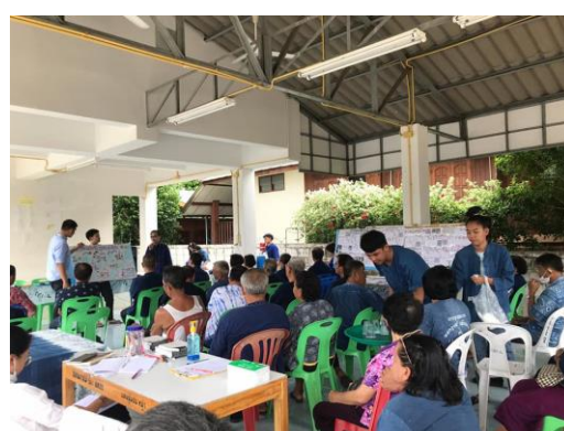
ภาพเวทีระดมความคิดเห็น

การศึกษาโดยวิธีการค้นหาศักยภาพของชุมชน ด้วยการให้ชุมชนได้เข้ามามีส่วนร่วมในกระบวนการทำงานทั้งกลุ่มเยาวชน วิทยากร และผู้สูงอายุ จะช่วยให้เกิดพลังการเรียนรู้จากการร่วมคิด ร่วมวางแผน ร่วมปฏิบัติ ร่วมแก้ปัญหา ร่วมรับผล เกิดการเรียนรู้จากการปฏิบัติ มีความคิดสร้างสรรค์ และโอกาสได้เรียนรู้เรื่องราวชีวิตของผู้คนในชุมชนของตนเอง แบ่งปันข้อมูล ถ่ายทอดความรู้ ทำงานร่วมกัน รับผิดชอบหน้าที่ด้วยความสนุกสนาน เกิดความภาคภูมิใจอย่างมีความหมาย มีเรื่องเล่าจากทีมเก็บข้อมูลในชุมชนว่า “ตอนนี้เห็นหน้ากันคุยแต่เรื่องคลังข้อมูลชุมชนว่าเราจะต้องรวบรวมข้อมูลอะไรเพิ่มเติมกันอีกนะ”