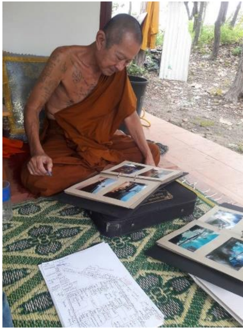
หลวงพ่อกิเดช ชยธมโม

ภาพกับบางคนจะมีเรื่องราวที่ติดค้างในใจ ทำให้ภาพเก่ากลับมามีชีวิต มีพลังสื่อสารอารมณ์ความรู้สึกได้อย่างดี” ชานนท์กล่าว