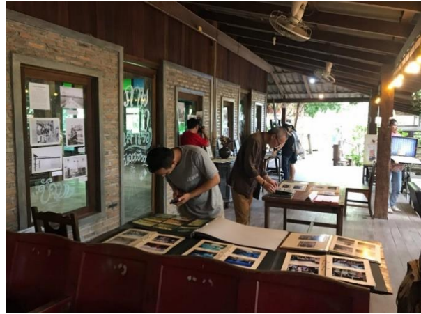
คณะทำงานโครงการจัดเก็บข้อมูลชุมชนเมืองเชียงคำ และนิทรรศการภาพเก่าเล่าเรื่องเมืองเชียงคำ

ภาพเก่าเมืองเชียงคำทำให้เห็นการเดินทางของเมืองจากอดีตสู่ปัจจุบันที่ประกอบไปด้วยกลุ่มคนที่หลากหลาย ทั้งคนพื้นเมืองดั้งเดิม คนที่อพยพเข้ามาอยู่ใหม่ คนต่างถิ่นที่มาเยือน ฯลฯ ซึ่งล้วนแล้วแต่มีบทบาทสำคัญกับการพัฒนาและเติบโตของเมืองเชียงคำในช่วงหลายสิบปีที่ผ่านมา ยิ่งไปกว่านั้น โครงการจัดเก็บข้อมูลชุมชนเมืองเชียงคำยังทำให้ชุมชนได้เรียนรู้ขั้นตอนการเก็บรวบรวมข้อมูลอย่างเป็นระบบ ได้รู้จักชุมชนของตนเองมากขึ้น เกิดเครือข่ายความร่วมมือจากกลุ่มที่ทำกิจกรรมต่างๆ อีกทั้งภาพเก่ายังเป็นสื่อกลางให้ชาวเชียงคำได้เข้ามาทำงานร่วมกันในบทบาทที่แตกต่างกันไป ไม่ว่าจะเป็นในฐานะเจ้าของภาพ คนเล่าเรื่อง คนเก็บรวบรวมข้อมูล คนจัดการข้อมูล ฯลฯ ซึ่งการมีส่วนร่วมถือเป็นหัวใจสำคัญของการทำคลังข้อมูลชุมชน ทั้งหมดนี้ต่างก็ทำงานสอดประสานกันจนเกิดเป็นคลังข้อมูลขนาดใหญ่ที่พร้อมจะเป็นแหล่งเรียนรู้และความทรงจำร่วมที่สำคัญของชุมชน