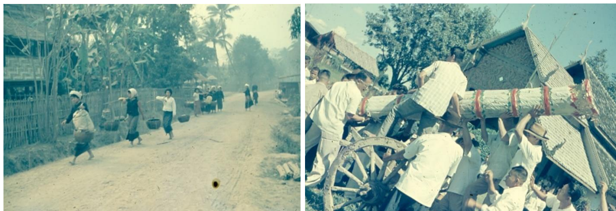
ภาพถ่ายจากบันทึกสนามของไมเคิล มอร์แมน แสดงให้เห็นภาพวิถีชีวิตและประเพณีของเมืองเชียงคำ ปี พ.ศ.2503

ผู้เขียนใช้เวลาราวสามปี เพื่อจัดการภาพถ่าย ทั้งการสแกนและการค้นหาคำอธิบายภาพ แม้มอร์แมนจะได้นำข้อมูลไว้แล้วจำนวนหนึ่ง แต่อีกกว่าพันภาพที่เหลืออยู่ในมือยังคงไม่มีข้อมูลที่จะนำไปสู่ข้อเท็จจริงว่า ในภาพนั้น ใคร ทำอะไร ที่ไหน อย่างไร ทำให้ผู้เขียนคิดว่า หรือเราควรจะไปที่ชุมชนเพื่อหาคำตอบด้วยตัวเอง? การย้อนรอยมอร์แมนจึงเกิดขึ้น ใน พ.ศ. 2550 และนั่นเป็นครั้งแรกที่ผู้เขียนได้สัมผัสเมืองเชียงคำ