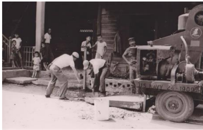
กลุ่มทหาร U.S. NAVY SEABEE ปฏิบัติภารกิจในอำเภอเชียงคำ พ.ศ.2509-2510