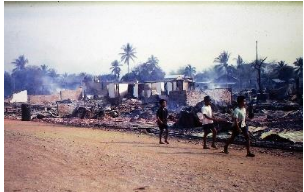
ห้องยาศริสเตียน การทำงานของหมอโคโรธี ยูติก และเหตุการณ์ไฟไหม้ตลาดเชียงคำ ปี พ.ศ. 2511

พ.ศ. 2501-2504 ไมเคิล มอร์แมน ได้เลือกบ้านแพด อำเภอเชียงคำ เป็นพื้นที่ทำวิจัยภาคสนามเพื่อเก็บข้อมูลสำหรับวิทยานิพนธ์ปริญญาเอก ผู้เขียนมีโอกาสไปที่บ้านแพดเพื่อพูดคุยกับคนเฒ่าคนแก่ที่เคยได้พบมอร์แมนเมื่อ 60 ปีที่แล้ว ไม่มีใครรู้ว่านักมานุษยวิทยาคืออะไร ทำงานอะไร ภาพในความทรงจำของชาวบ้านรู้จักแต่พ่อจารย์ไมเคิล ที่เข้ามาอยู่ในหมู่บ้านเพราะสนใจใคร่รู้ว่าคุณที่นี้เขาอยู่กินกันอย่างไร ทำอะไรกันบ้างในแต่ละวัน มอร์แมนเฝ้าสังเกตความเป็นไปของชุมชนอย่างใกล้ชิด และลงไปมีส่วนร่วมในกิจกรรมต่าง ๆ จากคนแปลกหน้ากลายเป็นคนคุ้นเคยของชุมชนได้ไม่ยาก นับว่าเป็นความสำเร็จของมอร์แมนกับกระบวนการวิจัยที่เรียกว่า การสังเกตอย่างมีส่วนร่วม (participant observation) 2 ภาพถ่ายของมอร์แมนจึงเป็นการบอกเล่าเรื่องราวผ่าน