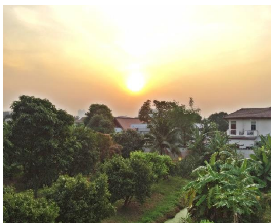
ภาพ : โรงเพาะชำแหล่งพันธุ์ไม้ สวนลุงฉิม (ซ้าย) บ้านสวน บางขุนนนท์ 31 (ขวา)

นับว่าวันนี้เป็นโชคของผมที่ได้พบกับลุงตุ๋ โอภาส และได้เยี่ยมชมสวนของท่าน ซึ่งโดยปกติแล้วท่านไม่ค่อยมีเวลาว่าง เนื่องจากท่านมีภารกิจมากมาย จึงทำให้วันนี้ผมได้ข้อมูลหลากหลายที่ไม่เคยทราบมาก่อน