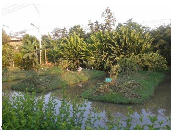
ปัจจุบันคือสวนเฉลิมพระเกียรติ 80 พรรษา พระบาทสมเด็จพระเจ้าอยู่หัว บางขุนนนท์