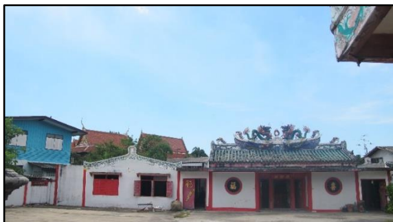
ศาลเจ้าพ่อกวานอู