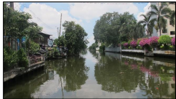
คลองภาษีเจริญ บริเวณหน้าวัดรางบัว