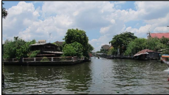
ปากน้ำคลองภาษีเจริญเชื่อมคลองบางกอกใหญ่