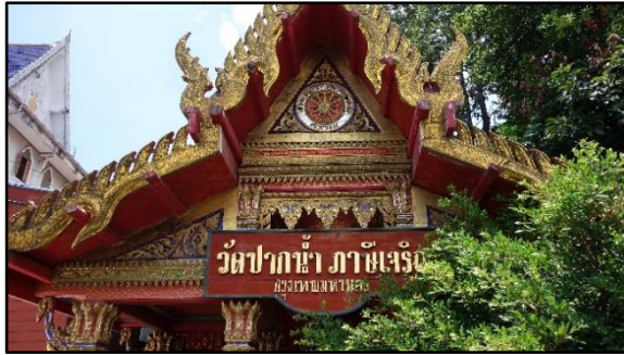
ศาลาทำน้ำวัดปากน้ำภาษีเจริญ