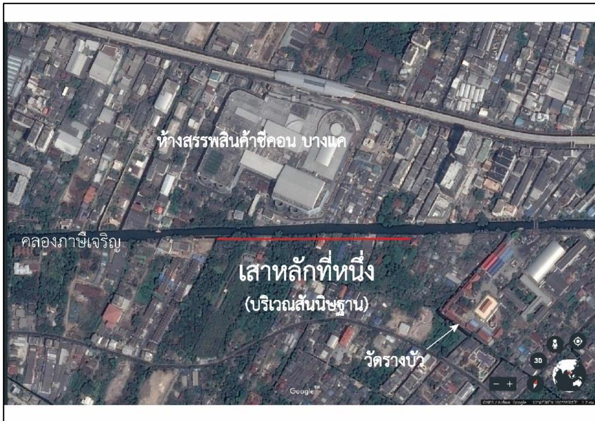
แผนที่แสดงบริเวณสันนิษฐานที่ตั้งของเสาหลักเส้นที่ 100, ดัดแปลงจาก google earth, 2017

อย่างไรก็ตาม ข้อมูลเชิงประวัติมีความขัดแย้งกับข้อมูลขอบเขตการปกครองในปัจจุบัน กล่าวคือเมื่อกำหนดตำแหน่งสันนิษฐานจุดตั้งเสาหลักเส้นที่หนึ่ง ด้วยวิธีวัดตามระยะทาง 4\pm 0.11 กิโลเมตร จากเสาหลักเส้นใกล้เคียง ด้วยวิธีคาดคะเนลงบนแผนที่ภาพถ่ายดาวเทียมแล้วปรากฏว่า “บริเวณสันนิษฐานจุดตั้งเสาหลักเส้นที่หนึ่ง” อยู่ในท้องที่การปกครองของ “แขวงบางหว้า เขตภาษีเจริญ” โดยห่างจากแนวเขต “แขวงบางแค เขตบางแค” ไปทางทิศตะวันออกถึง 900 เมตร