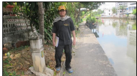
เสาหลักบอกเขตคลองสาธารณะ สร้างโดยกรุงเทพมหานคร สมัยปัจจุบัน