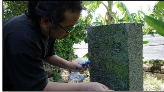
การขัดล้างตะไคร่น้ำแห้ง ก่อนลงแป้งบนเส้นจารึกเพื่อถ่ายภาพ