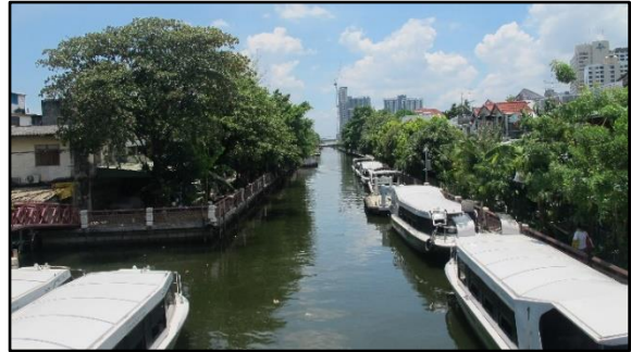
คลองภาษีเจริญช่วงถัดจากประตูน้ำเป็นต้นไป