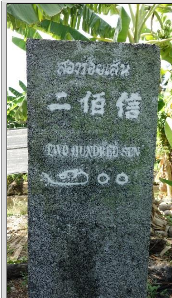
เสาหลักเส้นที่ 200 ห่างจากวัดม่วงราว 770 เมตร แขวงหลักสอง เขตบางแค กรุงเทพมหานคร