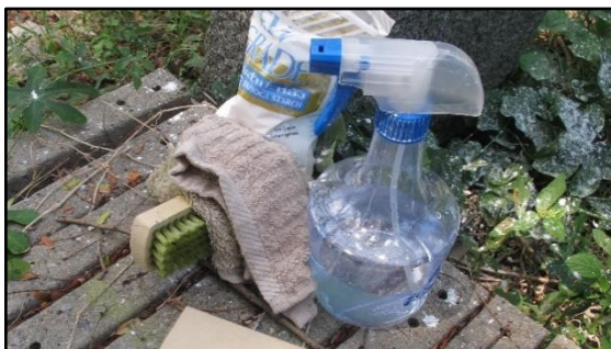
อุปกรณ์สำหรับศึกษาจารึกและทำความสะอาด