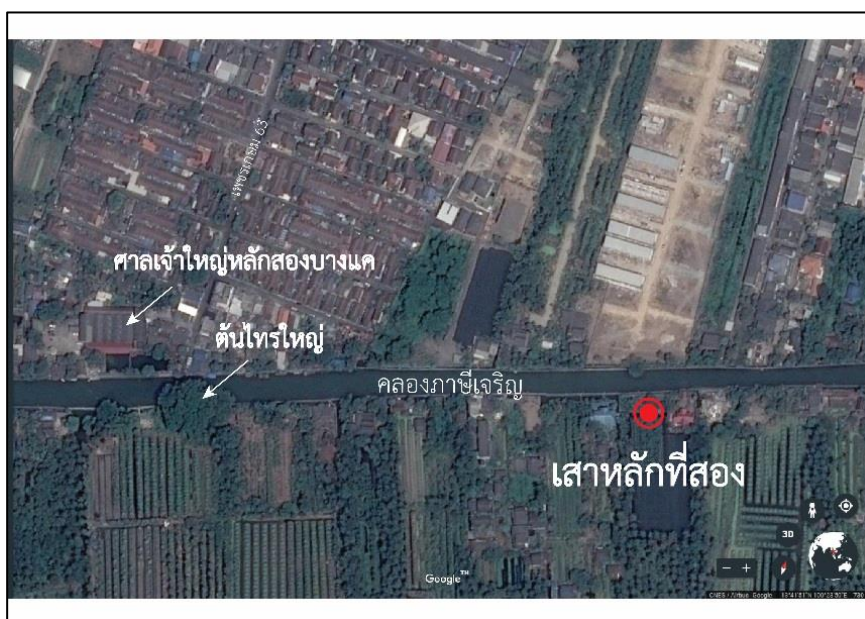
แผนที่แสดงตำแหน่งเสา, ภาพถ่ายดาวเทียม: ดัดแปลงจาก google earth, 2017