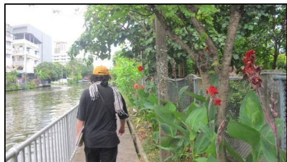
การเดินทางสำรวจบนทางเท้าเลียบบคลองภาษีเจริญ