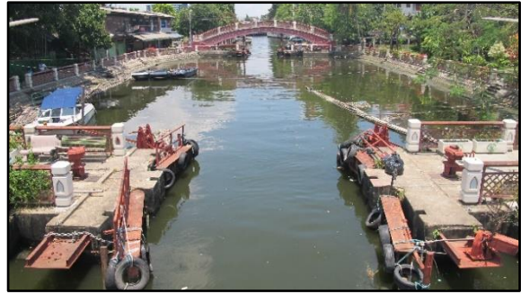
ประตูน้ำคลองภาษีเจริญ