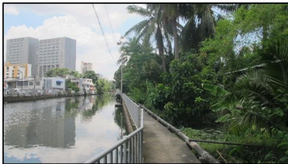
พื้นที่รกร้างริมคลองภาษีเจริญ

พ.ศ. 2540 แขวงบางแค ถูกยกฐานะขึ้นโดยรวบรวมเอาแขวงใกล้เคียงอาทิ แขวงหลักสอง แขวงบางไผ่ เป็นต้น ได้ตั้งเป็น “เขตบางแค” ขึ้นในปัจจุบัน ฉะนั้น ตำบลหลักหนึ่ง ปัจจุบันคือ แขวงบางแค เขตบางแค