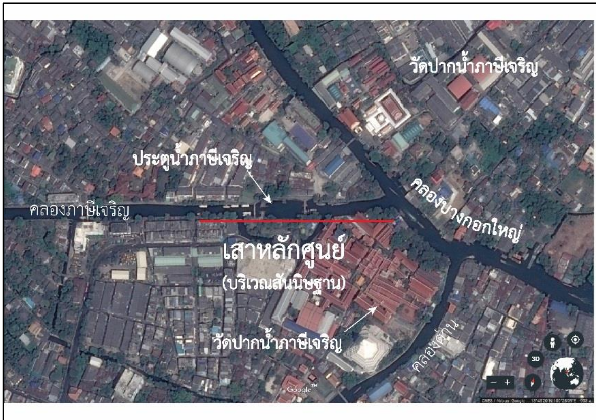
แผนที่แสดงบริเวณสันนิษฐานที่ตั้งของเสาหลักเส้นที่ 0, ดัดแปลงจาก google earth, 2017