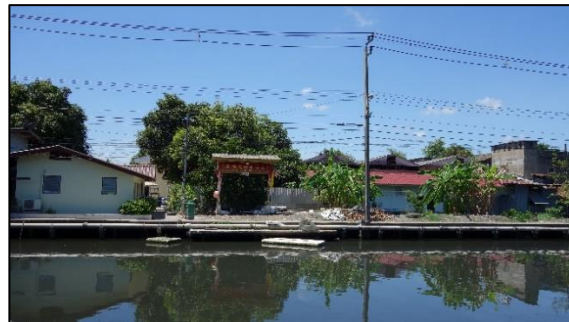
ศาลเจ้าใหญ่ หลักสองบางแค ริมคลองภาษีเจริญ