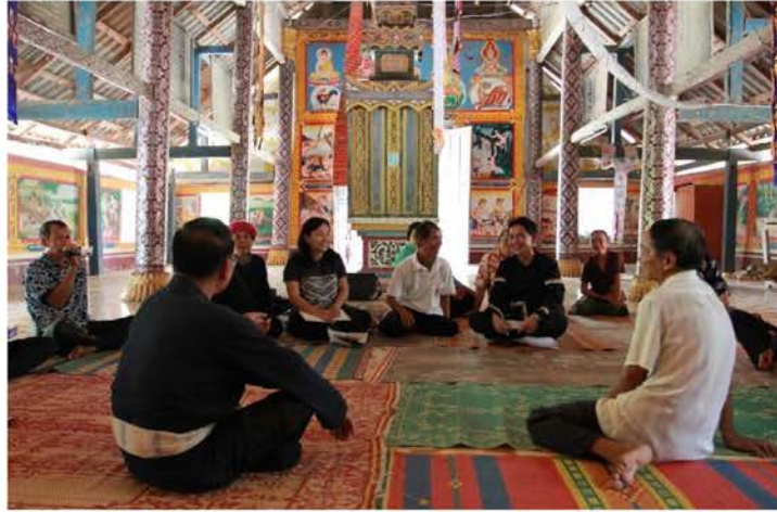
ภาพที่ 4.4 เก็บข้อมูลที่บ้านท่าฟ้า แขวงห้วยทราย สปป.ลาว

6. ความเชื่อเรื่องผีและสายเครือญาติที่สืบเนื่องมาจากการอพยพมาจากเมืองอูและเมืองสิงห์ ที่เป็นเสมือนระบบการปกครองของชุมชนลื้อ ที่เรียกว่า “ไตเฮือน” ที่หมายถึง การอยู่ร่วมกันของชุมชนชาวลื้อที่สัมพันธ์กับความเชื่อเรื่องผีและสายเครือญาติที่สืบเนื่องมาจากเมืองอูและเมืองสิงห์ มีการสืบเชื้อสายหรือการสืบผีที่มีลักษณะความเป็นอยู่เป็นกลุ่มเป็นก้อนของคนที่เป็นเหมือนญาติกัน โดยการสืบสายมาจากบรรพบุรุษ จำนวน 5 ไตเฮือน คือ ไตเฮือนน้ำห้วย ไตเฮือนกอขาม ไตเฮือนนาย ไตเฮือนกลาง และไตเฮือนก้างเถิน ซึ่งไม่มีลายลักษณ์อักษรระบุไว้แต่มีการเล่าสืบต่อกันมาตั้งแต่บรรพบุรุษ การยึดโยงความสัมพันธ์กันแบบนี้มีที่ชุมชนลื้อศรีดอนชัยและบ้านห้วยเม็ง แต่ในบ้านหาดบ้าย ตำบลริมโขงไม่มี