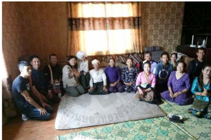
ภาพที่ 4.16 เยี่ยมผู้อาวุโสของหมู่บ้านและเก็บข้อมูลที่บ้านพ่าย เมืองฮาย สิบสองปันนา

ส่งผ่านมายังคนลื้อรุ่นต่อๆ มาจนถึงปัจจุบัน ดังนั้น การมีประวัติศาสตร์ร่วมของคนลื้อและความเป็นชาติพันธุ์ที่มีที่มาจากที่เดียวกันเป็นตัวเชื่อมความสัมพันธ์ของลื้อได้อย่างรวดเร็วและเหนียวแน่น ดังการที่คณะวิจัยได้เดินทางไปเยี่ยมพี่น้องลื้อที่สิบสองปันนาจะเห็นว่าหากมีการพูดถึงเรื่องประวัติศาสตร์การอพยพของลื้อแล้วย่อมทำให้การสนทนาราบรื่นและใช้เวลา นั่งคุยกันค่อนข้างนาน และสิ่งที่สัมผัสได้คือ ความผูกพันของคนลื้อที่ไม่่ว่าจะอยู่ที่ใดก็เหมือนกันญาติที่ใกล้ชิดกันมาก ด้วยภาษาพูดและประวัติศาสตร์ทางสังคมและการเมือง