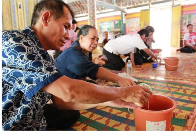
ภาพที่ 4.3 พี่น้องลื้อศรีคอนซั่วมทำบุญที่วัดลื้อบ้านท่าฟ้า แขวงห้วยทราย สปป.ลาว

5. การมีประวัติศาสตร์ร่วมกันของคนลื้อ ที่มีประวัติศาสตร์การเดินทางของบรรพบุรุษมาจาก แคว้นสิบสองปันนา มณฑลยูนนาน ประเทศสาธารณรัฐประชาชนจีน จากประวัติศาสตร์บรรพบุรุษของชาวลื้อได้มีการเดินทางมาจากแคว้นสิบสองปันนามาหลายเส้นทาง แล้วมีการแยกกันออกไปหาพื้นที่ทำกินและตั้งชุมชนในพื้นที่ต่างๆ หลายพื้นที่ มาจนถึงปัจจุบัน ซึ่งแม้ว่าจะอยู่คนละพื้นที่แต่หากมีการไล่เรียงถึงบรรพบุรุษ ประวัติศาสตร์การเดินทางเข้ามาของลื้อแต่พื้นที่ก็จะทำให้เห็นความสัมพันธ์ของคนลื้อในอดีต และส่งผ่านมายังคนลื้อรุ่นต่อๆ มาจนถึงปัจจุบัน ดังนั้น การมีประวัติศาสตร์ร่วมกันของคนลื้อและความเป็นชาติพันธุ์ที่มีที่มาจากที่เดียวกันเป็นตัวเชื่อมความสัมพันธ์ของลื้อได้อย่างรวดเร็วและค่อนข้างเหนียวแน่นด้วยความรู้สึกเป็น “พวกเดียวกัน” หรือเป็น “กลุ่มเดียวกัน” ของคนลื้อในแต่ละพื้นที่