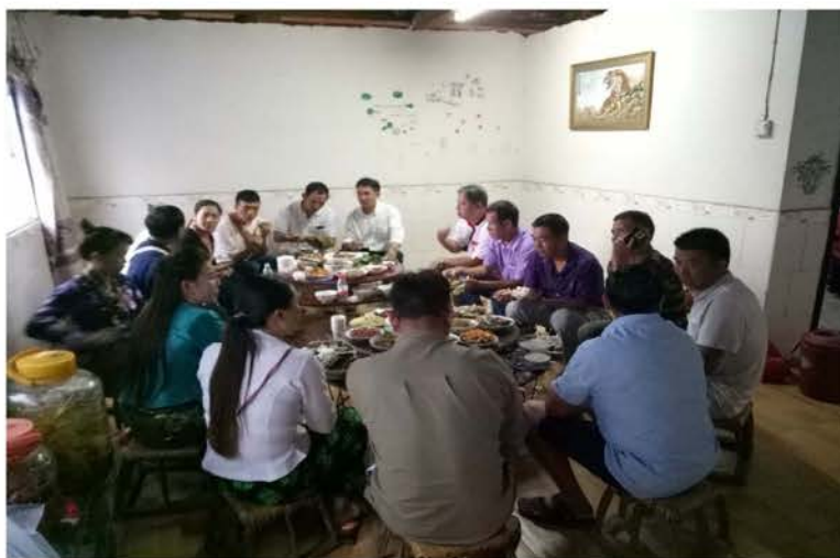
ภาพที่ 4.19 อาหารต้อนรับทีมวิจัยและแกนนำลี้จากเชียงของ จังหวัดเชียงราย

ในคราวไปเยี่ยมลี้ที่บ้านหนองคำ เมืองวัง สิบสองปันนา