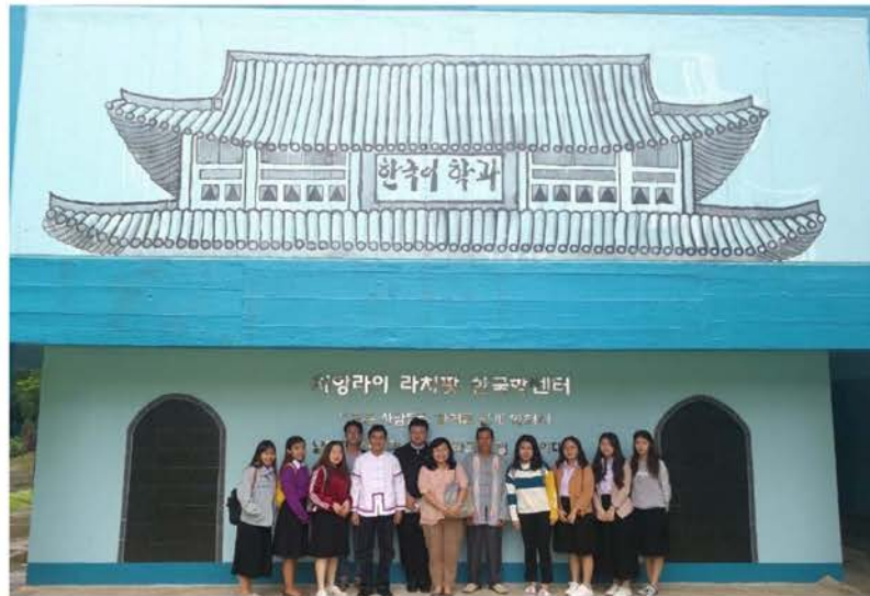
ภาพที่ 4.15 นักศึกษาถือจากสิบสองปันนาที่เรียนวิชาเอกภาษาไทยมหาวิทยาลัยราชภัฏเชียงราย

3. เครือข่ายสมาคมลื้อแห่งประเทศไทย ในแต่ละปีจะมีการพบปะระหว่างพี่น้องลื้อในประเทศไทย ซึ่งมีการจัดงานจะหมุนเวียนกันจัดไปในจังหวัดที่มีคนลื้ออาศัยอยู่ ได้แก่ จังหวัดเชียงราย พะเยา ลำพูน นับเป็นความสัมพันธ์อย่างเป็นทางการ ชาวลื้อที่อำเภอเชียงของ จังหวัดเชียงรายได้เข้าร่วมกิจกรรมอย่างต่อเนื่องทุกปี ซึ่งในการจัดงานดังกล่าวได้มีการเชิญทาญาคิงค์สุดท้ายของเจ้าหลวงคำลื้อ กษัตริย์องค์สุดท้ายของคนลื้อที่สิบสองปันนาที่ปัจจุบันอาศัยอยู่ในประเทศไทยเข้าร่วมด้วย และยังมีคนลื้อที่อยู่สิบสองปันนาเข้าร่วมด้วย เป็นจุดที่ทำให้เกิดความสัมพันธ์ที่ใกล้ชิดระหว่างกลุ่มคนลื้อในประเทศไทย และระหว่างคนลื้อที่อำเภอเชียงของกับลื้อที่สิบสองปันนาด้วย