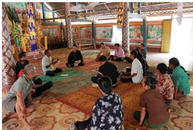
ภาพที่ 4.9 เก็บข้อมูลร่วมกับชุมชนศรีดอนชัยที่ สปป.ลาว

การยึดโยงความสัมพันธ์ของลื้ออำเภอเชียงของ จังหวัดเชียงราย กับลื้อแขวงบ่อแก้ว สาธารณรัฐประชาธิปไตยประชาชนลาวบนฐานความเป็นชาติพันธุ์ลื้อด้วยกันนั้น จะเห็นว่าสิ่งที่ยึดโยงความสัมพันธ์ของลื้อทั้งสองพื้นที่ได้นั้นจะเกี่ยวข้องกับความเป็นชาติพันธุ์ลื้อ อัตลักษณ์ของลื้อ และความเชื่อที่เกี่ยวข้องกับความเป็นลื้อมาเกี่ยวข้อง ถึงแม้ว่าจะไม่ใช่ญาติกันก็ตาม หากรู้ว่าเป็นลื้อก็สามารถที่จะพูดคุยและสร้างสัมพันธ์กันได้ง่ายขึ้น ได้แก่ การนับถือผีบ้าน ผีเมือง ผีบรรพบุรุษ เนื่องจากความเชื่อเหล่านี้มักแสดงออกมาให้เห็นในรูปแบบของสิ่งที่เป็นวัตถุในชุมชนลื้อแต่ละแห่ง ไม่ว่าจะเป็น “หอเจ้าบ่อพญาคำ” “เจ้าพ่อเตี้ยไก่อแจ้” สิ่งต่างๆ เหล่านี้ นับว่าเป็นรูปธรรม สามารถเห็นได้ชัดเจน แตกต่างกับความเชื่อเรื่อง “ผีเตวดาเฮือน” (เทวดาบ้าน) ที่ไม่สามารถมองเห็นได้ง่ายเพราะอยู่ในตัวบ้าน หากไม่เข้าไปในบ้านก็ไม่เห็น