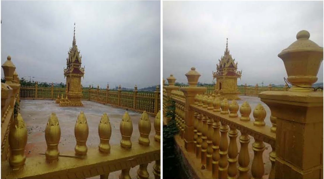
ภาพที่ 4.17-4.18 ใจกลางบ้านที่บ้านยาง เมืองเจียงเงิน สิบสองปันนา

8. ความเชื่อเรื่อง “ผีบรรพบุรุษ” ไม่ว่าชาวลื้อจะอพยพไปอยู่ที่ใดจะต้องเชิญผีบรรพบุรุษไปไว้ในชุมชนเพื่อเคารพและเป็นที่ยึดเหนี่ยวจิตใจให้กับคนในชุมชนด้วย เช่น การนับถือ “เจ้าพ่อไก่แจ้” ของชุมชนลื้อหาดบ้าย ตำบลริมโขง การนับถือเจ้าบ่อพญาคำของชุมชนลื้อศรีดอนชัยและลื้อที่บ้านห้วยเม็ง อำเภอเชียงของ “เจ้าบ่อพญาคำ” ซึ่งเป็นหนึ่งในผู้นำของชาวลื้อที่มีบทบาทสำหรับชุมชนและคนลื้อในอดีต และได้เล่าสืบต่อกันมา ทำหน้าที่ดูแลปกป้องรักษาชาวลื้อ หากมีเหตุการณ์อะไรไม่ดีเกิดขึ้นกับชุมชน ชาวบ้านจะต้องมีการจัดบวงสรวงด้วยวัว ควาย หมู เป็ด และไก่ โดยมีข้อห้ามคือ ห้ามผู้หญิงเข้าไปในเขตบวงสรวงโดยเด็ดขาด และห้ามผู้ชายที่อยู่ต่างหมู่บ้านที่ไม่ใช่คนลื้อเข้าไปด้วย ผีเจ้าเมืองมีบทบาทในด้านการเป็นที่ยึดเหนี่ยวจิตใจให้กับคนในชุมชน ทำให้มีขวัญและกำลังใจที่ดีในการใช้ชีวิตและเป็นที่ยึดเหนี่ยวจิตใจของคนทั้งชุมชน