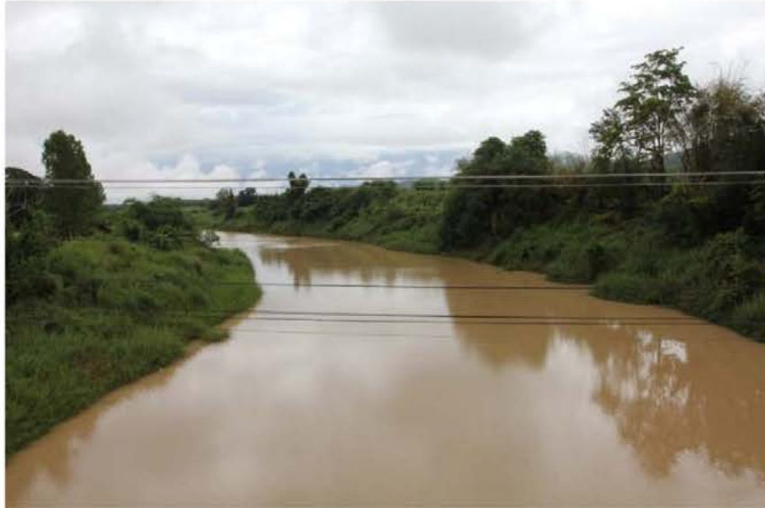
ภาพที่ 4.1 ชุมชนลื้อศรีคอนชัยตั้งอยู่ริมแม่น้ำอิงที่เชื่อมโยงกับการย้ายถิ่นในอดีตที่ใช้เส้นทางน้ำอิง

ประวัติการอพยพของชาวลื้อที่ชุมชนศรีคอนชัยมาจากแคว้นสิบสองปันนา มีทั้งเมืองอุและเมืองสิงห์ ซึ่งตอนนั้นเป็นเขตปกครองของแคว้นสิบสองปันนา การอพยพครั้งแรกมีจำนวน 994 คน โดยการนำของ “พญาแก้ว” ได้นำชาวลื้ออพยพมาที่คอยหลักคำเขตเป็นชายแดนลาวที่มีพื้นที่ติดกับประเทศจีน และอาศัยอยู่ที่คอยหลักคำเขตได้ประมาณ 2 ปี ก็ย้ายไปอยู่ที่เมืองห้วยทราย แขวงบ่อแก้ว สาธารณรัฐประชาธิปไตยประชาชนลาว ตอนที่มาถึงเมืองห้วยทราย สาธารณรัฐประชาธิปไตยประชาชนลาวชาวลื้อที่ได้แยกกันออกเป็น 3 กลุ่ม เพื่อไปตั้งบ้านเรือนตามที่ต่างๆ (วิจุลดา มาตันบุญ, 2562) ดังนี้