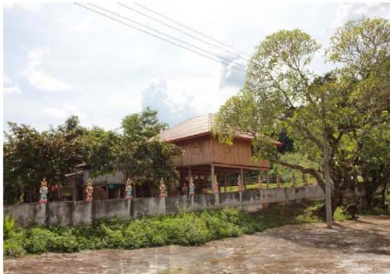
ภาพที่ 4.7 ศาลเจ้าบ่อพญาคำ บ้านท่าฟ้า แขวงบ่อแก้ว สปป.ลาว

เป็นการสักการะศาลเจ้าบ่อแล้ว ยังทำเพื่อให้คนในชุมชนอยู่ดีสบายและมีความสุข ชาวลื้อเชื่อว่าหลังจากที่ทำพิธีกำเสร็จแล้วจะทำให้ผ่านพ้นจากสิ่งไม่ดี และจะพบเจอแต่สิ่งดีๆ ในชีวิต