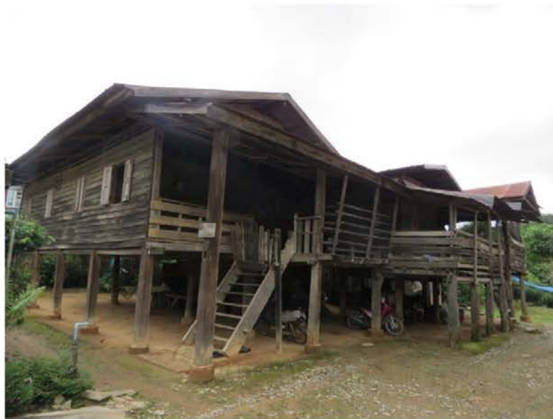
ภาพที่ 4.12 บ้านเรือนลื้อ ความเป็นอยู่ของคนลื้อ บ้านท่าฟ้า แขวงห้วยทราย สปป.ลาว

การเชื่อมโยงความสัมพันธ์ระหว่างชุมชนลื้อที่อำเภอเชียงของ กับลื้อที่แขวงบ่อแก้ว สาธารณรัฐประชาธิปไตยประชาชนลาว ส่งผลให้เกิดการแลกเปลี่ยนเรียนรู้ด้านวัฒนธรรมลื้อระหว่างสองพื้นที่ด้วย ตัวอย่างเช่น ประเพณีอะไรบ้างที่ชุมชนลื้อที่อำเภอเชียงของมีหรือไม่มี และประเพณีอะไรบ้างที่ชุมชนลื้อที่แขวงบ่อแก้วมีหรือไม่มี และเหตุผลที่ประเพณีวัฒนธรรมต่างๆ หายไปนั้นเป็นเพราะเหตุผลอะไร ซึ่งนำมาสู่การหารือกันในวงเสวนาชุมชนลื้อทั้งสองประเทศ