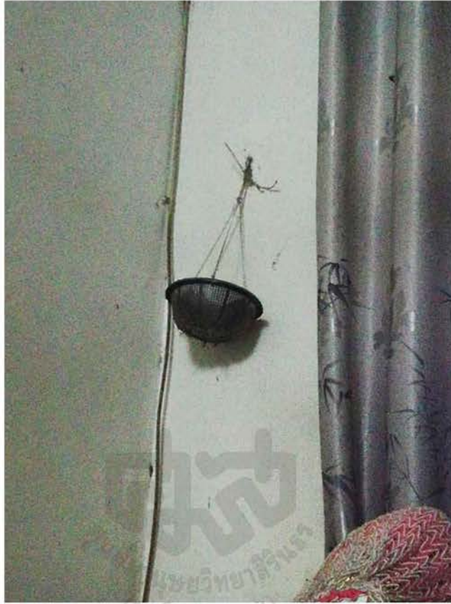
ภาพที่ 4.23 สัญลักษณ์แทนผีบรรพบุรุษฝ่ายผู้ชายหรือฝั่งพ่อ ในภาพเป็นพ่อของปู่ เรียกว่า “ผีล้าแกฮั้น”