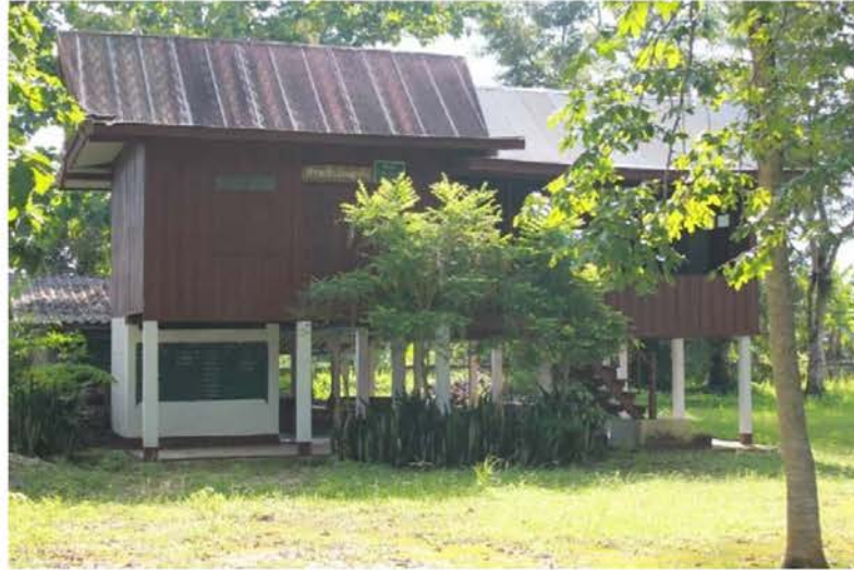
ภาพที่ 4.8 ศาลเจ้าพ่อพญาคำชุมชนศรีดอนชัย อำเภอเชียงของ จังหวัดเชียงราย

9. ระบบนามสกุล เป็นสิ่งที่บ่งบอกสายสัมพันธ์ของคนลื้อในประเทศไทย กล่าวคือ อำเภอเชียงของ จังหวัดเชียงราย แต่เดิมคนลื้อก็เหมือนกับคนไทยที่ไม่มีนามสกุลและในสมัยราชการที่ 6 ได้บัญญัติให้มีนามสกุลขึ้นเมื่อผู้นำไปจดทะเบียนชื่อหรือนามสกุลมักจะใช้เหมือนกัน เช่น “วงศ์ชัย” “ธรรมวงศ์” “จันทาคาด” ซึ่งการใช้นามสกุลเหมือนกัน ในแต่ละหมู่บ้านมักมีนามสกุลที่เหมือนกันหมด เป็นเหมือนเอกลักษณ์ของชุมชนลื้อในพื้นที่ต่างๆ ไป เช่น ชุมชนศรีดอนชัยอำเภอเชียงของใช้นามสกุล “วงศ์ชัย” บ้านหาดบ้าย อำเภอเชียงของใช้นามสกุล “ธรรมวงศ์” บ้านห้วยเม็ง อำเภอเชียงของใช้นามสกุล “จันทาคาด” และ “หงส์คำ” เมื่อเห็นนามสกุลของคนลื้อแล้วสามารถบอกได้ว่าเป็นคนลื้อที่อยู่ที่ไหน มีพื้นเพมาจากไหน