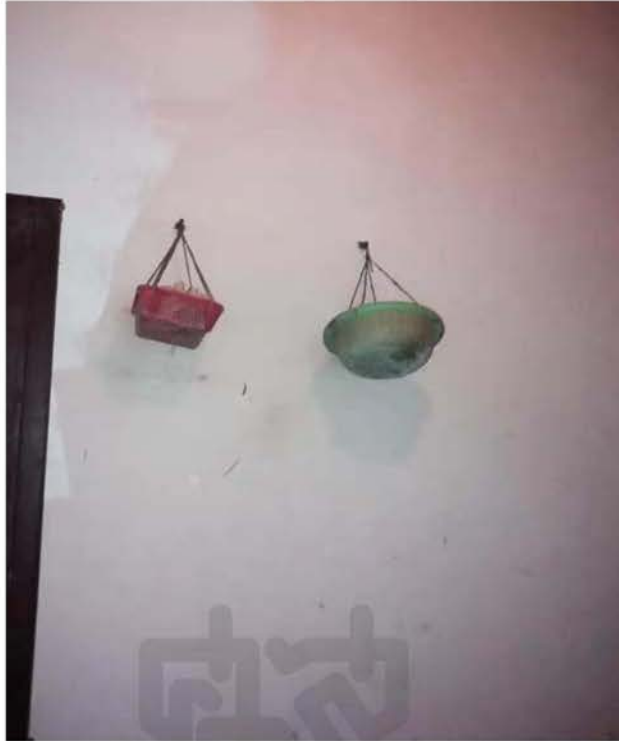
ภาพที่ 4.22 สัญลักษณ์แทนตีบรรพบุรุษฝ่ายแม่ ในภาพเป็นแม่ของย่า เรียกว่า “สีล้า”

มหาวิทยาลัยราชภัฏวชิราวุธวิทยาลัย (องค์การมหาชน)