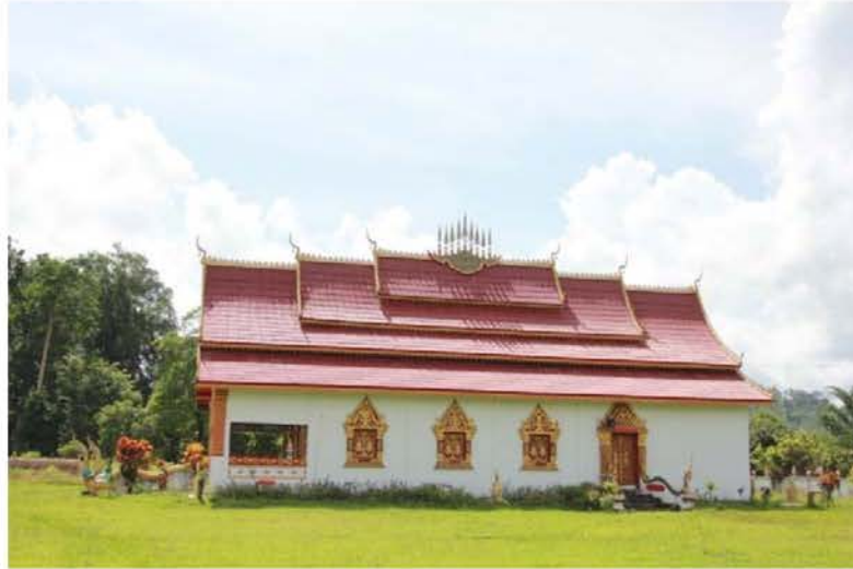
ภาพที่ 4.11 วัดบ้านปงนาหนูน เมืองห้วยทราย แขวงบ่อแก้ว สาธารณรัฐประชาธิปไตยประชาชนลาว