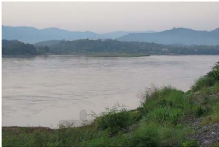
ภาพที่ 4.2 ชุมชนลื้อหาดบ้ายตั้งอยู่ริมแม่น้ำโขงกั้นเขตแดนระหว่างไทย-ลาว

หลายกลุ่ม บางกลุ่มอาศัยอยู่ที่อำเภอแม่สาย บางกลุ่มอยู่แถบริมแม่น้ำโขงและได้เข้ามาอาศัยอยู่ในประเทศไทยที่บ้านดอนที่ ตำบลริมโขง อยู่ห่างจากบ้านหาดบ้ายปัจจุบันไปประมาณ 1 กิโลเมตร หลังจากนั้นได้มีการโยกย้ายมาอยู่ที่บ้านหาดบ้ายหมู่ 1 ในปัจจุบัน