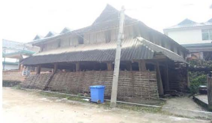
ภาพที่ 4.4 สภาพบ้านลื้อที่หลงเหลือเพียงหนึ่งหลัง ท่ามกลางตึกที่บ้านแล่ เมืองวัง สาธารณรัฐประชาชนจีน

ปี และมีการสลับการเปลี่ยนหัวหน้าไต่เฮียนไปเรื่อยๆ หากจำนวนครัวเรือนในไต่เฮียนไม่มากนักก็จะมีคนที่เป็นหัวหน้าไต่เฮียนซ้ำๆ กัน