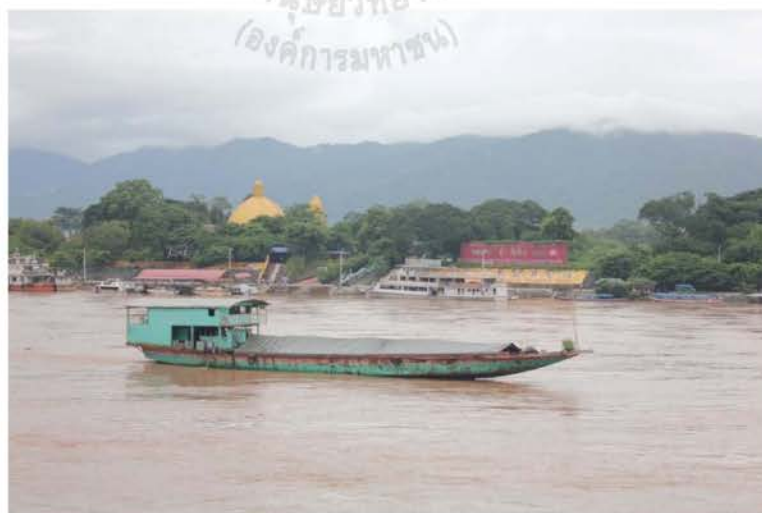
ภาพที่ 4.27 เรือขนส่งสินค้าไปจีนตามแนวชายแดนไทย-ลาว

แม้ว่าด้วยสภาพภูมิประเทศของชุมชนลื้อที่อำเภอเชียงของ จังหวัดเชียงราย จะอยู่ห่างไกลจากสิบสองปันนา มณฑลยูนนาน สาธารณรัฐประชาชนจีน แต่คนลื้อทั้งสองพื้นที่ก็มีความสัมพันธ์ระหว่างกัน และมีการยึดโยงความสัมพันธ์กันผ่านระบบการทำมาค้าขาย จากการที่คนในชุมชนศรีดอนชัย อำเภอเชียงของ จังหวัดเชียงราย ได้รู้จักกับนักศึกษาลื้อจากสิบสองปันนาที่มาเรียนมหาวิทยาลัยราชภัฏ เชียงราย ทำให้เกิดการมีส่วนร่วมของนักศึกษาลื้อจากสิบสองปันนา ที่ให้ความร่วมมือในการแสดงกิจกรรมต่างๆ กับชุมชนมาอย่างต่อเนื่อง นักศึกษาเหล่านี้ ได้ทดลองนำสินค้าประเภทผ้าทอจากชุมชนลื้อในพื้นที่อำเภอเชียงของ จังหวัดเชียงราย รวมถึงสินค้าจากอำเภอเชียงคำ จังหวัดพะเยา ไปจำหน่ายยังสิบสองปันนา ซึ่งได้รับความสนใจเป็นอย่างดี ทำให้เกิดการสั่งสินค้าที่เป็นผ้าทอจากชุมชนลื้อที่อำเภอเชียงของไปจำหน่ายยังสิบสองปันนาในจำนวนที่มากขึ้นเรื่อยๆ ซึ่งทำให้เกิดกระบวนการหาสินค้าผ้าทอจากชุมชน โดยหาช่างทอที่สามารถส่งผ้าทอให้ได้อย่างต่อเนื่องและมีคุณภาพ นับเป็นจุดยึดโยงความสัมพันธ์อีกจุดหนึ่งที่ทำให้ความสัมพันธ์ของลื้อทั้งสองประเทศมีแน่นแฟ้นมากขึ้น