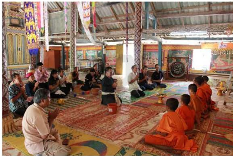
ภาพที่ 4.10 ศาสนาพุทธจุดเชื่อมความสัมพันธ์ของสืลือไทย-ลาว

ชาวสืลือถือว่าเป็นกลุ่มชาติพันธุ์ไทหรือไตที่นับถือพุทธศาสนานิกายเถรวาท และมีความศรัทธาในพุทธศาสนา ดังนั้นการนับถือพุทธศาสนาเหมือนกันจึงเป็นสิ่งที่ช่วยยึดโยงความสัมพันธ์ระหว่างคนสืลือด้วยกัน พุทธสถานที่เกี่ยวข้อง ไม่ว่าจะเป็น วัด โบสถ์ พระพุทธรูป ช่วยทำให้คนสืลือสามารถสานต่อความสัมพันธ์กันได้ง่ายและรวดเร็ว และเป็นจุดเชื่อมความสัมพันธ์กันได้แน่นแฟ้น แม้จะไม่เคยรู้จักกันมาก่อนแต่หากรู้ว่านับถือศาสนาพุทธ ย่อมเป็นสิ่งที่เชื่อมโยงความสัมพันธ์กันได้ง่ายและสามารถยึดโยงความสัมพันธ์กันได้เป็นอย่างดี