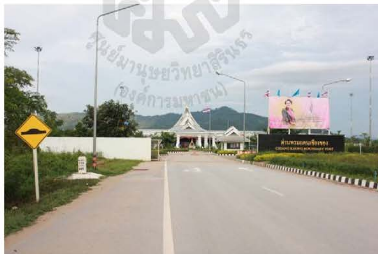
ภาพที่ 4.29 เส้นทาง R3A ผ่านด่านพรมแดนเชียงของ บ้านดอนมหาวัน ตำบลเวียง อำเภอเชียงของ จังหวัดเชียงราย

มีจุดยึดโยงความสัมพันธ์ของคนลือบางพื้นที่ ไม่ว่าจะเป็นพื้นที่อำเภอเชียงของ จังหวัดเชียงราย และลือที่แขวงบ่อแก้ว สาธารณรัฐประชาธิปไตยประชาชนลาว และลือที่สิบสองปันนาคือการมีการปกครองในระบบกษัตริย์ที่มีเจ้าหม่อมคำลือกษัตริย์องค์สุดท้ายแห่งสิบสองปันนา