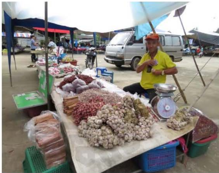
ภาพที่ 4.13 การค้าขายตามพื้นที่แนวชายแดนไทย-ลาว

แล้วนำมาขายยังชุมชนลื้อที่ฝั่งประเทศไทย หรือตลาดตามแนวชายแดนในอำเภอใกล้เคียง เช่น ที่จุดผ่อนปรน อำเภอเวียงแก่น สะท้อนถึงความสัมพันธ์ที่มีระหว่างชาวลื้อทั้งสองพื้นที่ได้อย่างชัดเจน ถึงแม้จะมีน้ำโขงกั้นและมีการแบ่งเขตพรมแดนก็ไม่เป็นอุปสรรคแต่อย่างใด