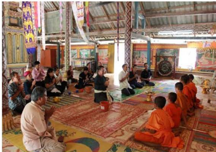
ภาพที่ 4.14 เก็บข้อมูลที่บ้านท่าฟ้า แขวงห้วยทราย สปป.ลาว

การยึดโยงความสัมพันธ์ผ่านระบบการค้าขาย ประกอบไปด้วยการแลกเปลี่ยนสินค้าและการค้าขายระหว่างคนลื้อสองฝั่งโขงที่มีมานาน และปัจจุบันเริ่มมีมากขึ้นเพราะมีการพัฒนาเส้นทางเศรษฐกิจสายใหม่ ผ่านสะพานเชื่อมไทย-ลาวแห่งที่สี่ แม้จะเป็นความสัมพันธ์ที่ไม่ได้แน่นอนแฟ้นมากนัก และตั้งอยู่บนผลประโยชน์ของแต่ละฝ่ายแต่ก็พบว่ามีการทำมาค้าขายกันอย่างต่อเนื่อง ไม่ว่าจะเป็นสินค้าที่เป็นอาหารตามธรรมชาติ เครื่องอุปโภคบริโภค สิ่งเหล่านี้ทำให้คนลื้อขยายเครือข่ายคนรู้จักมากขึ้น จากแค่เพียงการรู้จักเฉพาะเครือญาติก็เพิ่มเครือข่ายคนรู้จักมากขึ้น