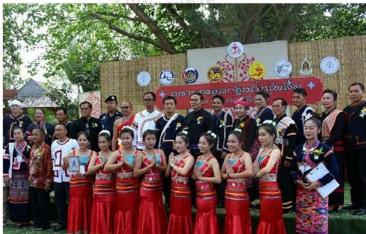
ภาพที่ 4.26 งานจตุลกฐินถิ่นไทลื้อ

ประเพณีที่เกี่ยวข้องกับพุทธศาสนาที่เชื่อมโยงลื้อในจีน ลาว และไทยเข้าด้วยกัน