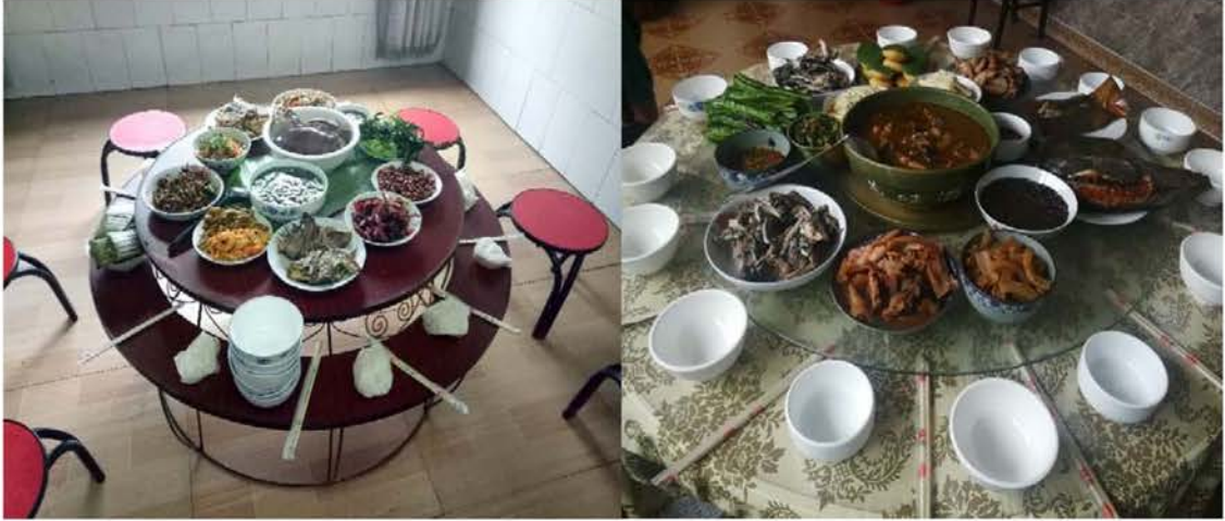
ภาพที่ 4.20-4.21 การจัดอาหารของลื้อที่เมืองวังเพื่อต้อนรับคนลื้อจากประเทศไทย