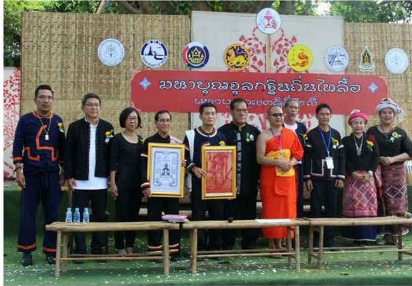
ภาพที่ 4.25 งานจตุลกฐินถิ่นไทลื้อ ชุมชนศรีคอนชัย อำเภอเชียงของ จังหวัดเชียงราย