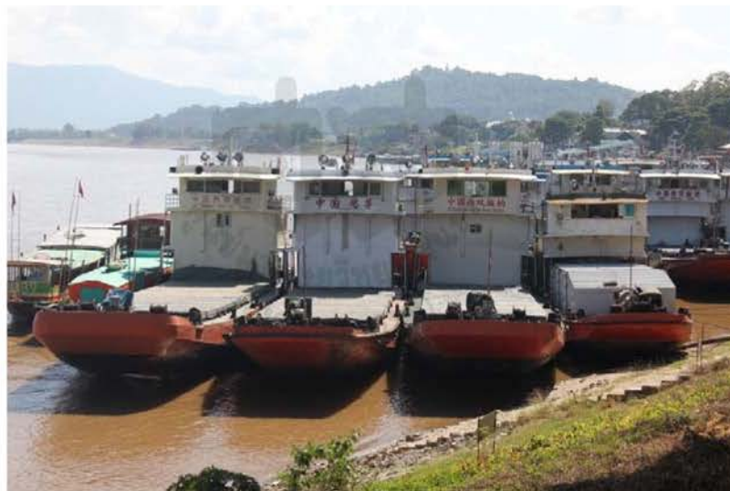
ภาพที่ 4.28 ท่าเรืออำเภอเชียงแสน จังหวัดเชียงรายแห่งที่ 1

นอกจากนี้ การยึดโยงความสัมพันธ์กันของคนลื้อทั้งสองประเทศผ่านระบบการค้าขายยังพบได้ในพื้นที่บ้านห้วยเม็ง ตำบลริมโขง อำเภอเชียงของ จังหวัดเชียงราย ซึ่งส่วนใหญ่มีอาชีพทำสวนผลไม้ ได้แก่ ส้ม ลำไย เงาะ และทุเรียน ที่มีการค้าขายผลไม้ผ่านพ่อค้าคนกลางที่เป็นคนลื้อจากแขวงบ่อแก้ว สาธารณรัฐประชาธิปไตยประชาชนลาวเพื่อส่งไปยังสาธารณรัฐประชาชนจีน ที่มีทั้งวิธีการส่งทางรถผ่านสาธารณรัฐประชาธิปไตยประชาชนลาวตามเส้นทาง R3A และส่งผ่านทางเรือไปยังสิบสองปันนา ซึ่งการค้าขายระหว่างคนลื้อด้วยกันนับว่าเป็นอีกช่องทางหนึ่งที่เป็นจุดยึดโยงความสัมพันธ์กัน ซึ่งมีพื้นฐานมาจากความสัมพันธ์บนฐานความเป็นกลุ่มชาติพันธุ์ลื้อด้วยกัน