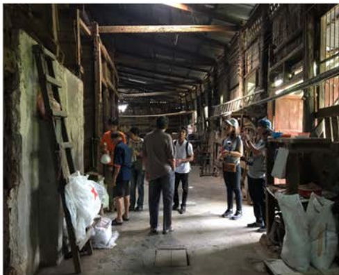
ภาพที่ 20 แสดงบรรยากาศในโรงเกลือแหลมทอง