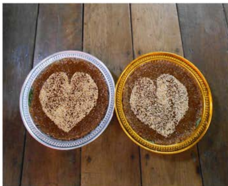
ภาพที่ 39 แสดงข้าวเหนียวแดงในพิธีขันหมาก