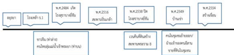
ภาพที่ 11 แสดงแผนผังสรุปที่พัฒนาการของชุมชนบ้านปูน