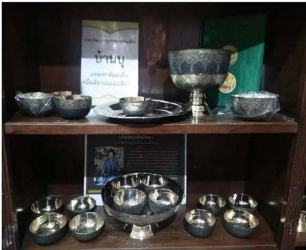
ภาพที่ 41 แสดงชั้นลงหิน (โรงงานเจียม แสงสัจจา)