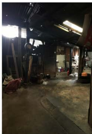
ภาพที่ 12 แสดงภายในโรงผลิตเตาอั้งโล่

จีน มอญ : แรงงานที่มาพร้อมการผลิตเตาและขนมจีน