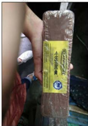
ภาพที่ 43 แสดงยาเงาที่ใช้ในการขัด