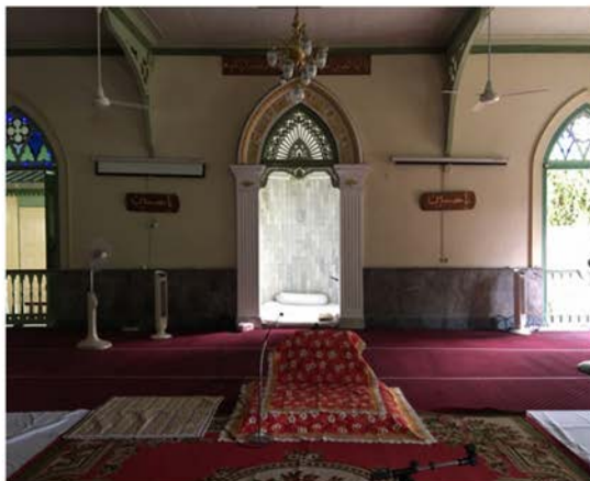
ภาพที่ 30 แสดงบรรยากาศในมัสยิดเซทิ อานนบุรีเขตที่ท่าพิชัย