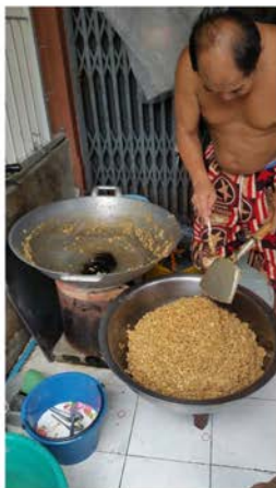
ภาพที่ 31 แสดงการทำกระยาสารของคนในชุมชน ที่มา ศศิธร ศิลปวุฒยา, 2561.