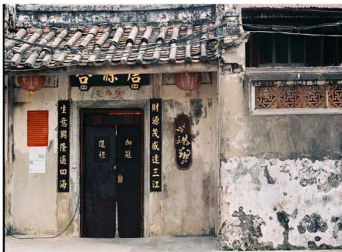
ภาพที่ 17 แสดงโรงน้ำปลาทั้งวันอะ ตั้งอยู่ใกล้บริเวณศาลเจ้ากวนอูบริเวณสวนสมเด็จพระศรีนครินทร์ฯ

นายกิตติ มคะปญโญ หรือเฮียเจี้ย เจ้าของกิจการห้างหุ้นส่วนจำกัด เกลือแหลมทอง เล่าถึงผู้คนและบรรยากาศย่านการค้าริมแม่น้ำแถบบริเวณคลองสานว่าเมื่อสมัยก่อน คลองสานเป็นอำเภอที่เล็ก แต่คึกคักในเรื่องการค้าขายไม่แพ้ย่านสำเพ็งหรือเยาวราช โดยเฉพาะในย่านคลองสานนี้ถือเป็นย่านธุรกิจขนาดใหญ่กว่าย่านอื่น ๆ ตั้งแต่คลองสานเลยไปจนถึงท่าดินแดงตลอดริมฝั่งแม่น้ำเป็นสถานที่ตั้งของโรงสีข้าว โรงงานต่าง ๆ รวมถึงโกดังเก็บสินค้าขนาดใหญ่ รวมถึงโรงเกลือของเฮียเองก็นับเป็นรูปแบบการค้าขายในแบบธุรกิจขนาดใหญ่ประเภทหนึ่งในขณะนั้น