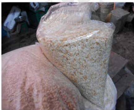
ภาพที่ 32 แสดงข้าวเม่าที่รับซื้อมาจากท่าเตียน

อย่างไรก็ตามจากคำบอกเล่าของคุณป้ากรองทองเล่าเดิมบริเวณนี้เคยเป็นเรือสวนไร่นา และมีความอุดมสมบูรณ์ไปด้วยผลไม้ และทรัพยากรที่พร้อมสำหรับทำขนม ดังนั้นในอดีตชุมชนครอบครัวตัวเองจึงนิยมทำข้าวเม่า และทำขนมที่ใช้ส่วนผสมของข้าวเม่าเป็นหลัก เช่น กระจยาสารท และข้าวเม่าหมี ส่วนการทำกละแฉะเริ่มทำภายในชุมชนเมื่อประมาณร้อยปีก่อน โดยน่าจะมาพร้อมกับกลุ่มคนมอญที่ย้ายถิ่นเข้ามาในชุมชน ในปัจจุบันการทำข้าวเม่าภายในชุมชนไม่หลงเหลือแล้ว แต่มีการรับซื้อข้าวเม่ามาจากตลาดท่าเตียนเพื่อนำมาทำกระจยาสารทขายในช่วงเทศกาล เช่น งานสงกรานต์ งานตรุษไทย และตามรายการสั่งซื้อเท่านั้น