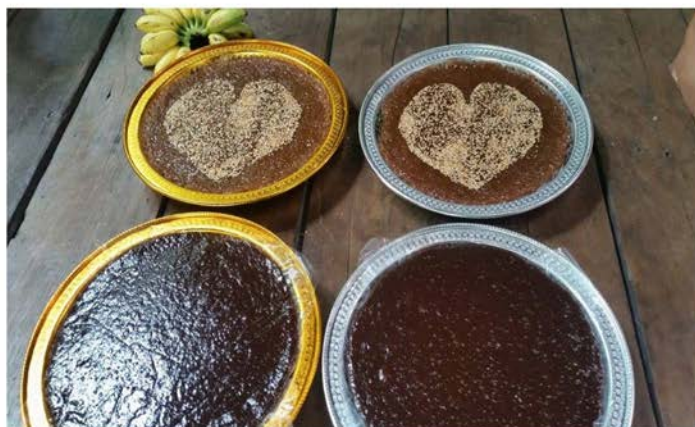
ภาพที่ 33 แสดงข้าวเหนียวแดงและกาละแมที่ใช้ในพิธีขันหมาก

เพื่อ นายคชภู ทุ่มะทัฬหะ ได้เล่าถึงการทำกาละแมในชุมชนไปพร้อม ๆ กับการกวนกาละแมบนเตาหิน เพื่อนำไปใช้เป็นขนมในพิธีขันหมากของคู่บ่าวสาวในวันอาทิตย์ที่จะถึงนี้ ก่อนหน้านั้นได้มีการทำข้าวเหนียวแดงไปก่อนแล้ว ที่เฝ้าว่าข้าวเหนียวแดงและกาละแมเป็นของสำคัญสำหรับจัดงานขันหมากในพิธีการสู่ขอแต่งงานของไทย โดยถือว่าสีแดงของข้าวเหนียวแดง คือ ความมงคล ส่วนความเหนียวของข้าวเหนียวแดง และกาละแมสื่อถึงความรักอันเหนียวแน่น และงาที่ใช้โรยบนขนมเปรียบเสมือนความรักที่เจริญงอกงาม โดยในอดีตในชุมชนตรอกข้าวเม่าเป็นไปด้วยบ้านที่รับทำขนมในพิธีกรรมประเพณี แต่ในปัจจุบันเหลือเพียงบ้านหลังเดียวที่ยังคงทำกาละแมแบบดั้งเดิมของชุมชน