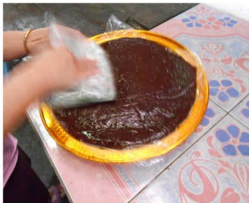
ภาพที่ 37 แสดงการเตรียมกอละแมสำหรับพิธีขึ้นหมาก ที่มา ศศิธร ศิลปวุฒยา. 2560.