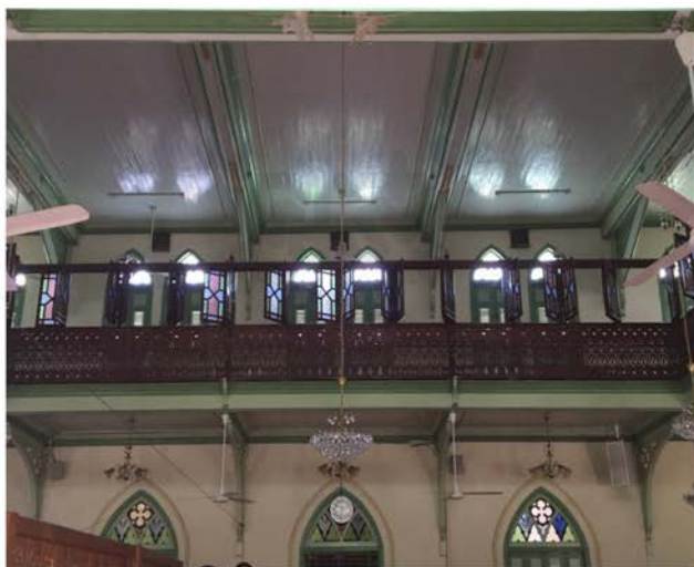
ภาพที่ 29 แสดงบรรยากาศในมัสยิดเซฟิ