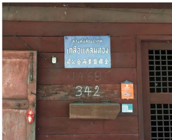
ภาพที่ 18 แสดงโรงเกลือแหลมทอง