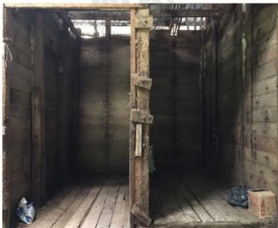
ภาพที่ 21 แสดงบรรยากาศของห้องที่ใช้ผลิตเกลือในอดีต