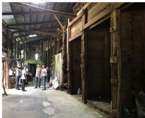
ภาพที่ 19 แสดงบรรยากาศในโรงเกลือแหลมทอง