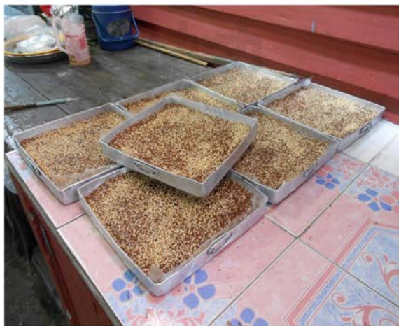
ภาพที่ 40 แสดงข้าวเหนียวแดงสำหรับสงขาย