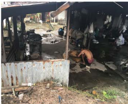
ภาพที่ 13 แสดงภายในโรงเตาอั้งโล่ปรับเปลี่ยนเป็นบ้านเช่า