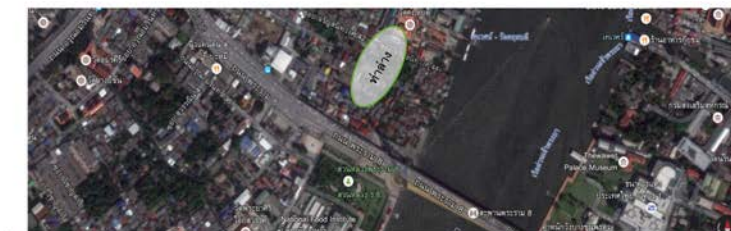
ภาพที่ 8 แสดงภาพถ่ายอากาศบริเวณชุมชนท่าล่าง

ในอดีตพื้นที่บ้านปูนจะแบ่งเป็น 2 ส่วน ตามแนวกำแพงวังเจ้าอนุวงศ์ จากการสัมภาษณ์นายนำชัย ศิวกุล กัธร (เนี้ยว แซ่หลาย) อายุ 76 ปี เป็นรุ่นที่ 2 ของตระกูลเล่าว่า แต่เดิมคนในชุมชนบ้านปูนในพื้นที่ปัจจุบันจะเรียกว่า “ชุมชนท่าบน” ประกอบไปด้วยผู้อาศัยคนไทย และเรียกบริเวณที่ถัดจากกำแพงเจ้าอนุวงศ์ลงไป ซึ่งเป็นบริเวณใต้สะพานพระราม 8 ในปัจจุบันว่า “ชุมชนท่าล่าง” ซึ่งเป็นที่อยู่อาศัยของชาวจีน