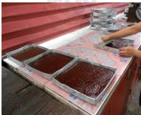
ภาพที่ 38 แสดงกอละแมสำหรับสังฆาย ที่มา ศศิธร ศิลปวุฒยา. 2560.