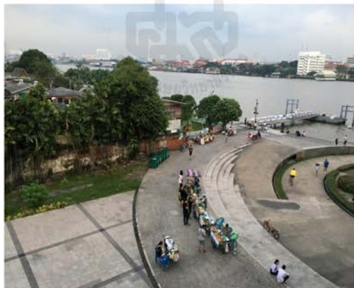
ภาพที่ 14 แสดงบริเวณพื้นที่ใต้สะพานพระราม 8 ในปัจจุบัน ที่มา ศศิธร ศิลป์พัฒนยา, 2560.

แต่ในวันนี้ความเปลี่ยนแปลงได้เกิดขึ้นแล้ว “เพื่อนบ้าน” หลายคนของเธอต้องขนข้าวของออกจากบ้านปูน แยกย้ายกันไปหาที่อยู่ใหม่ พร้อม ๆ กับการเวนคืนที่ดินเพื่อก่อสร้างโครงการสะพานพระราม 8 คนที่เคยอาศัยอยู่ในท่าล่าง ต่อเมื่อถูกไล่อื้อในช่วงการสร้างสะพานพระราม 8 ก็ได้ย้ายออกไปเข้าบ้านอยู่ที่ชุมชนคฤหบดีและยังคงค้าขาย มีปฏิสัมพันธ์อันดีกับคนในชุมชนอยู่ เช่น ป้าแดงยังคงสืบทอดอาชีพขายเป็ดทะเล่จากรุ่นพ่อแม่ซึ่งเป็นคนจีนแต่จี๊วที่เคยอาศัยอยู่บริเวณท่าล่างเดิมโดยปัจจุบันส่วนมากจะนำอาหารไปขายบริเวณใต้สะพานพระราม 8 ในช่วงเย็น ซึ่งพื้นที่ตรงนี้ส่งวนสิทธิ์สำหรับคนในชุมชนใกล้เคียงเท่านั้น แต่ก็มีบางส่วนที่ย้ายออกพร้อมกับความสัมพันธ์ ความสนิทชิดเชื้อในชุมชนได้หายไป