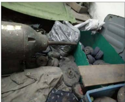
ภาพที่ 42 แสดงเครื่องปั่นมอเตอร์ตีตุลทรายและลูกผ้า