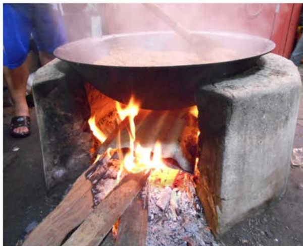
ภาพที่ 34 แสดงเตาหินที่ใช้กวนกาละแหม

เตาหินซึ่งเป็นเตาที่ก่อด้วยอิฐแดงฉาบปูน และใช้หินในการให้ความร้อน ในปัจจุบันพื้นที่นำมาใช้ คือ ไม้หน้าสาม แทนที่ไม้แสมที่มีราคาแพงและหายากมากขึ้น โดยจะนำแผ่นสังกะสีมาวางทับบนกองหินอีกชั้นเพื่อให้ทำให้อุณหภูมิกระจายไปรอบ ๆ กระทะและป้องกันไม่ให้ไฟโดนกันกระทะซึ่งจะทำให้กาละแหมไหม้ได้