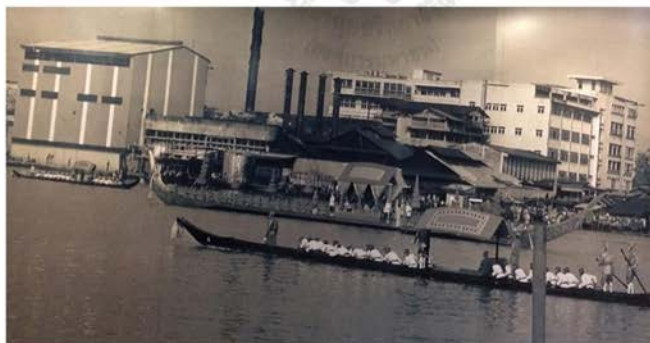
ภาพที่ 10 แสดงภาพถ่ายโรงงานสุราบางยี่ขันในอดีต