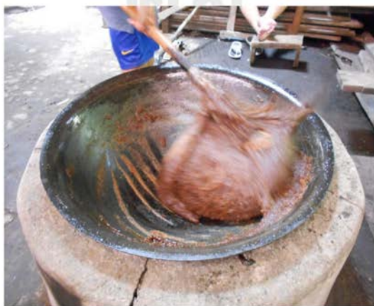
ภาพที่ 36 แสดง “การโย้” กอละแม