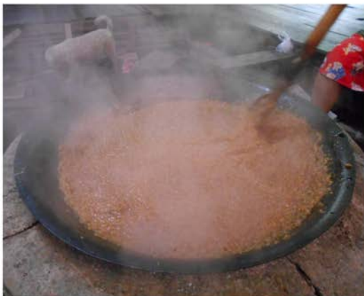
ภาพที่ 35 แสดงกอละแมในช่วง 5 ชั่วโมงแรกที่ยังไม่จับตัวเป็นก้อน